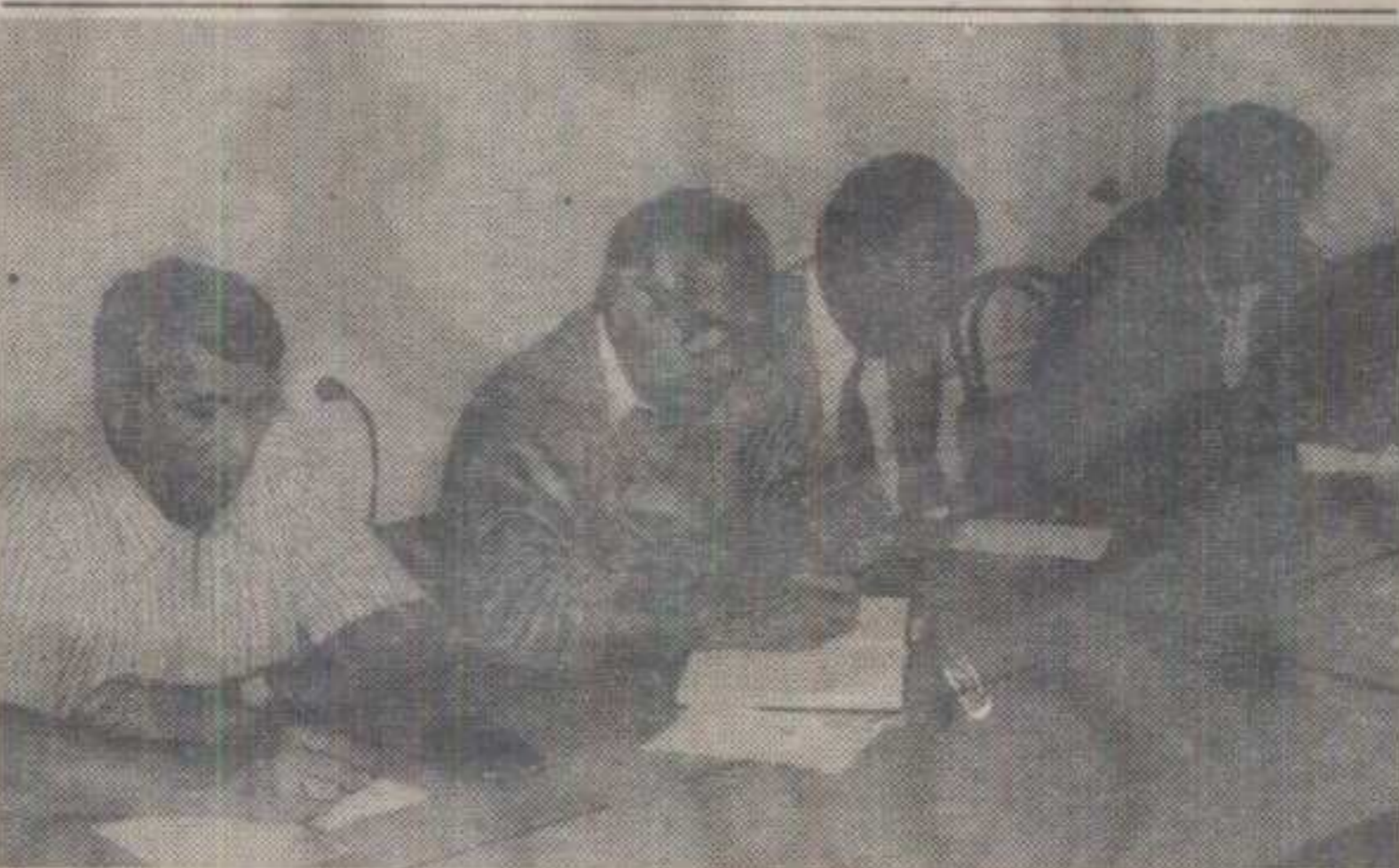
СИНДИКАЛНИ ПРЕДСТАВНИЦИ РАДНИКА У ОБРАЗОВАЊУ: ЗА РЕДОВНИЈЕ ИСПЛАТЕ

• Синдикални представници радника у образовању и култури изразили наду да ће запосленима у овој грани до краја месеца бити исплаћене јулске и августовске зараде, како је и обећано