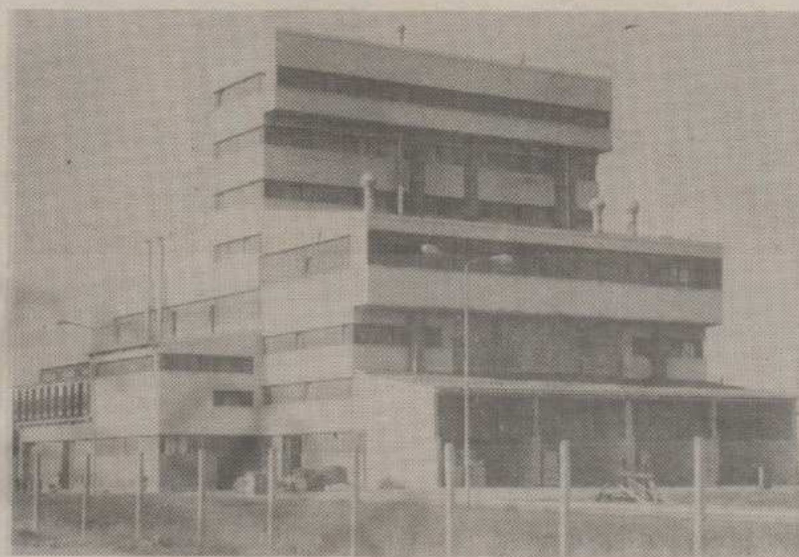
ЗНАТНО ПОВЕЋАЊЕ ПРОИЗВОДЊЕ И ИЗВОЗА

Најбољније питање, свакако је била и остала исплата зарада. Констатовано је да испуњавање постављених циљева у производњи престају свака могућа правдања за нередовно исплаћивање плата и да ће до краја године руководство морати двомесечни заостатак у исплатама да надокнади. Програм мера инсистира, пре свега, на редовности, исплате зарада, а тек онда на повећању. Закључено је да битних повећања плата до краја године не може бити јер за то не постоје материјални услови, али је остављена могућност да се за производне це-