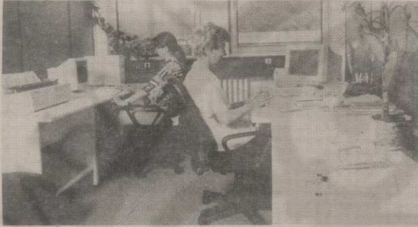
ОПРЕМЉЕНИ РАЧУНСКИ ЦЕНТАР КОМПАНИЈЕ »ОСИГУРАЊЕ ДУНАВ« У БЕОГРАДУ

Вреди истаћи најуспешније салоне: Пожаревац са прометом од преко 200 хиљада динара, »Јединство« у Краљеву 74 хиљаде, Власотинце са 72 хиљаде, Рибница, Подгорица, Пљевља и Ушће са око 50 хиљада динара, затим, следе Крагујевац и Обреновац са преко 40 хиљада