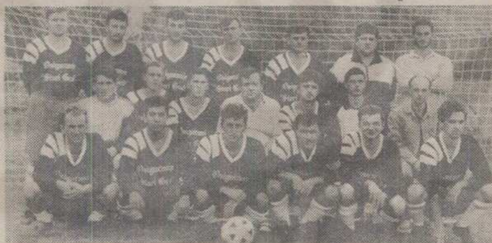
ЈЕДАН АЛИ ВРЕДАН ТИМ БОРЧЕ ПРЕД ПОЧЕТАК МЕЧА СА ЕКИПОМ МЛАДОСТ (ВРДИЛА)