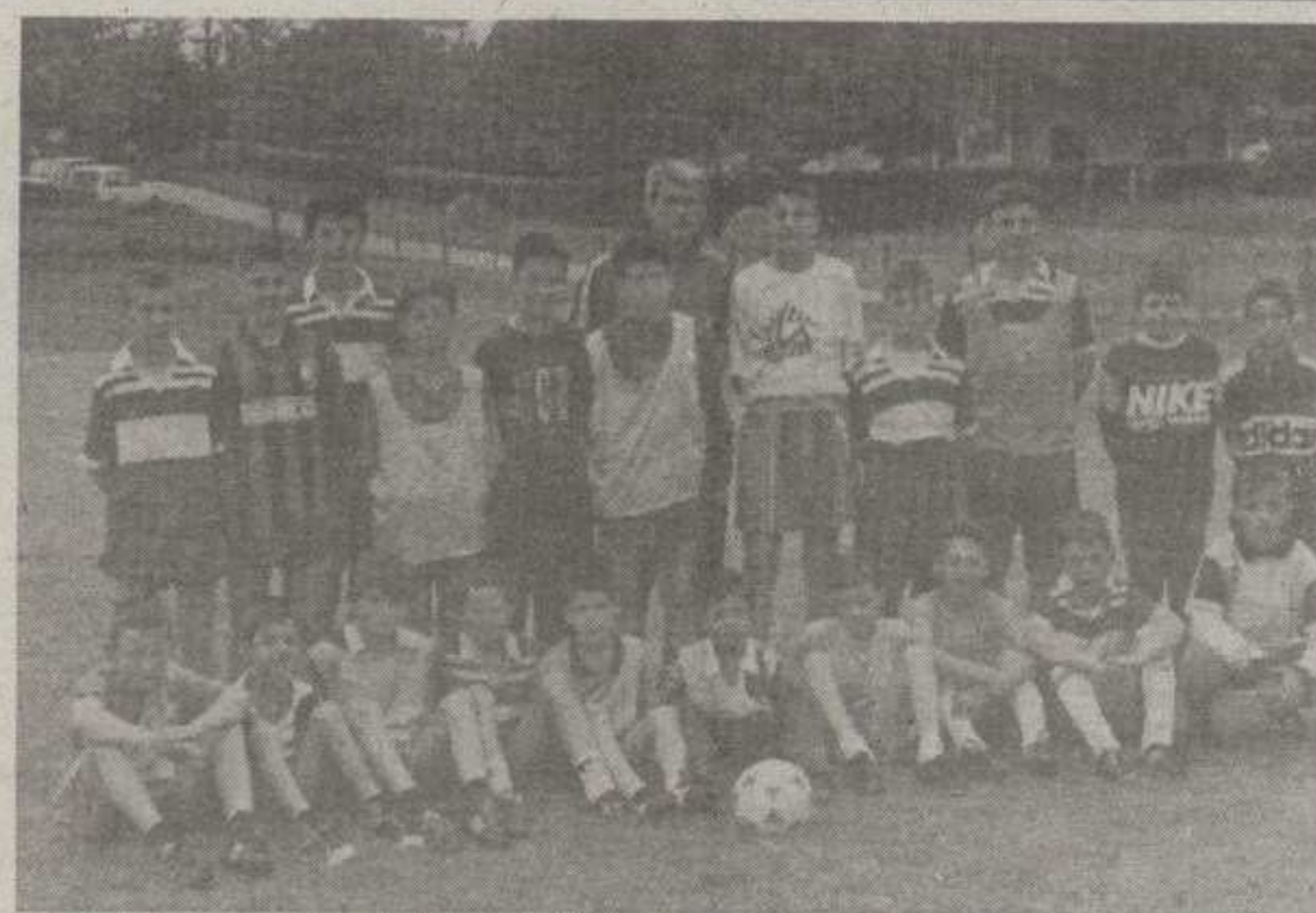
ТЕШКО СПРОВОЂЕЊЕ ПРОГРАМА: ПИОНИРИ ЧИБУКОВАЦА СА ТРЕНЕРОМ ПАРАЂАНИНОМ

Ова фудбалска дружина мала али одабрана постиже добре резултате у Општинској пионирској лиги па отуда и тренутна подела прве позиције. У екипи има и неколико вансе-