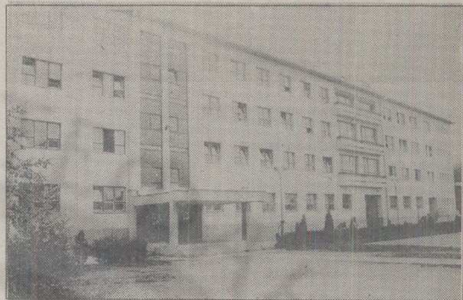
КОРАК ПО КОРАК У «ВЕЛИКОМ СПРЕМАЊУ» ШКОЛСКЕ ИНФРАСТРУКТУРЕ

Организациони одбор «Дана преображења» накнадно ће доне-