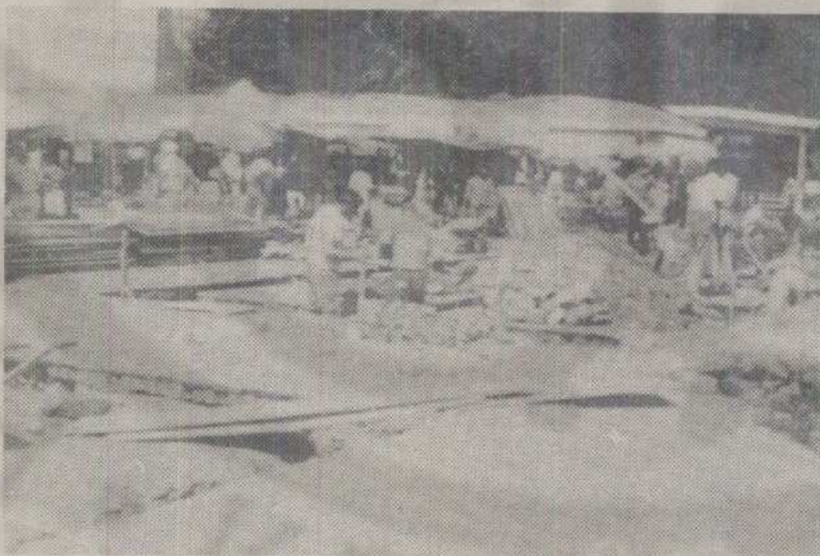
УСКОРО ЛЕПШЕ И ФУНКЦИОНАЛНИЈЕ – РАДОВИ НА ПИЈАЦИ

Наиме, Јавно предузеће «Пијаца» и Друштвено предузеће «План», закључили су уговор о изградњи 30 локала дуж Београдске улице, укупне површине 530 квадратних метара. Извођач радова се обавезао да локале, по систему кључ у руке, преда до 20. октобра. Вредност посла је милион и 500.000 динара.