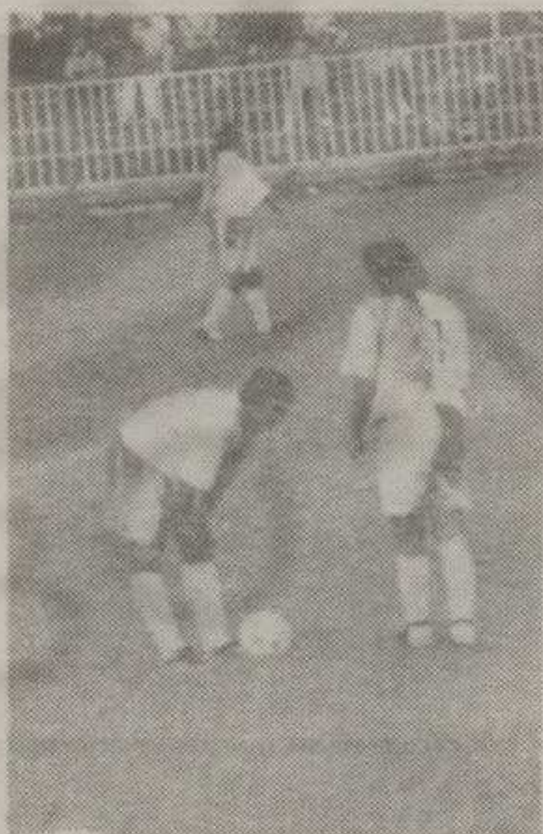
ДОБИТНА КОМБИНАЦИЈА ЗА ДРУГУ ЛИГУ: ЖЕРАЋАНИН И ВУКОМАНОВИЋ

Прави и последњи испит спремности за неизвесну и iscrpljivу битку за јесење бодове