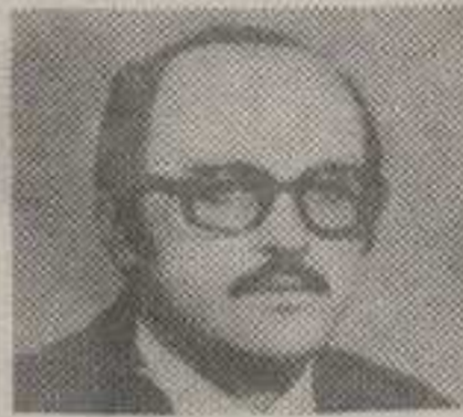
Предраг-Драган Остојић шаховски велемајстор