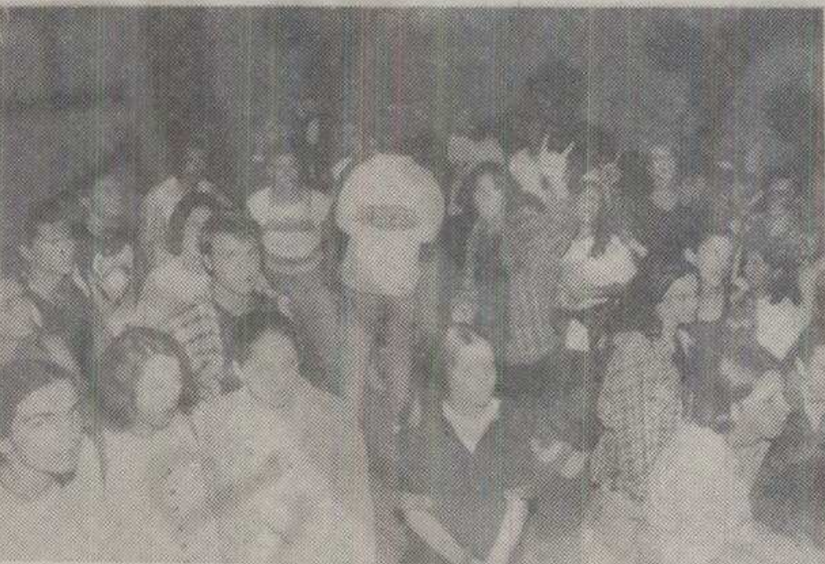
СА РОК КОНЦЕРТА ПРОШЛЕ СУБОТЕ У КРАЉЕВУ

представља мали заокрет у том правцу. Наиме, прошли концерт је најва серијала од још неколико