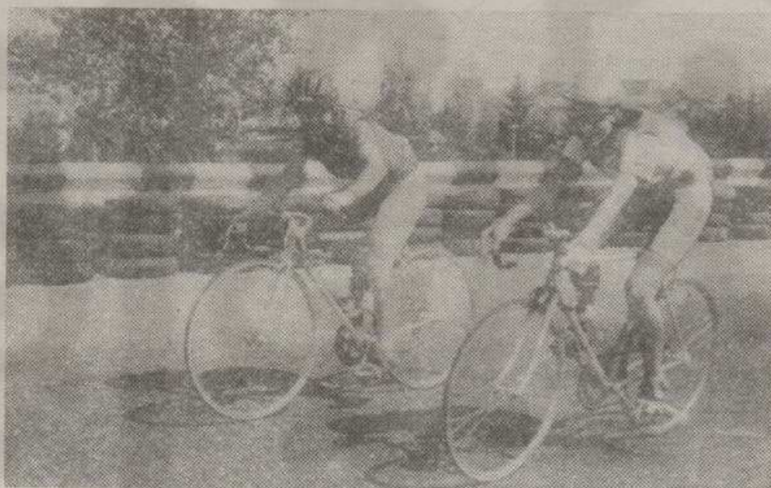
»АМАЗОНКЕ« НА ДВА ТОЧКА: УЧЕСНИЦЕ БИЦИКЛИСТИЧКЕ ТРКЕ

ОДБОЈКАШИ РИБНИЦЕ ОКУПИЛИ СЕ ПРЕД ПОЧЕТАК ПРИПРЕМА