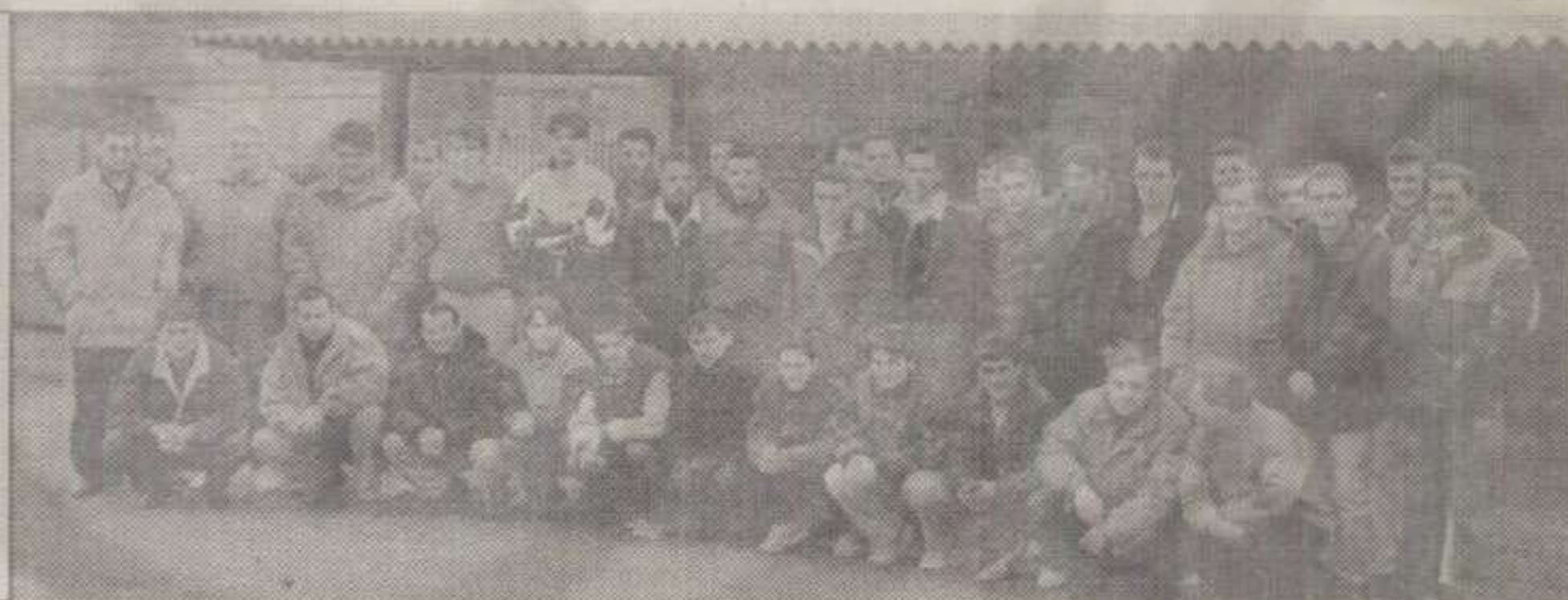
ЗА ПОЧЕТАК ЗАЈЕДНИЧКИ СНИМАК: ОМЛАДИНСКИ ФУДБАЛСКИ КЛУБ КРАЉЕВО

« Појачања из сивомаслините униформе • Серија пријатељских утакмица • Виши ранг већ на виду