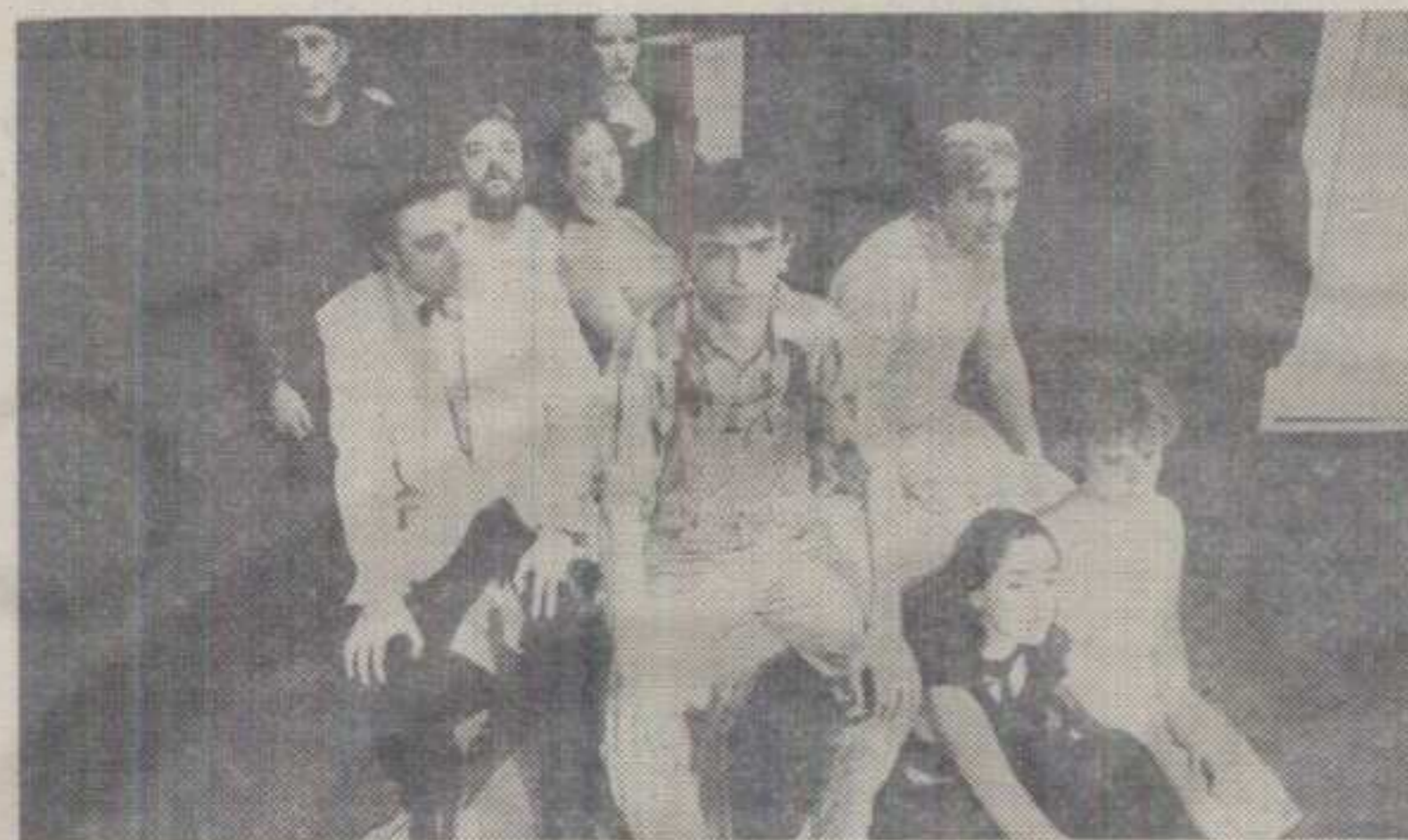
ЕКИПА «БОЖЈЕГ ГНЕВА» КРАЉЕВАЧКОГ ПОЗОРИШТА

Као што све овоземалско у духовној сфери не подлже никаквој пола-