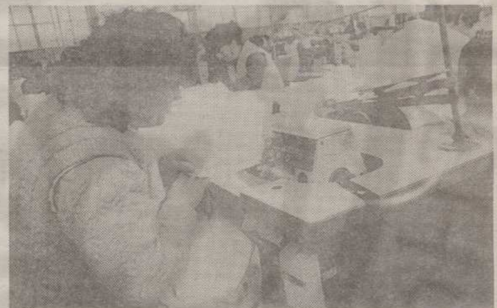
КОНФЕКЦИЈА «РУДНИК»: УСКОРО СВИ НА ПОСЛУ

кроз неколико дана почети да производи 6.500 одевних пред-