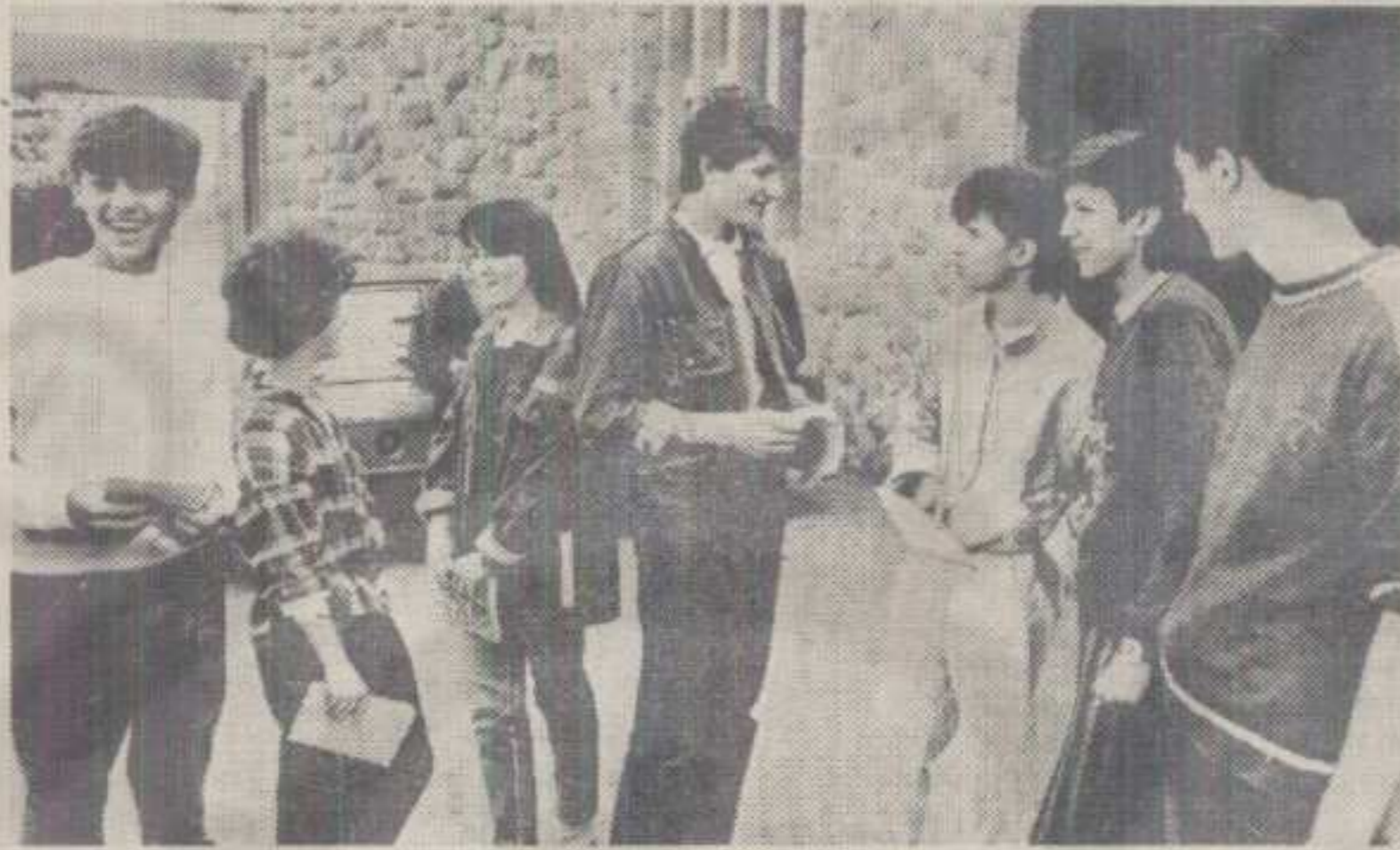
СА СОЦИЈАЛИСТИЧКОМ ПАРТИЈОМ БУДУЋНОСТ ИЗВЕСНА

У Програму Општинског савета истакнута је потреба за стварањем бољих услова за школовање