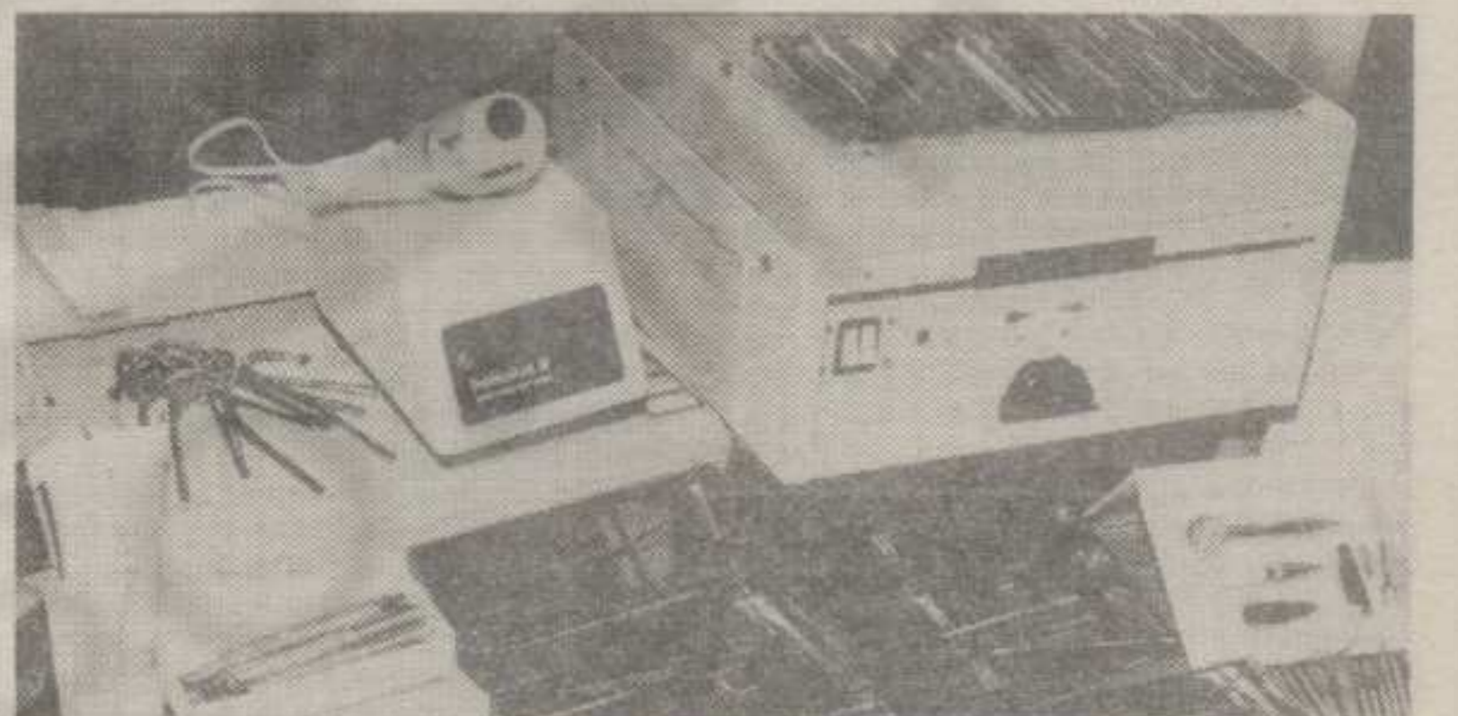
ДЕО ОПРЕМЕ КОЈУ ЈЕ ТРОЈКА МАЛОЛЕТНИКА ИЗ КРАЉЕВА УКРАЛА ИЗ ЗУБНИХ ОРДИНАЦИЈА У ШКОЛАМА «ДИМИТРИЈЕ ТУЦОВИЋ» И «ИВ КРАЉЕВАЧКИ БАТАЉОН» – ИЗ ДОКУМЕНТАЦИЈЕ КРАЉЕВАЧКОГ СУП-а