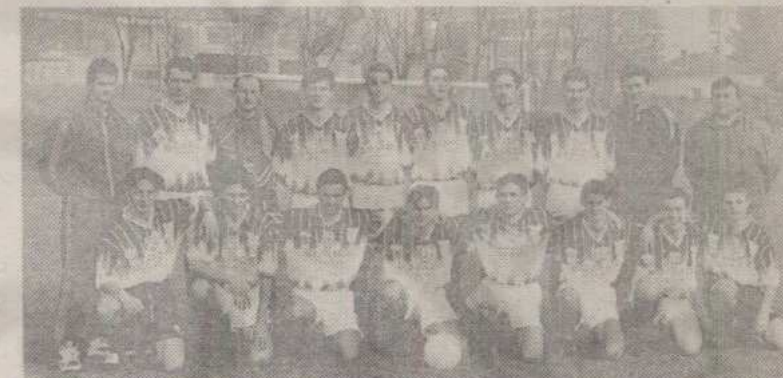
ЗАЛЕТ ЗА ПРОЛЕЋНЕ БИТКЕ: ТИМ ЧИБУКОВЦА ИЗ ЈЕСЕЊЕГ ДЕЛА ПРВЕНСТВА