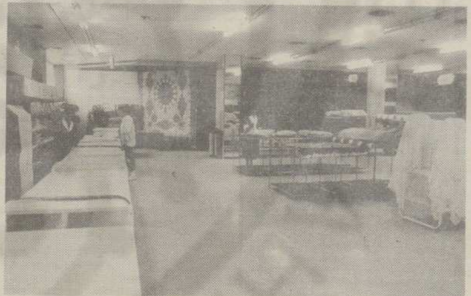
ПОЛА ПРАЗНО, А ПОЛА СЕ ТЕШКО ПРОДАЈЕ

И цене на зеленој пијаци добиле су мирис јесени. Иако је понуда релативно добра, учинак летњег града, повећање цене бензина, а и остала поскупљења (пре свега струје) повшали