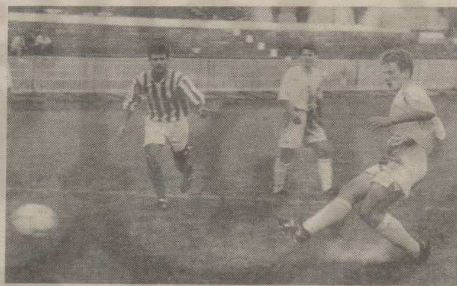
МИНУТ 47: ЂУРИЋ НЕПОГРЕШИВ СА БЕЛЕ ТАЧКЕ

лу тачку. Дуго су протестовали Крагујевчани, из гледалишта се стекао утисак да је казнени ударац