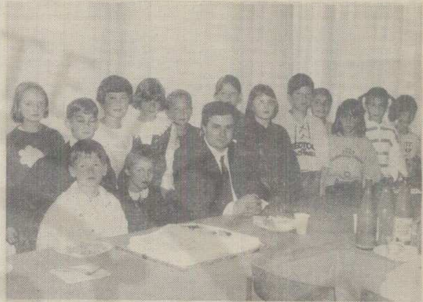
НАЈДРАЖИ ГОСТИ »АУТОТРАНСПОРТА« - СВИ ЊИХОВИ ОДЛИКАШИ

Са малим закашњењем, које, међутим, не умањује величину и лепоту геста, запослени у «Аутотранспорту» из Краљева организовали су прошлог петка свечаност у част 160 одличних основаца и средњошколаца - деце радника овог предузећа. На тој зајисти неуобичајеној свечаности власницима петица «укњижених» на крају школске 1994/95. године подељени су поклони у књигама, као што је прошлх, срећних година, био обичај у свим основним и средњим школама.