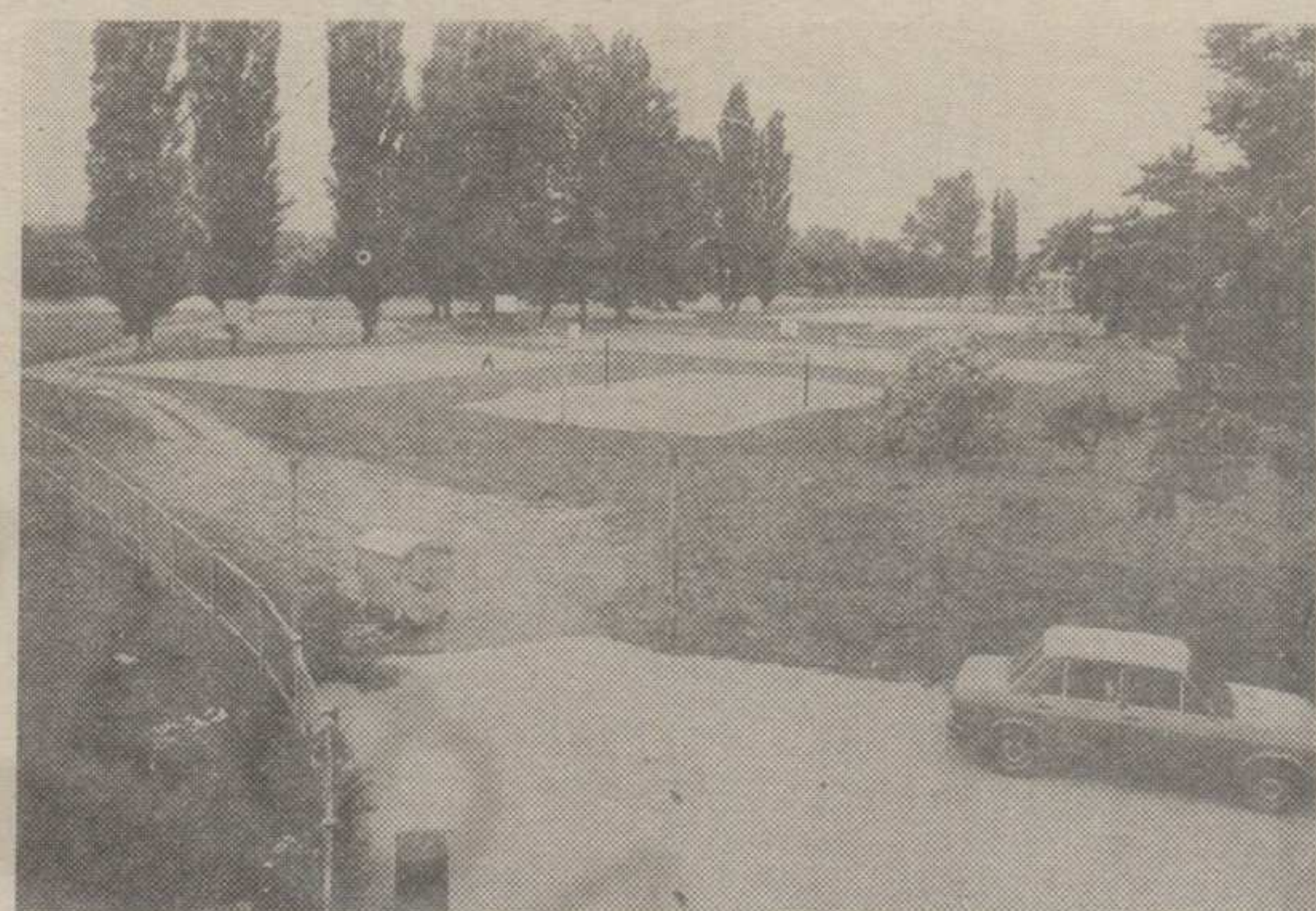
ДЕО ОТВОРЕНИХ СПОРТСКИХ ТЕРЕНА

Што због локације у најстрожем центру града (двеста метара од популарног »Милутина« на централном градском тргу) а што деценијске везаности Краљевчана за Ибар, простор између Ибар-