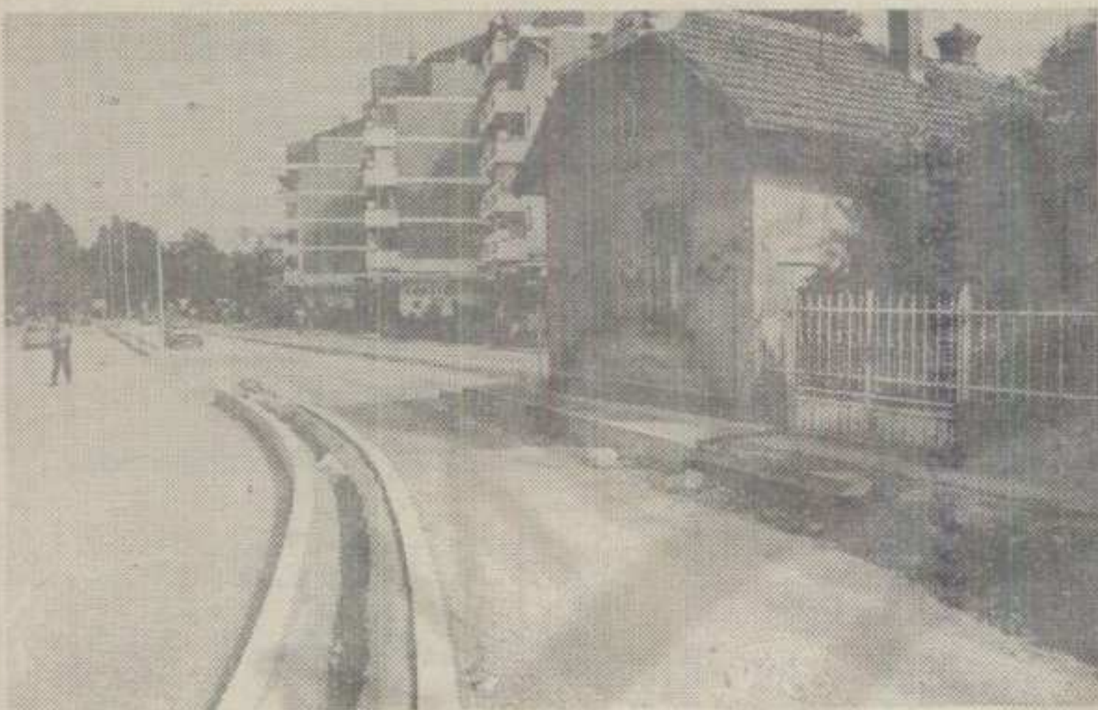
КУЋА НА ОСАМИ: СЛЕДИ ПРЕМЕШТАЈ У ДВОРИШТЕ ПА ИЗГРАДЊА ДРУГЕ ТРАКЕ

• Иако Улица Војводе Степе чија реконструкција је у току, једним делом има само једну коловозну траку, договор инвеститора, урбаниста и власника је на помолу