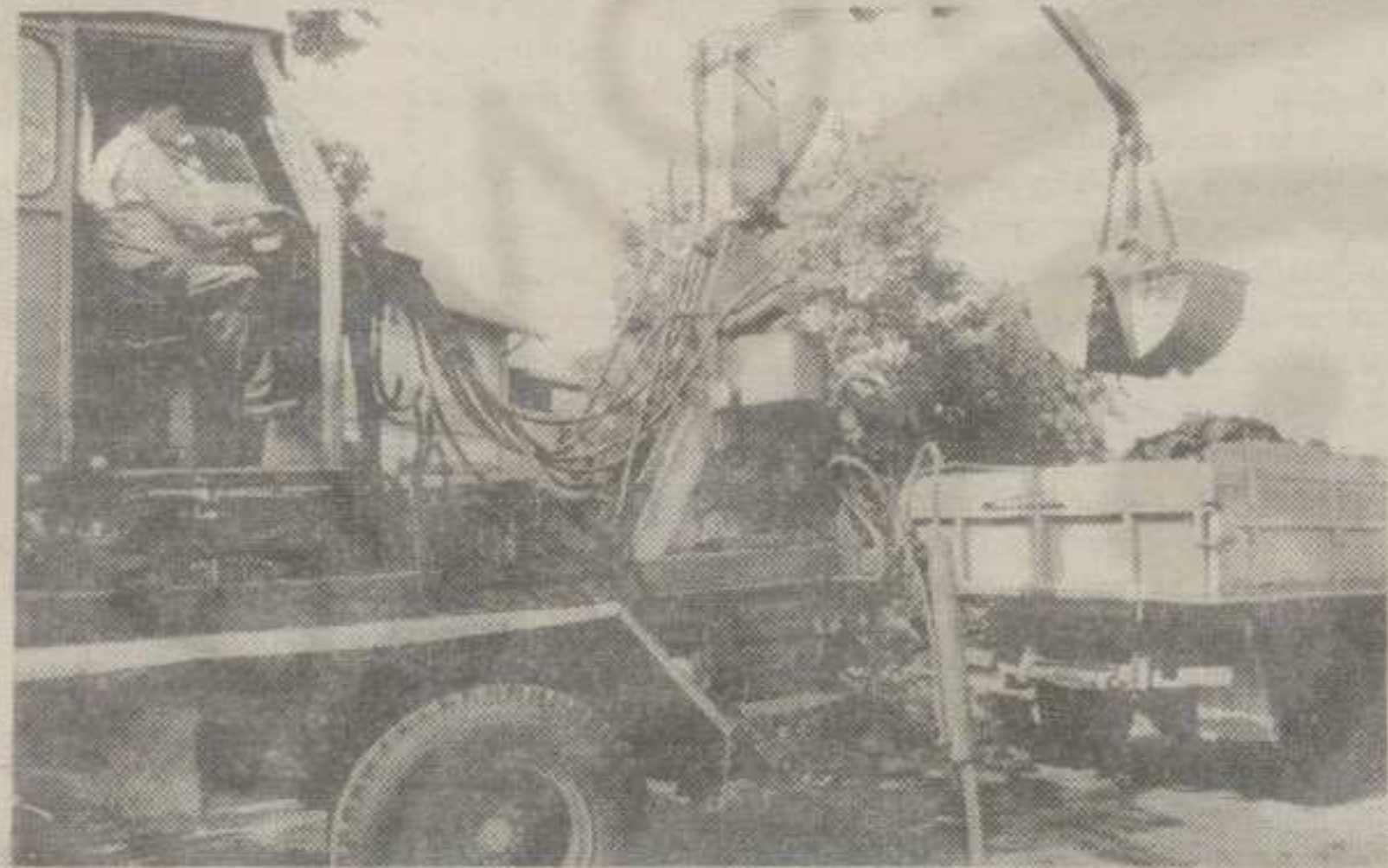
ОГРЕВ СКУП КАКО ГОД ОКРЕНЕШ

у границама могућности, а замена опреме која је непоуздана за предстојећу зимску сезону почиње ових дана и обавиће се према највама до половине октобра.