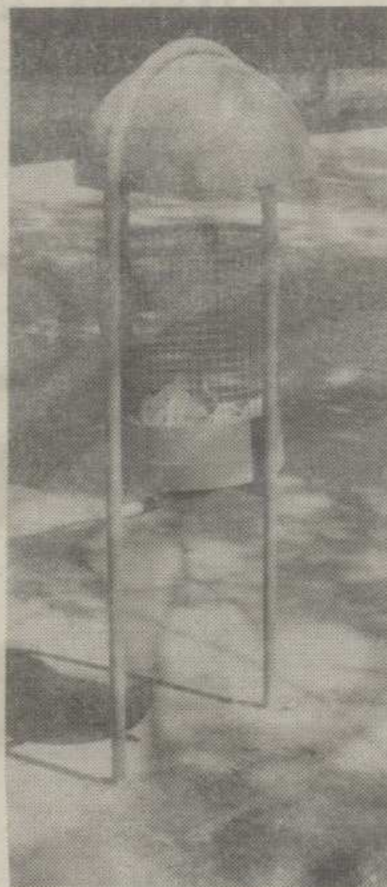
САЧУВАТИ ИМИЦ НАЈЛЕПШЕГ И НАЈЧИШЋЕГ ГРАДА: НОВЕ КАНТЕ ЗА ОТПАТКЕ У ЦЕНТРУ ГРАДА

Само када би још и они који, на жалост, у последње време све чешће показују рушничке нагоне обуздали свој «темперамент» и потрудили се да канте за отпатке и клупе трају што дуже, Краљево би заиста после шестог пута како се постављају нове канте и по ко зна који пут како се постављају нове клупе, могло заиста да и даље буде предиван град.