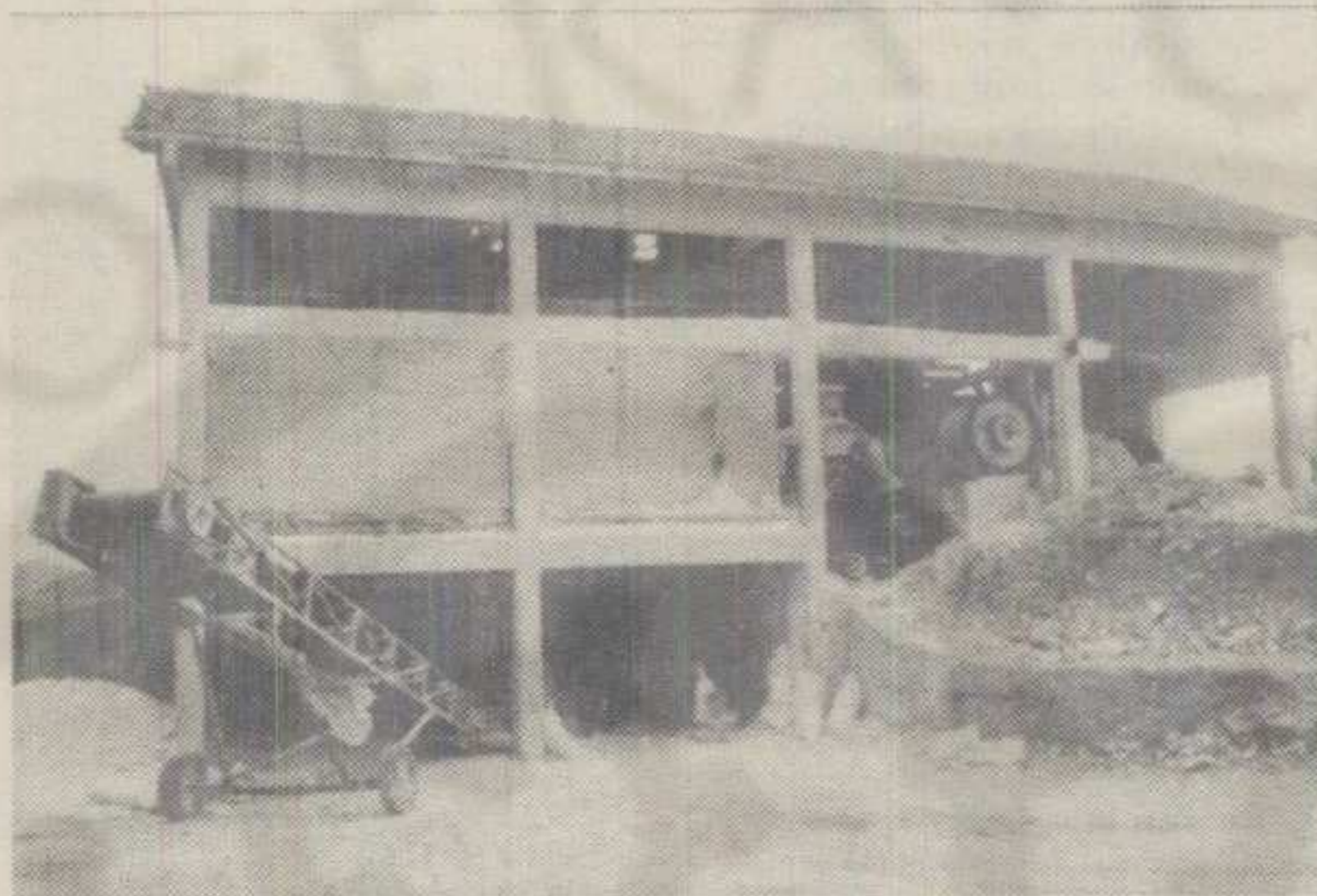
ДРОБИЛИЦА ЗА МЛЕВЕЊЕ КАМЕНА

• Након година бављења трговином, производња грађевинског материјала постала примарна • Уз беле, црне и зелене, ускоро и црвени гранулати • Примљено 6 нових радника а примиће још 4 за рад у производњи • Креће се са програмом увођења система квалитета према међународним стандардима ЈУС ИСО 9000