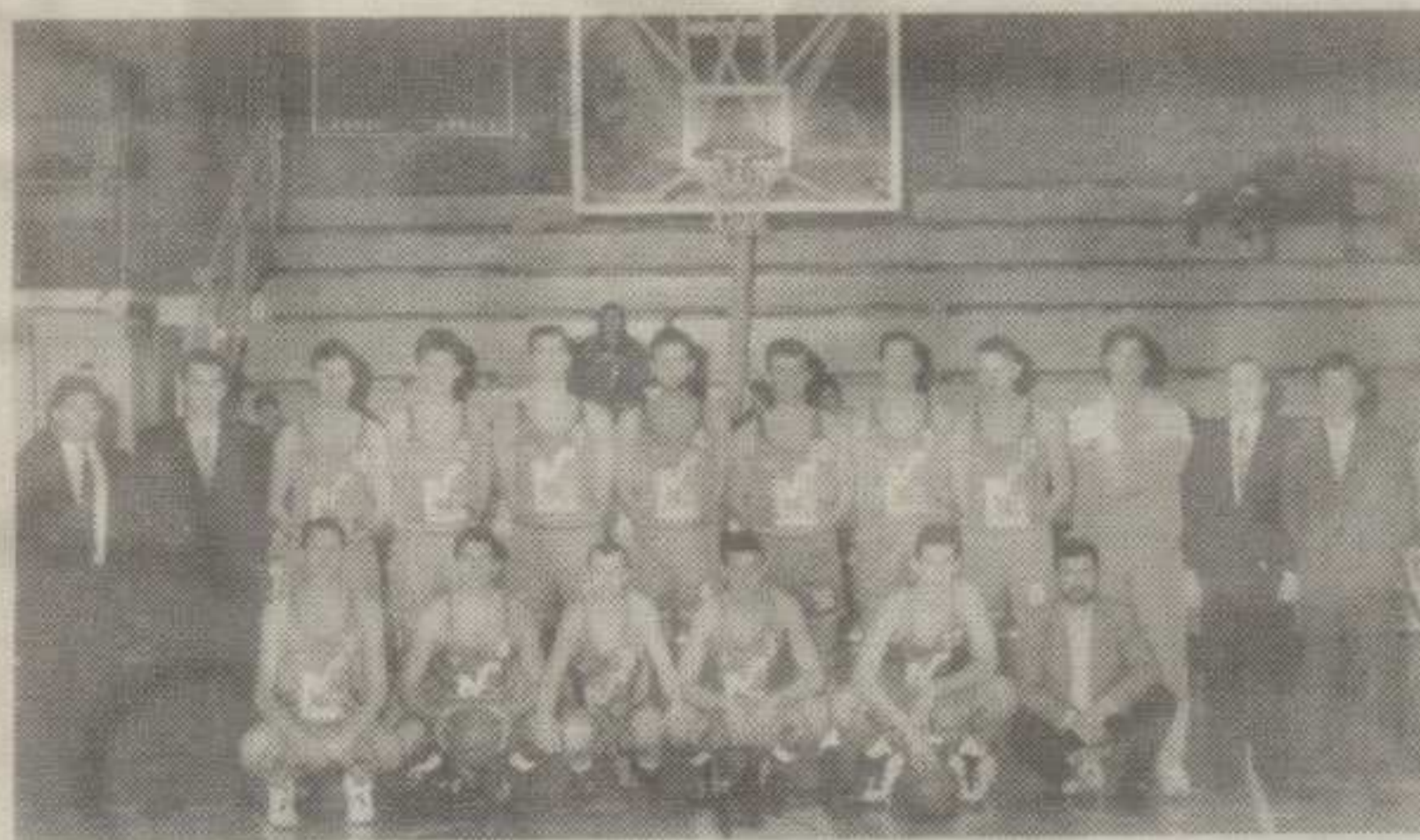
СВИ НА БРОЈУ — ПРИДЕ ПОЈАЧАЊА: ЕКИПА МАШИЊА

У недељу увече завршен је први овогодишњи прелазни рок за кошаркаше а спектакуларних трансфера, бар што се два краљевачка прволиташа тиче, није било.