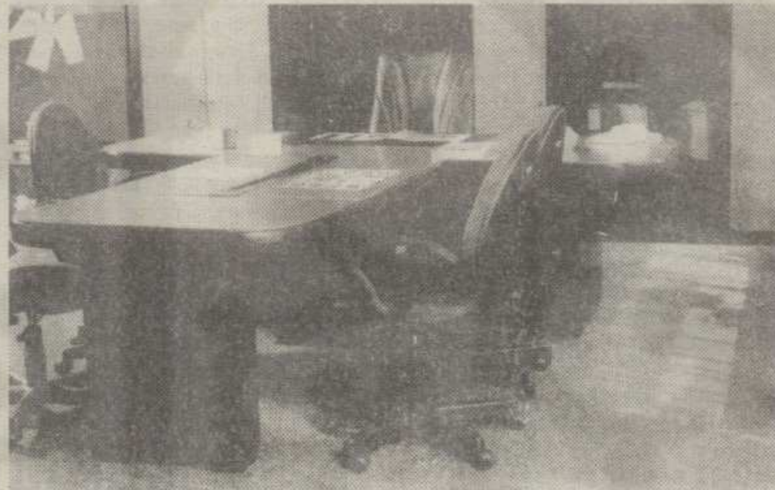
ОПРЕМЉЕН РАДНИ КАБИНЕТ КАНЦЕЛАРИЈЕ НОВИМ НАМЕШТАЈЕМ »ЈАСЕНА«