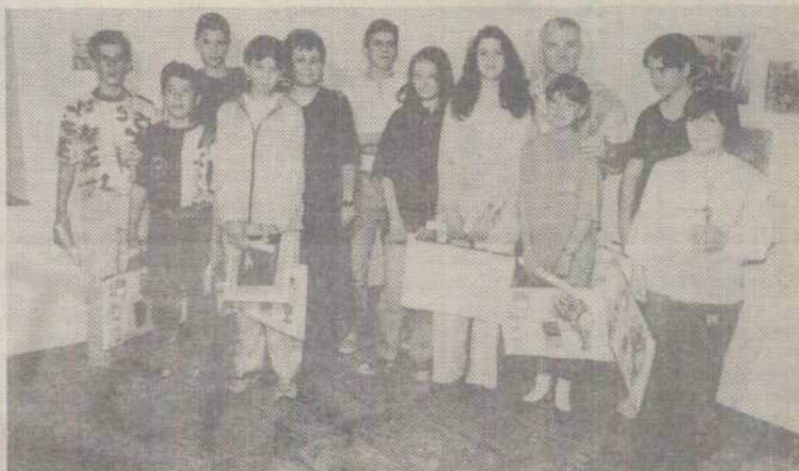
НАГРАЂЕНИ УЧЕСНИЦИ МАЈСКОГ САЛОНА