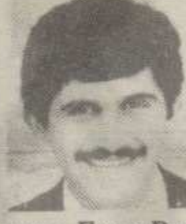
Бранислав Бане Руменић пуковник Војске Југославије

трагично је изгубио живот у 45. години, на задатку у Вуковару, 29. маја 1995. године.