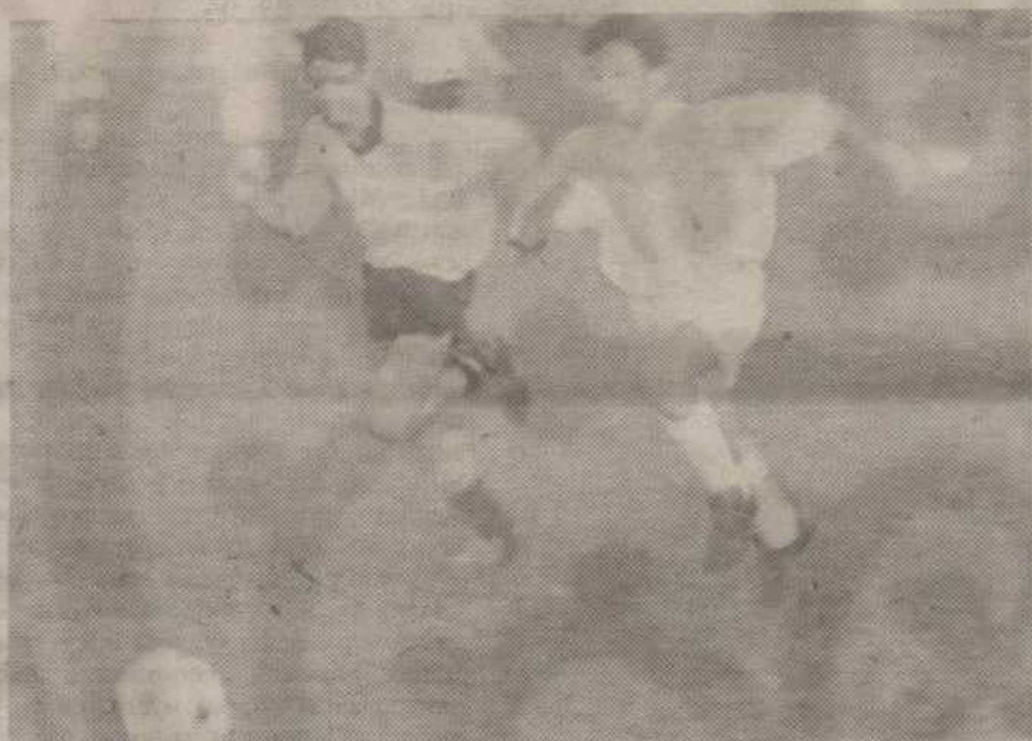
МНОГООБРОЈНИ ГЛЕДАОЦИ ВИДЕЛИ СУ ВРХУНСКИ ФУДБАЛ ШАЛИНИЋ У БОРЕИ СА СВОЈИМ ЧУВАРОМ