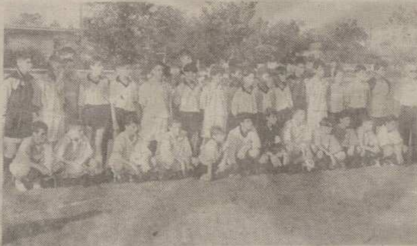
ЗАЈЕДНИЧКИ СНИМАК ЕКИПА »БУБАМАРЕ« И БАЛТОХОРА ПРЕД ПОЧЕТАК УТАКМИЦЕ (12:0)