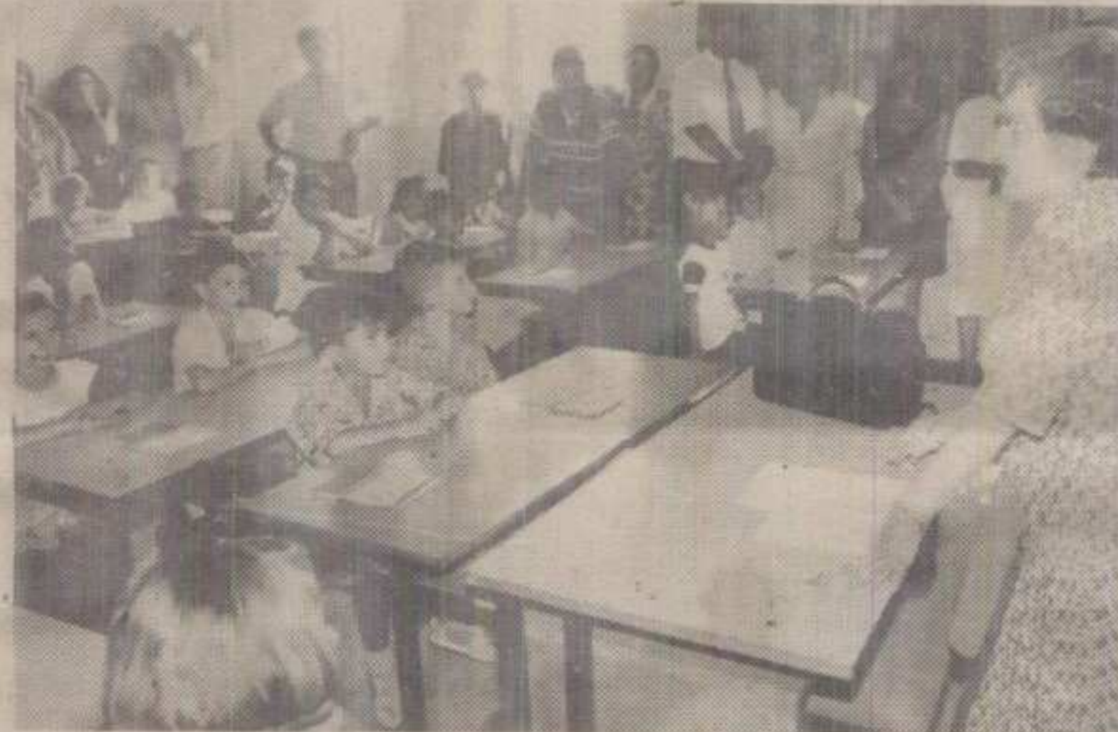
МОДЕЛ ОБРАЗОВАЊА – ЊИМА ПО МЕРИ?

Група млађих основца Школе »Четврти краљевачки батаљон« са родитељима провела је добар део првог радног дана нове школске године у холловима Скупштине општине, незадовољна променом учитеља, којом би се постигло да ова васпитно-образовна установа преброди непријатно и прво искушење звано – технолошки вишак међу наставним особљем. Будући да су захтеви родитеља, па и деце, измањипулисали од њих самих, уважени – смисао је да је једна учитељица, са добрим искуством и добрим резултатима рада, ипак остала без дневника у овој школској години, али иста судбина догодине и наредних година чека можда и неке њене колеге. Сличну ситуацију имаће и друге градске школе, не само у Краљеву.