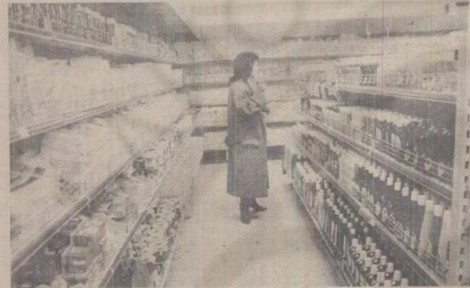
У ОЧЕКИВАЊУ ВЕЋЕГ БРОЈА ПОТРОШАЧА: ИЗ СУПЕРМАРКЕТА РОБНЕ КУЋЕ «БЕОГРАД» У КРАЉЕВУ

пања и на 2 до 3 чека. Први чек се реализује одмах, а остала два на одложено. Један број потрошача робу може куповати посредством БЕО - картице. У догледно време планира се да се уведу и потрошачки кредити, што би требало