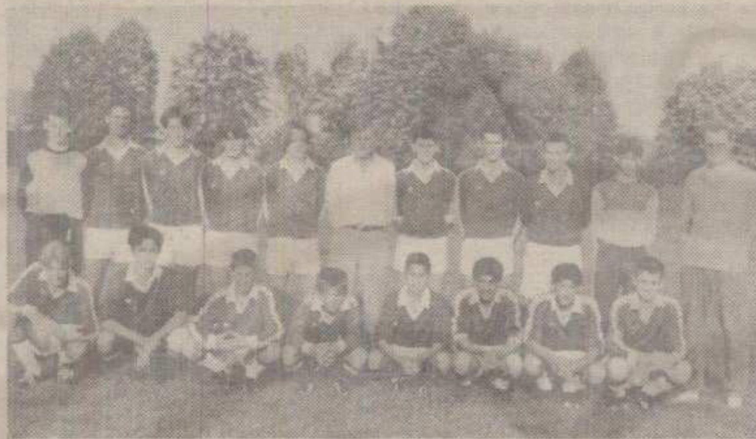
ЈА РАДИМ – ДРУГИ ОТИМАЈУ: ЈУНИОРСКА ЕКИПА МАГНОХРОМА КОЈЕ ВИШЕ НЕМА

Моје колеге требале су да сачекају још ову годину да депа сазру фудбалски па онда да праве калкулације за себе. Мислим да је »Маг-