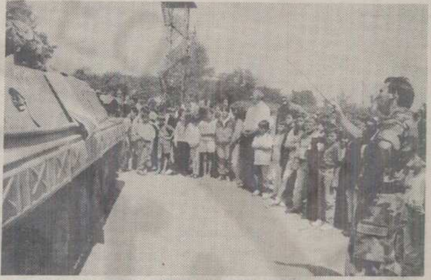
ЧЕЛИЧНА ГРДОСИЈА У РУКАМА ДОБРО ОБУЧЕНИХ МЛАДИЋА ПОСТАЈЕ МОЉНО И НЕЗАДРЖИВО ОРУЂЕ. ЗАТО ЈЕ И НАЈВЕЋЕ ИНТЕРЕСОВАЊЕ ЂАКА ПОБУДИО ОВАЈ САВРЕМЕНИ ТЕНК

По први пут ове године 16. јун обележава се као Дан Војске Југославије. И тим поводом у свим јединицама краљевачког гарнизона одржани су технички зборови. Камера нашег фоторепортера Милисава Радовановића забележила је неке од њих.