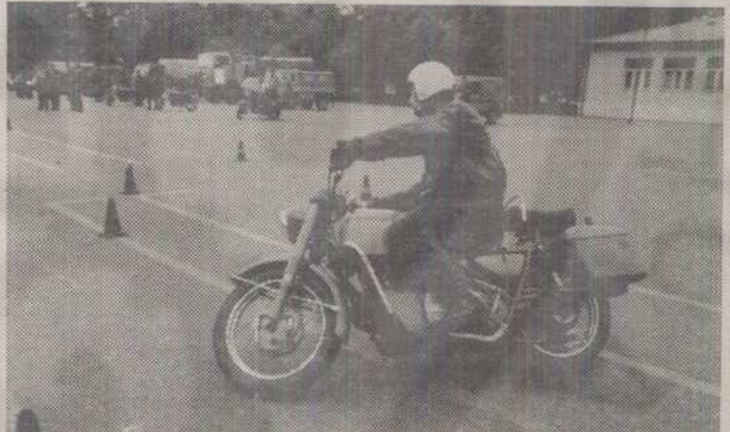
САОБРАЋАЛЦИ И ПОЛИЦИЈАЦИ СЕ ОВАКО ОБУЧАВАЈУ ЗА СЛОЖЕНЕ И ВАЖНЕ ЗАДАТКЕ У ВОЂЕЊУ КОНВОЈА И ТРАНСПОРТА