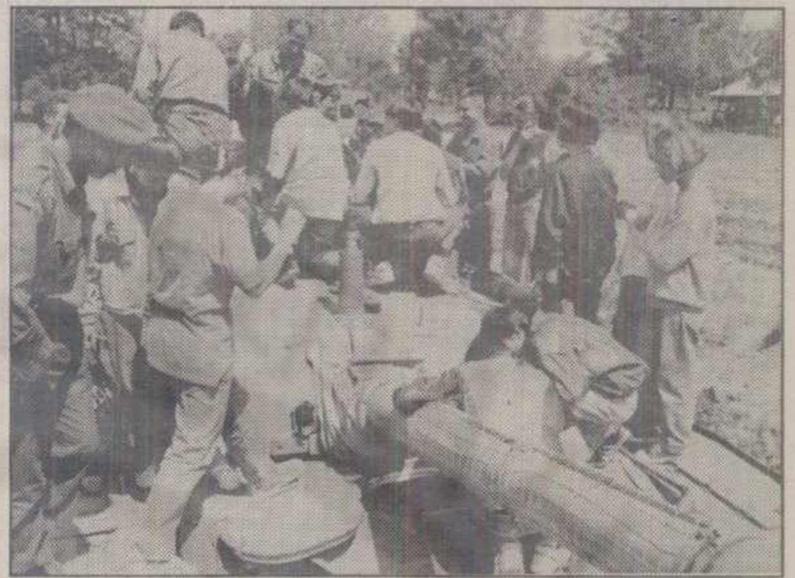
СА ТЕХНИЧКОГ ЗБОРА У ЈАРЧУЈАКУ: УЧЕНИКЕ СУ НАЈВИШЕ ИНТЕРЕСОВАЛЕ БОРБЕНЕ СПОСОБНОСТИ ОВОГ МОЊНОГ ТЕНКА

• Данас у свим касарнама краљевачког гарнизона свечана смотра јединица уз пригодан културно-уметнички програм • Нови Дан Војске Југославије и протеклих дана обележен бројним манифестацијама (техничким зборовима, позоришним представама и спортским сусретима) • Команданта Гарнизона јуче примио начелник Рашког округа