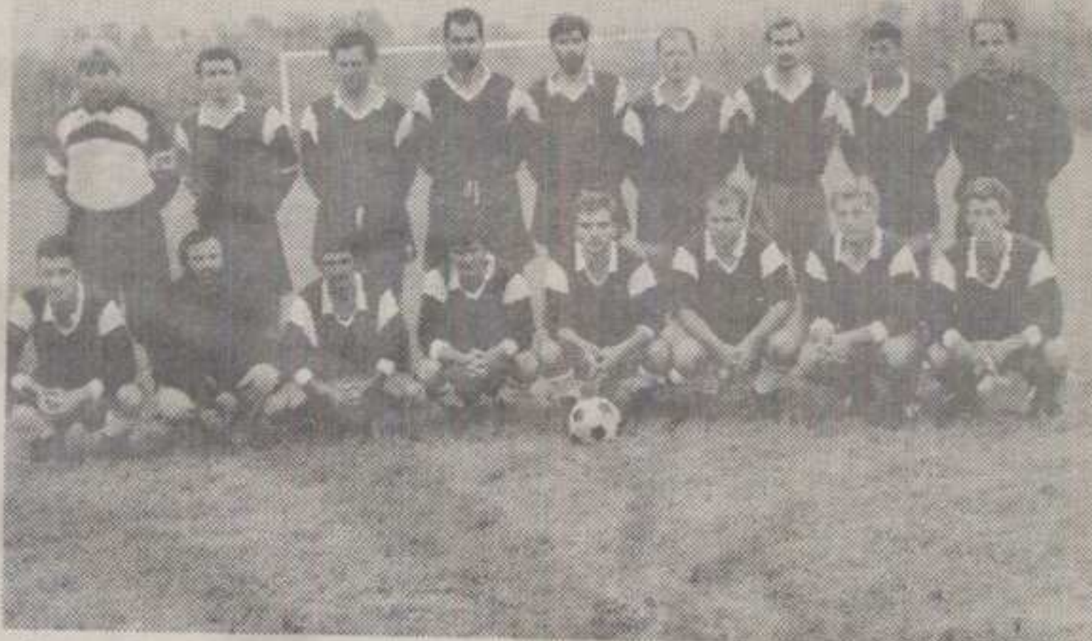
ЕКИПА ФУДБАЛЕРА - ВЕТЕРАНА ИЗ АДРАНА