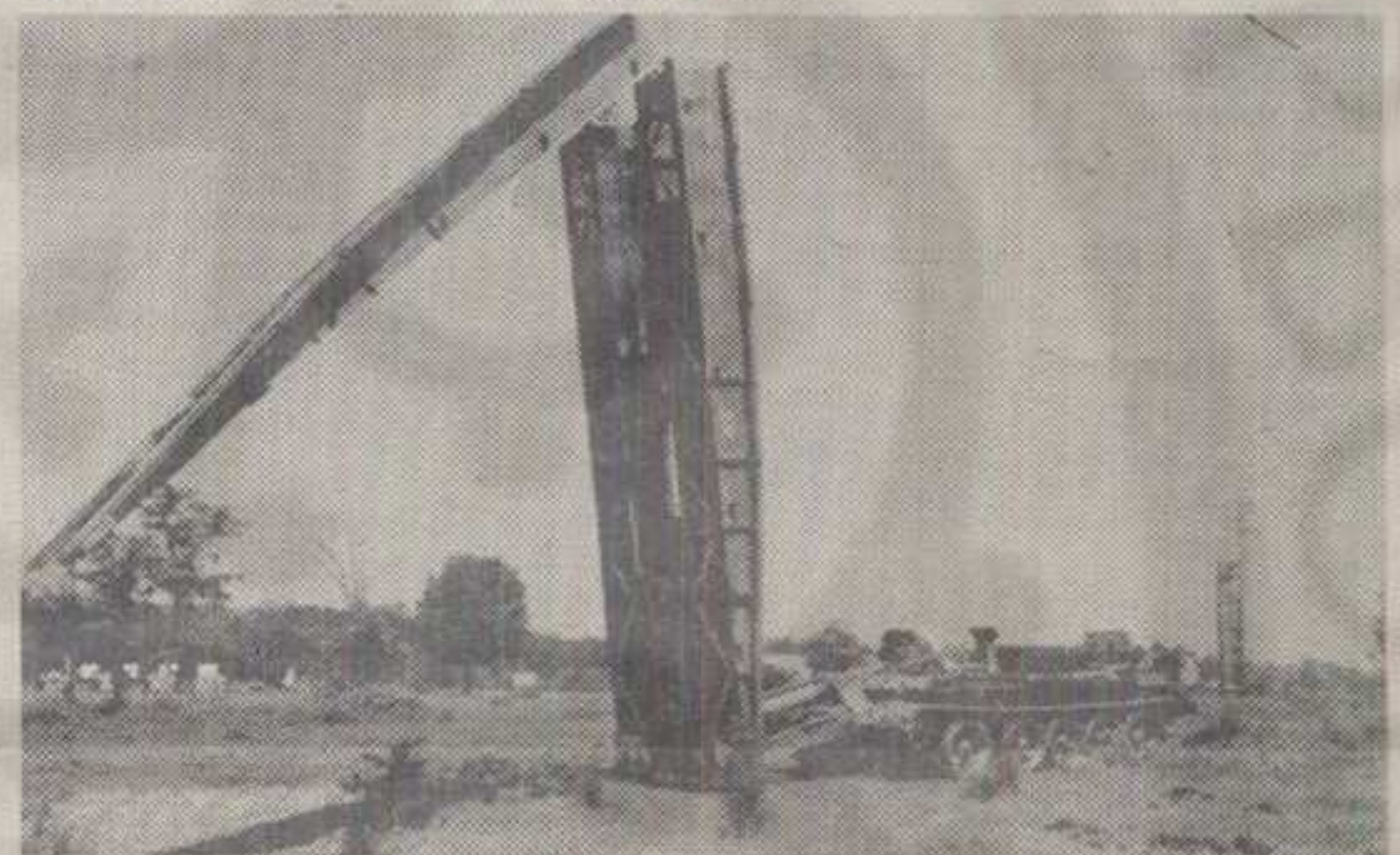
ЗА ИНЖЕЊЕРЦЕ ГОТОВО ДА НЕМА НЕПРЕМОСТИВИХ ПРЕПРЕКА КАО ШТО СУ РЕКЕ, МОЧВАРЕ И РИТОВИ. БЕЗ ЊИХ ТЕНКОВИ БИ ИМАЛИ ЗНАТНО МАЊИ БОРБЕНИ УЧИНАК