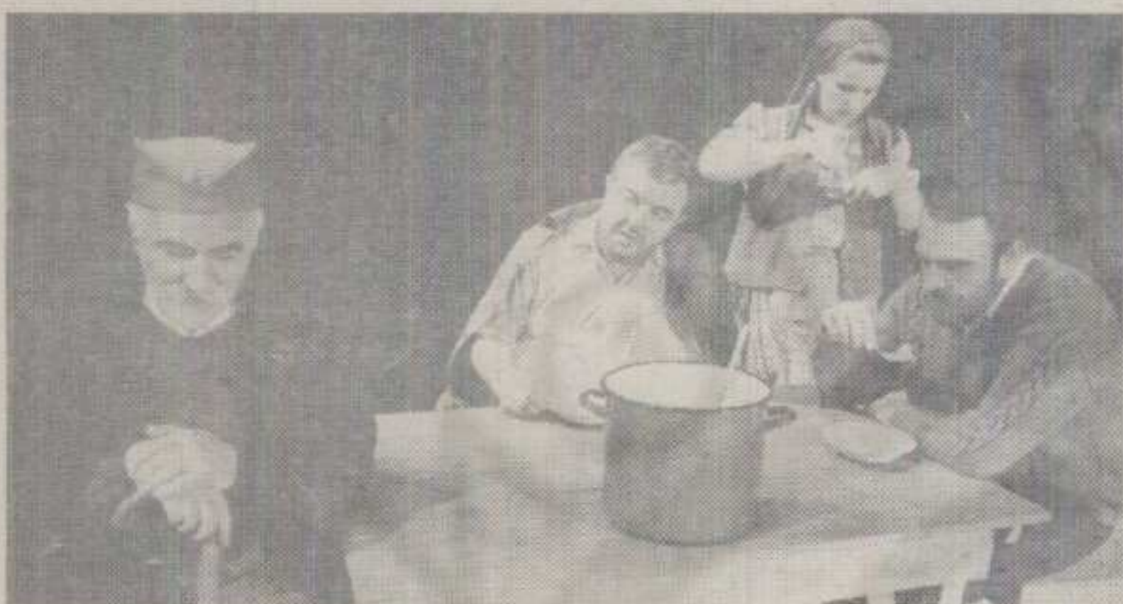
СА АПРИЛСКЕ ПРЕМИЈЕРЕ «КАМЕНА»

Накренута површ дома Вучетића, са руинираним светим дрветом у позадини, већ отпрва ликовно легитимизује дотични драмски амбијент (сценографију је урадио искусни Велимир Србља-