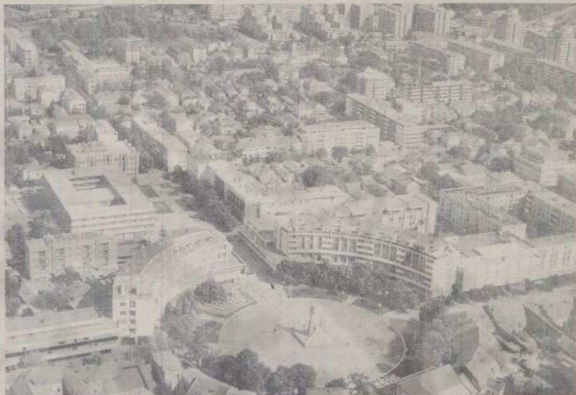
КРАЉЕВО ИЗ ПТИЧЈЕ ПЕРСПЕКТИВЕ ПОСЛЕ 112 ГОДИНА ПОД САДАШЊИМ ИМЕНОМ

Деветнаести април обележен свечаном седницом Завичајног друштва «Краљево», изложбом ликовних остварења краљевачких уметника и хуманитарним концертном «Краљевчани граду на дар»