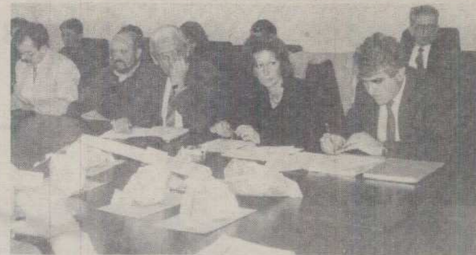
КОМПЛЕТНА ЕКСПЛОАТАЦИЈА И ПРЕРАДА У БАЉЕВЦУ НА ИБРУ: УЧЕСНИЦИ ОКРУГЛОГ СТОЛА О РУДИ БОРА

Циљ њиховог боравка у Српској Крајини је пружање стручне помоћи при формирању Социјалне установе у овом граду. Р. Бирица