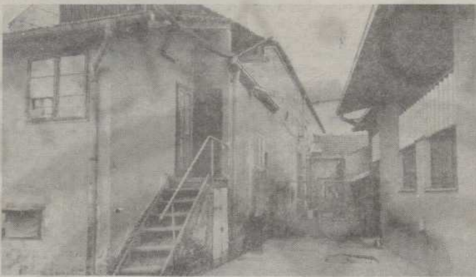
САДАШЊИ »ЕНТЕРИЈЕР« БУДУЋЕГ ПОСЛОВНО-КУЛТУРНОГ ЦЕНТРА