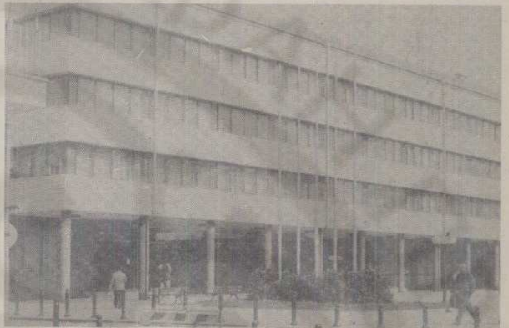
БУЏЕТ «ПРЕМА ГУБЕРУ» – ЗГРАДА СО КРАЉЕВО

У потрошњи средстава буџета зараде запослених износи 1,4 милиона динара, пола милиона је предвиђено за материјалне трошкове, а Фонду за грађевинско земљиште највише – чак 3,5 милиона динара. Такође, нај-