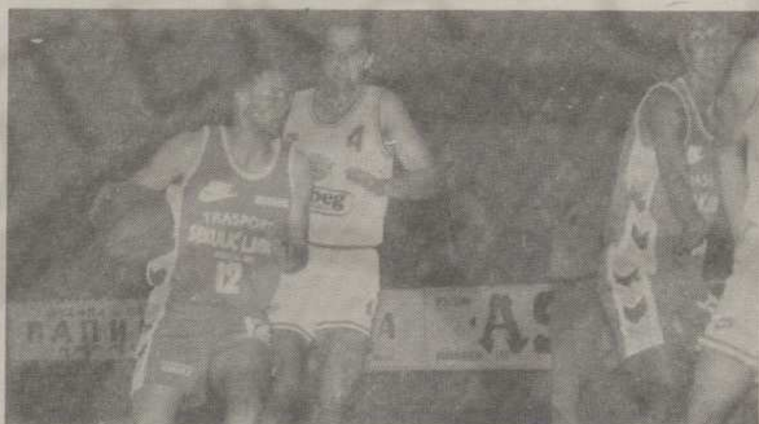
ВУКОСАВЉЕВИЋ ЈЕ У БЕОГРАДУ БИО НА ВИСИНИ ЗАДАТКА

од 109:100, и поред тога што је Будућност на старту стекла обешавајућу предност од 9:0.