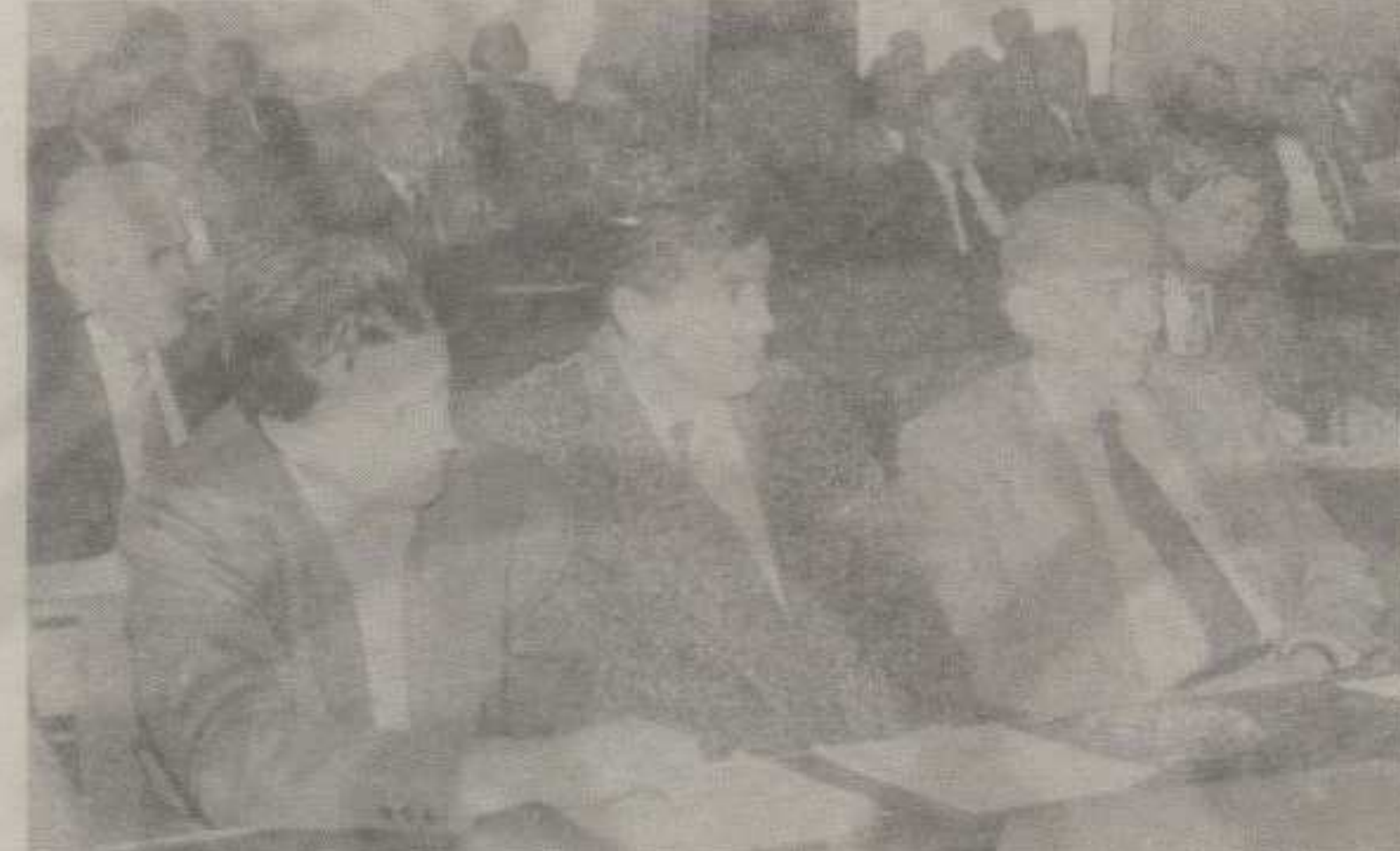
ПОДРШКА ПРОГРАМУ: СА САСТАНКА У КОМОРИ

тржишту. Приоритет у кредитирању дао би се индустрији и пољопривреди уз обавезно робно или девизино покриће кредита. Предложено је, такође, да се део емисионе добити Народне банке Југославије усмери на формирање