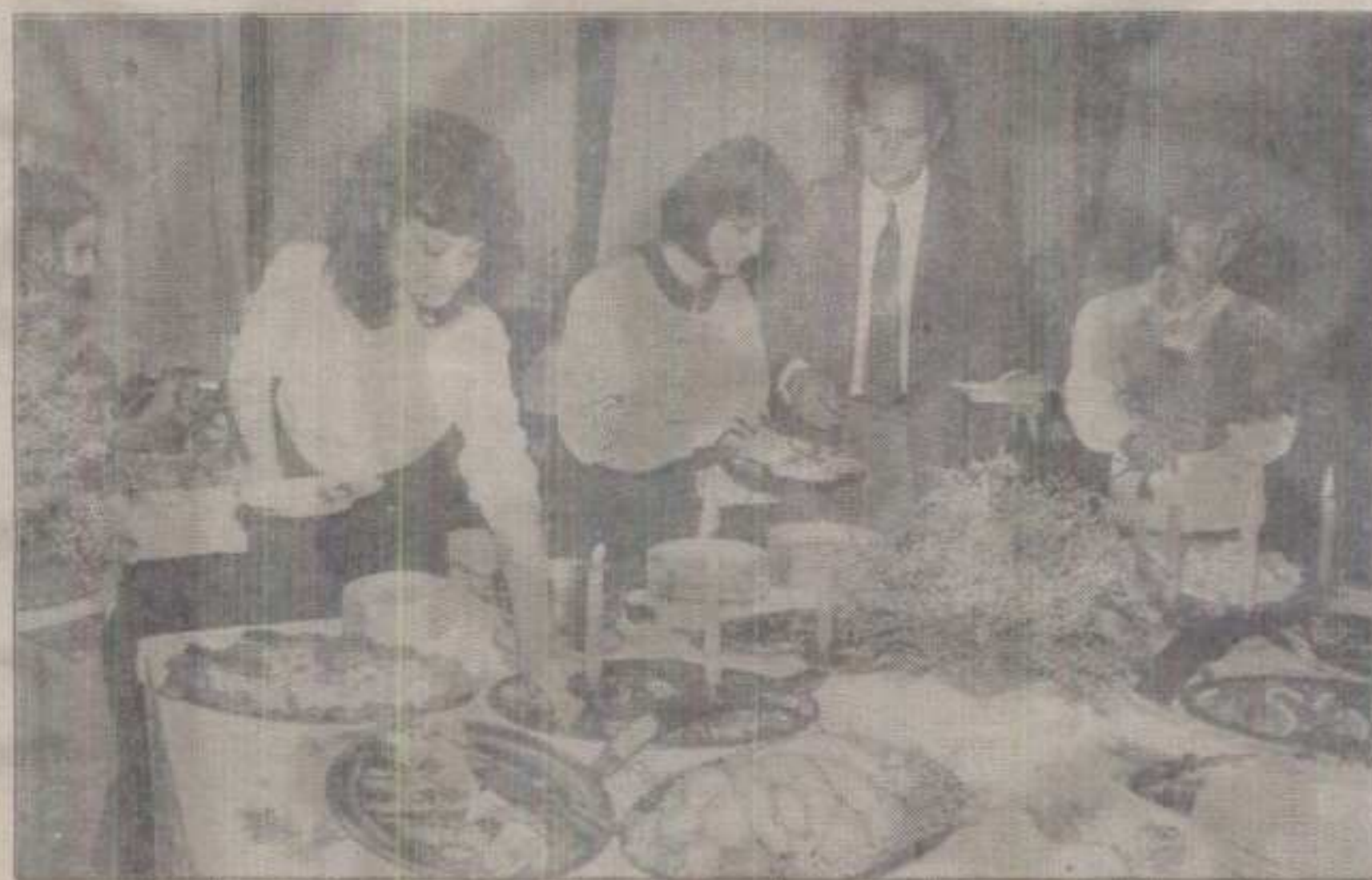
ВЕЧЕ МИМОЗА У «ЖЕНЕВИ» УЗ ПРИМОРСКО ЦВЕЋЕ, ЈУЖНО ВОЋЕ, РАДОСТ ДОЛАЗЕЊЕМ ПРОЛЕЋА, НА -11 СТЕПЕНИ И УЗ ВЕЈАВИЦУ