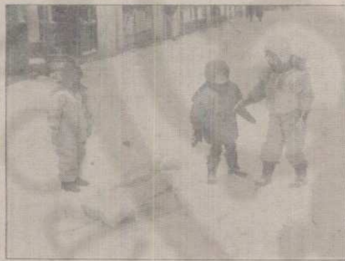
ПРВОМ ОВОГОДИШЊЕМ СНЕГУ И ЗИМИ КОЈА СЕ НЕ ПРЕДАЈЕ ЈОШ САМО СЕ ДЕЦА РАДУЈУ