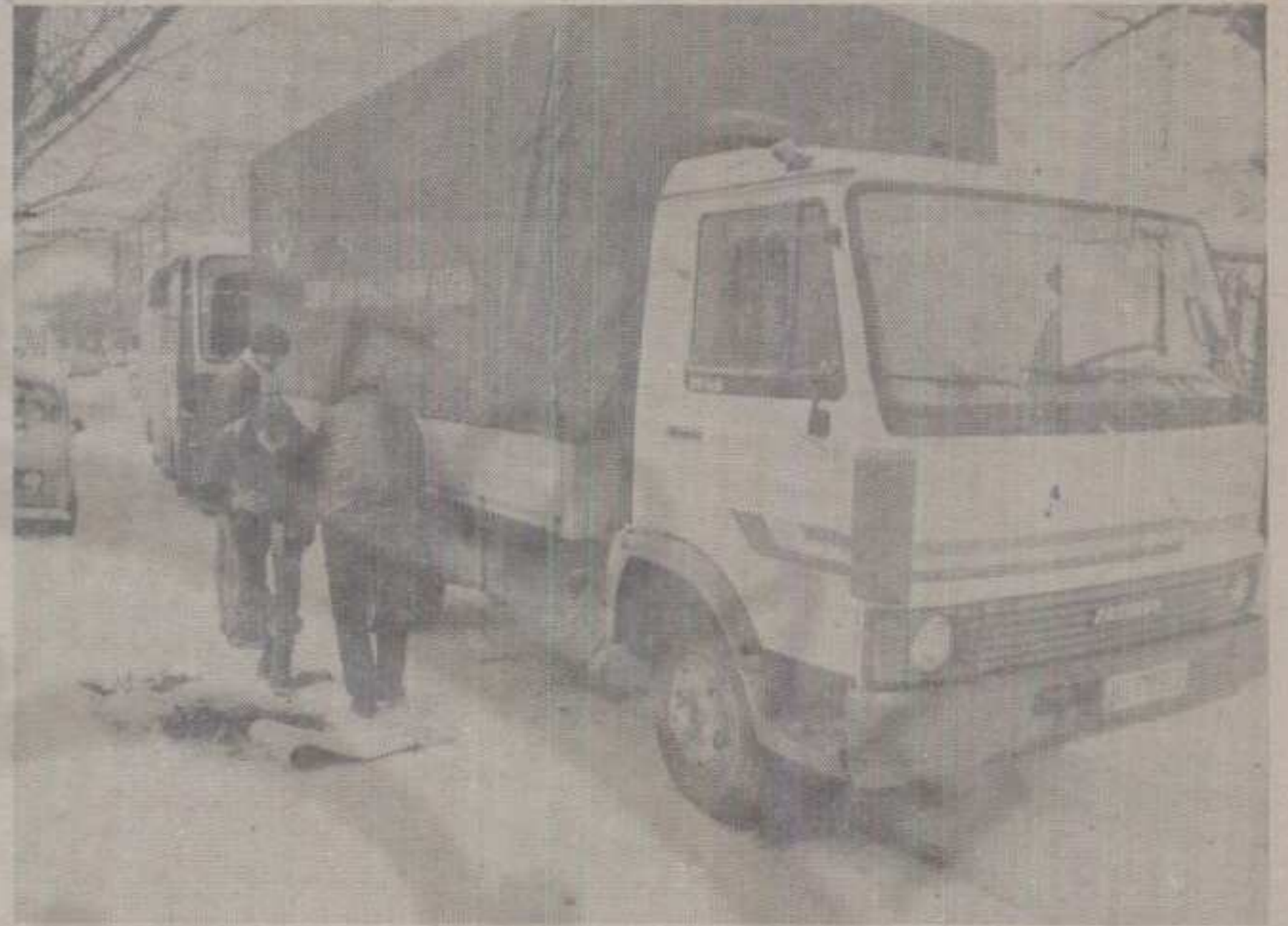
ОТКРАВИ ПА КРЕНИ – И ВОЗАЧИ КАМИОНА МОРАЛИ СУ ДА ЛОЖЕЊЕМ ВАТРЕ РАЗЛЕБУУ ГОРИВО У ИНСТАЛАЦИЈАМА

Неколико правих пролећних дана са релативно високим температурама за фебруар изненадило је све, па је снег са наметима и јаком кошавом која је дувала и брже од 50 километара на час, донео уобичајене децембарске и јануарске сезонске проблеме. Снегу који се задржао и данас, обрадовала су се још једино деца, мада би њима радост била и већа да је снег пао барем две седмице раније док је трајао најдужи зимски распуст од Другог рата.