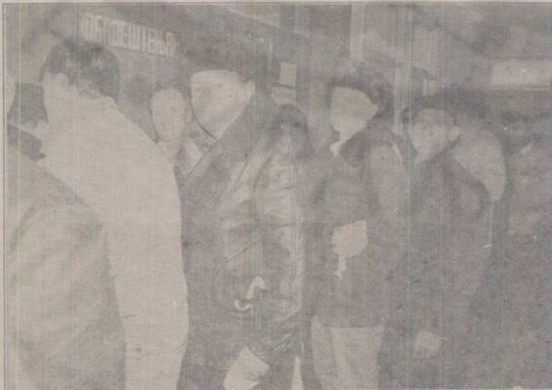
СВЕ ЈЕ У РЕДУ, ПРЕД ШАЛТЕРИМА ЗА ПЛАЋАЊЕ ПОРЕЗА, ИЗМИРЕЊЕ КОМУНАЛНИХ, «МИНУСНИХ ИЗВЕШТАЈА»...

Текст: Д. Обрадовић и Д. Вукићевић