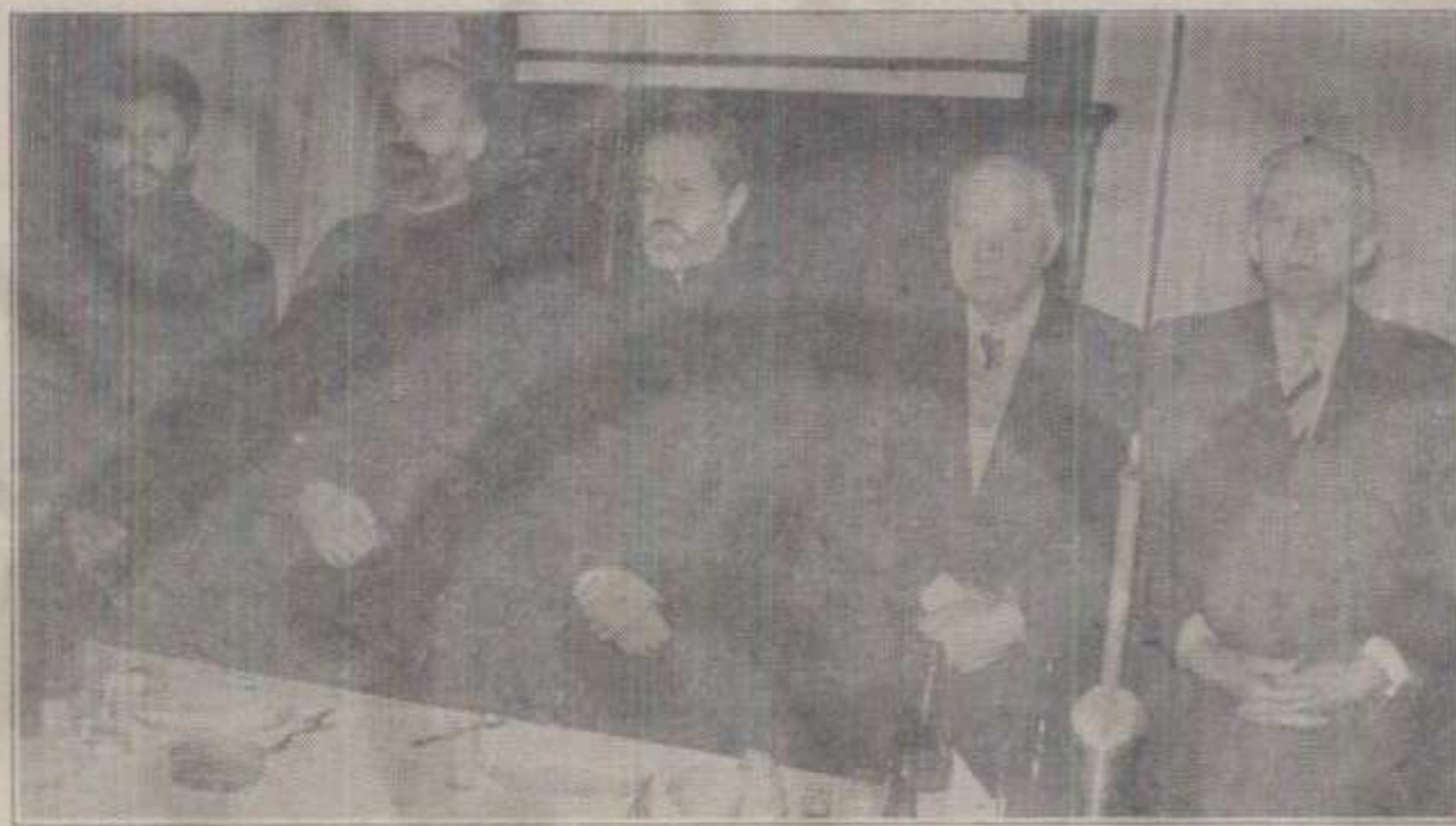
СЛАВСКОЈ ВЕЧЕРИ ЗАНАТЛИЈА У ХОТЕЛУ «ПАЗИЗ» ПРИСУСТВОВАЛИ СУ И СВЕШТЕНИЦИ ЕПАРХИЈЕ ЖИЧКЕ

занатлија из Матарушке Бање. Уз морске рибе специјалитете, јужно воће и у амбијенту познатог швеца са Црногорског приморја, прошле суботе у ресторану «Женева» продужили су традиционално до зоре «Вече мимоза». Док су жуте мимозе, којих је у «Женеви» било на сваком столу, симболично наговештавале скори долазак пролећа, те ноћи провејавао је снег са температуром од минус 11 степени и правим зимским амбијентом.