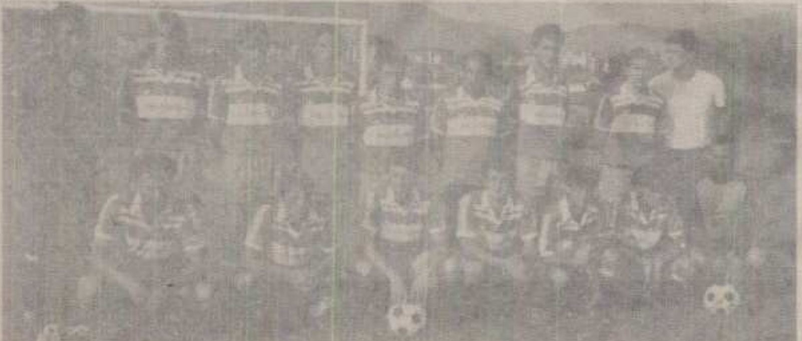
ТИМ »КАБЛАРА« БИЋЕ ЗНАТНО ИЗМЕНЈЕН У НАСТАВКУ ПРВЕНСТВА

● Са новом Управом клуба дошло и десетак познатих и искусних играча.