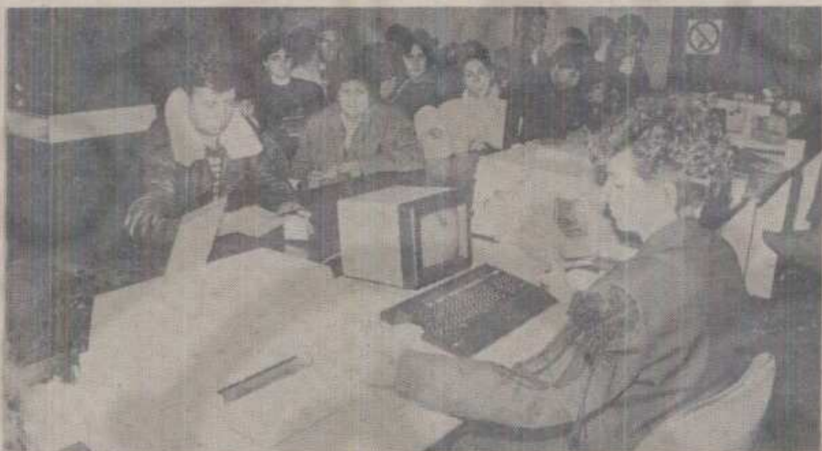
ШЕСТОМЕСЕЧНА ПЛАТА ЗА »МИНУС« — РЕДОВИ ПРЕД БЛАГАЈНАМА БАНАКА И ПОШТА ПОСЛЕ МЕСЕЧНОГ ИЗВЕШТАЈА

ји банкама за релативно мали износ од почетка ове године, сада банкарима дугују и по неколико стотина динара.