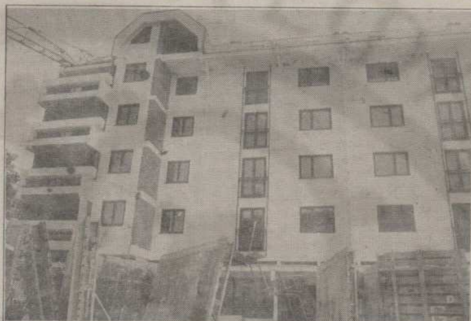
КАКО ИСПРАВИТИ НЕПРАВДУ У ОТКУПУ СТАНОВА?

Галопирајућа инфлација крајем прошле године тотално је обезвредила и закупнину, односно део станарине (закупнине) које су власници откупљених станова плаћали за текуће и инвестиционо одржавање (ТИО). Ти износи су толико били