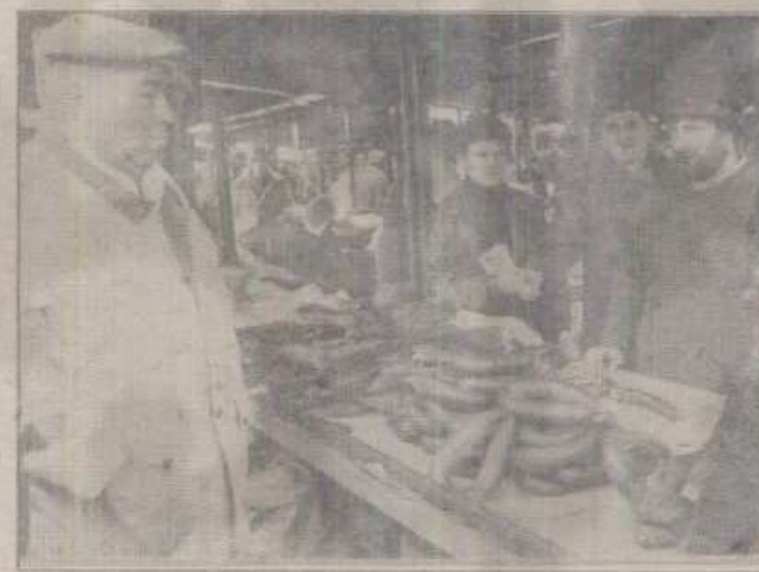
СУХОМЕСНАТИ ПРОИЗВОДИ, УЗ РАЗУМЉИВО НИЖЕ ЦЕНЕ БЕЗ «АКЦИЗА» И ПОРЕЗА НА КРАЉЕВАЧКОЈ ПИЈАЦИ, АЛИ И БЕЗ УВЕРЕЊА О ПОРЕКЛУ И САНИТАРНОЈ ИСПРАВНОСТИ. ЗДРАВЉЕ О СВОМ ТРОШКУ И УЗ РИЗИК