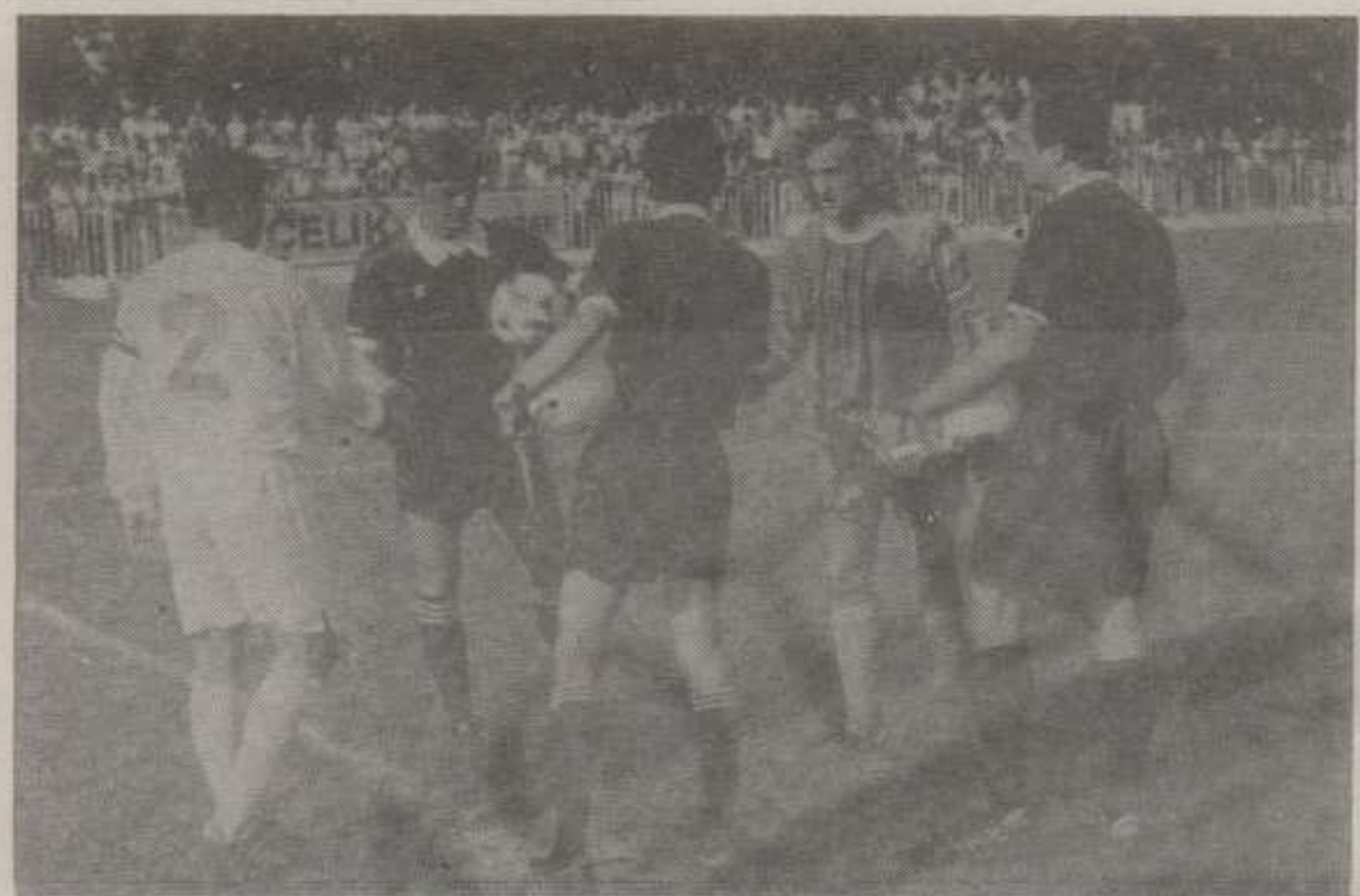
«ЗА УСПОМЕНУ И ДУГО СЕЋАЊЕ». ПРЕД ПОЧЕТАК МЕЧА ОДЛУКЕ У БАЧКОМ ЈАРКУ

ФУДБАЛЕРИ СЛОГЕ НИСУ УСПЕЛИ ДА САЧУВАЈУ ДРУГОЛИГАШКИ СТАТУС