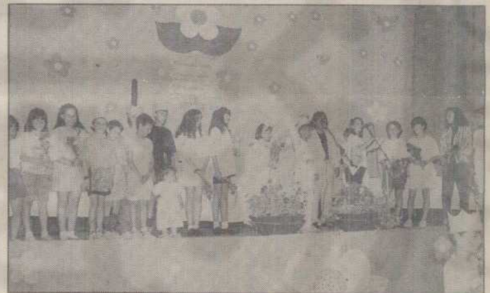
ПОДМЛАДАК ЕКОЛОШКОГ ПОКРЕТА НА ТАКМИЧЕЊУ