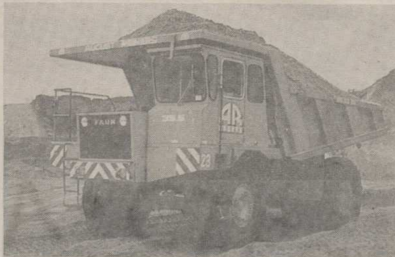
ДАМПЕР ФАБРИКЕ ВАГОНА »НА РАДНОМ ЗАДАТКУ«

меном стицана сада се полако али си- гурно претачу у конкретан посао. Исти- тина, доскорашни партиери, уста- лом као и многи други из Европе и савета, окренули су леђа али за преду- зимљиве никада нисма зиме. Тако су пре неколико дана људи из руководи- тег састава Фабрике потписали пред- уговор са Рудником угља из Пљева-