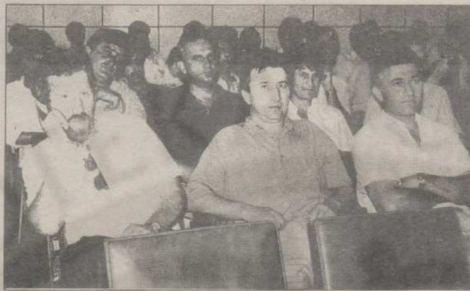
УЧЕСНИЦИ ГОДИШЊЕ ИЗБОРНЕ СКУПШТИНЕ ОПШТИНСКОГ ОДБОРА СПО У КРАЉЕВУ

• СПО ће конструктивно искористити незадовољство грађана и спречити да дође до хаоса • Наставити са политиком која води демократизацији Србије • Изабран нов Општински одбор од девет чланова.