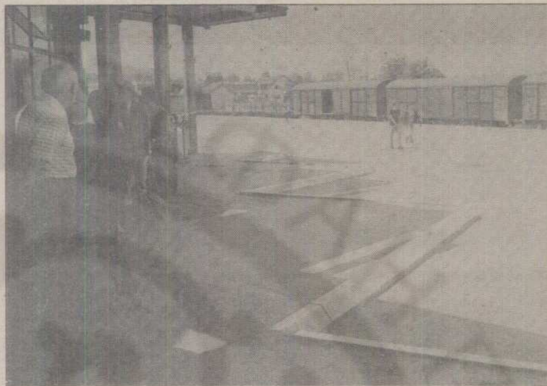
ПЕРОНИ АУТОБУСКЕ СТАНИЦЕ У КРАЉЕВУ СВЕ ЧЕШЋЕ БЕЗ АУТОБУСА

• Краљевачки »Ауто-транспорт« због несташице горива редуковао аутобуски превоз на испод 40 одсто од (редовног) реда вожње пре нафтног ембарга • Само три поласка »Ауто-транспортних« аутобуса за Београд и два за Нови Пазар у међуградском саобраћају • Посебно тешка ситуација прошлог викенда • Потпуна неизвесност у снабдевању аутопревозника горивом • Од јуче цене јавног превоза повећане за чак 198 одсто.