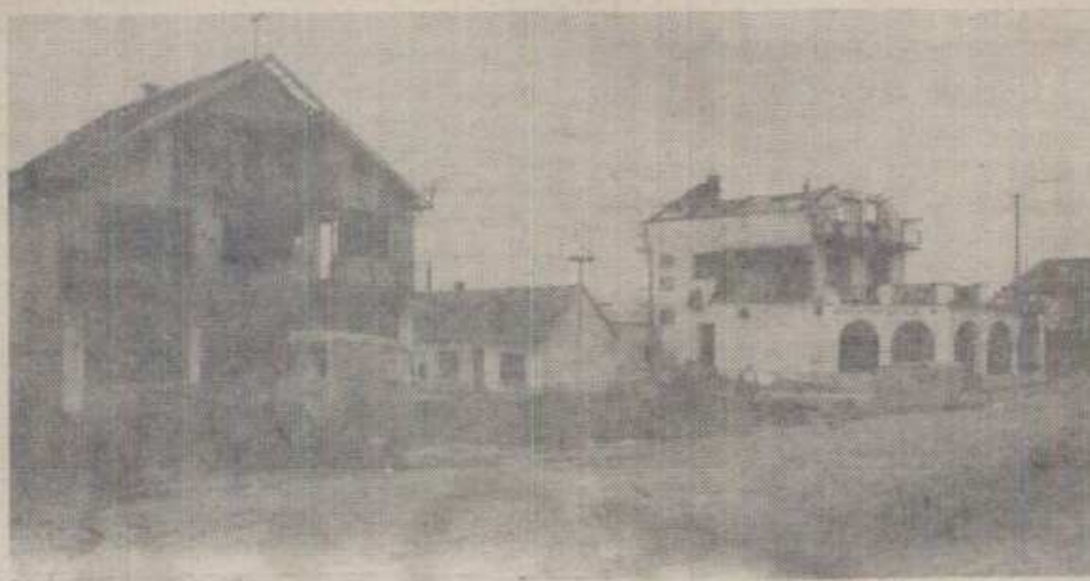
ПРИЗОР ИЗ ИСТОЧНЕ СЛАВОНИЈЕ: СПОМЕНИК И ОПОМЕНА ЗА БУДЕЋЕ ГЕНЕРАЦИЈЕ

Сада им је најближи град Вуковар, на 50 км од њих. Граница је ту близу. Граница Хрватске. А Шодоловци су на километар од те границе. Оружје је у свакој кући. Не верује се УНПРОФОРУ, ни њиховој моћи ни жељи да их заштити од могућег напада. А Србија је тако близу и тако далеко. Све су очи упрте у њу.