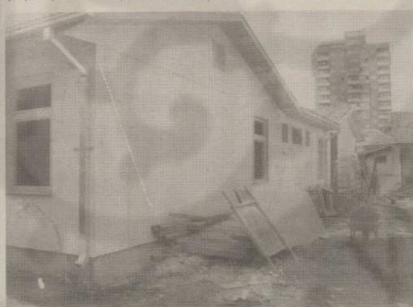
Монтажно породилиште у Краљевицу — Лепши почетак живота за неке нове бебе

Особље породилишта Медицинског центра у Краљевицу и корисници њихових услуга, речено административним језиком, ускоро ће добити боље услове за рад и негу од оних које још увек постојеће може да