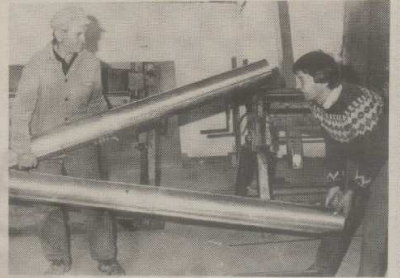
Радници „Ибра“ се више не смеше

● РАДНИЦИ „ИБРА“ ПРИХВАТИЛИ СУ ИНИЦИЈАТИВУ ДА СЕ ПОКРЕНЕ ПОСТУПАК ЗА УДРУЖИВАЊЕ СА ФАБРИКОМ ВАГОНА, АЛИ ПРЕ СВЕГА ТРАЖЕ ОДГОВОРНОСТ ОНИХ КОЈИ СУ „ИБАР“ ДОВЕЛИ ДО ПРОСЈАЧКОГ ШТАПА