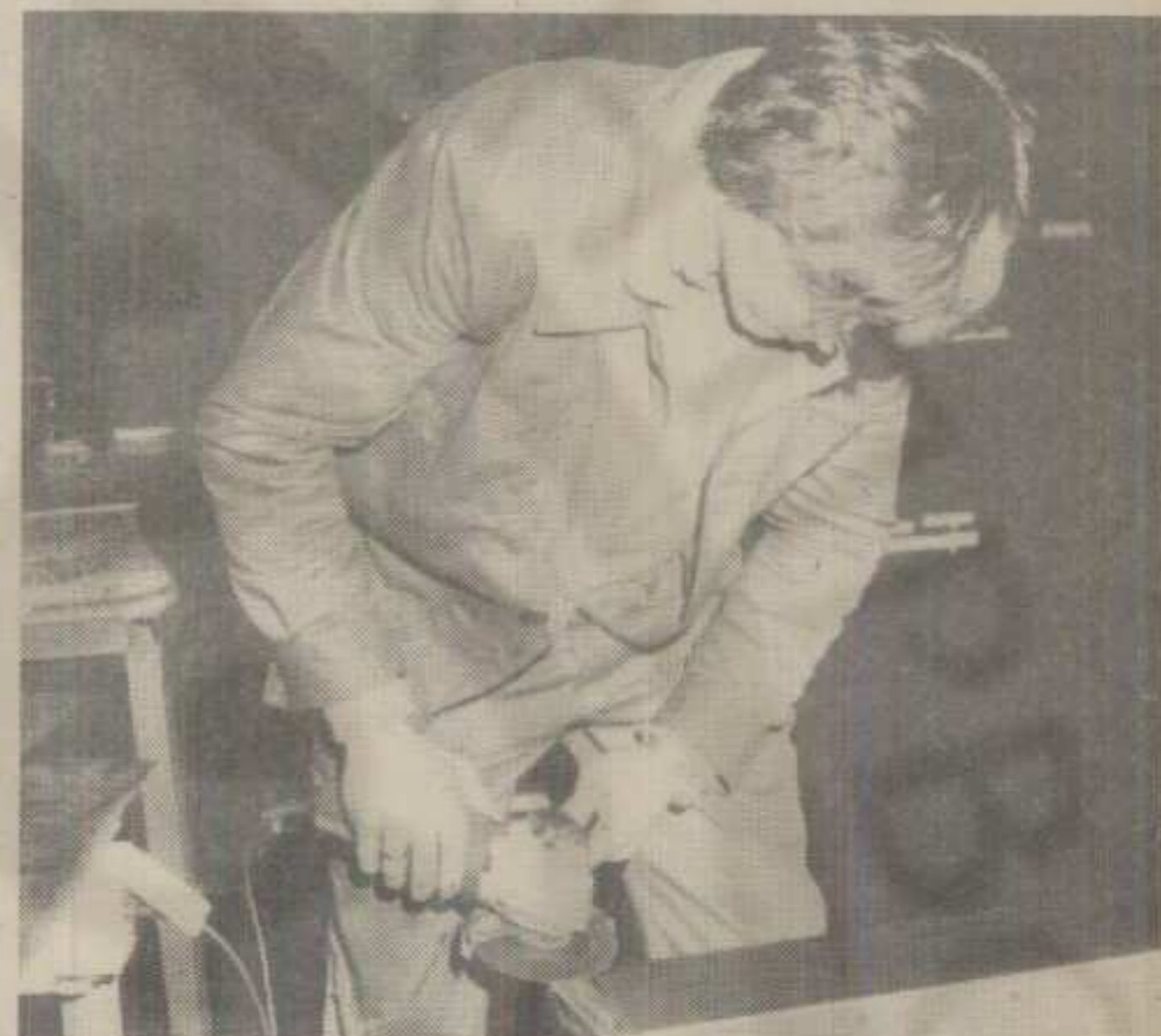
Све већи раст индустријске производње