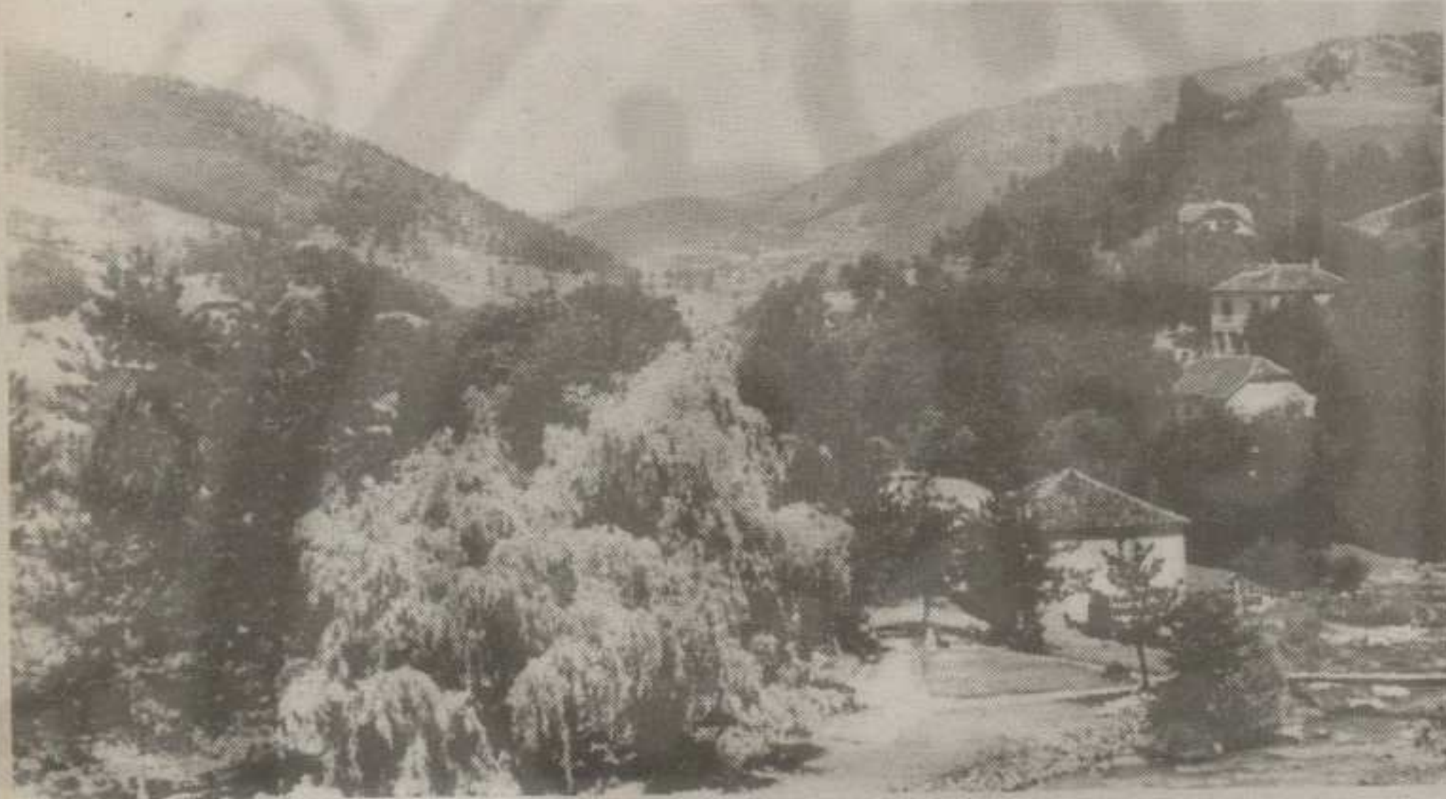
Јошаничка Бања — зелена врата Копаоника

Поред киоска за продају шампе, ширења и другог ситниша у самом центру бање по-