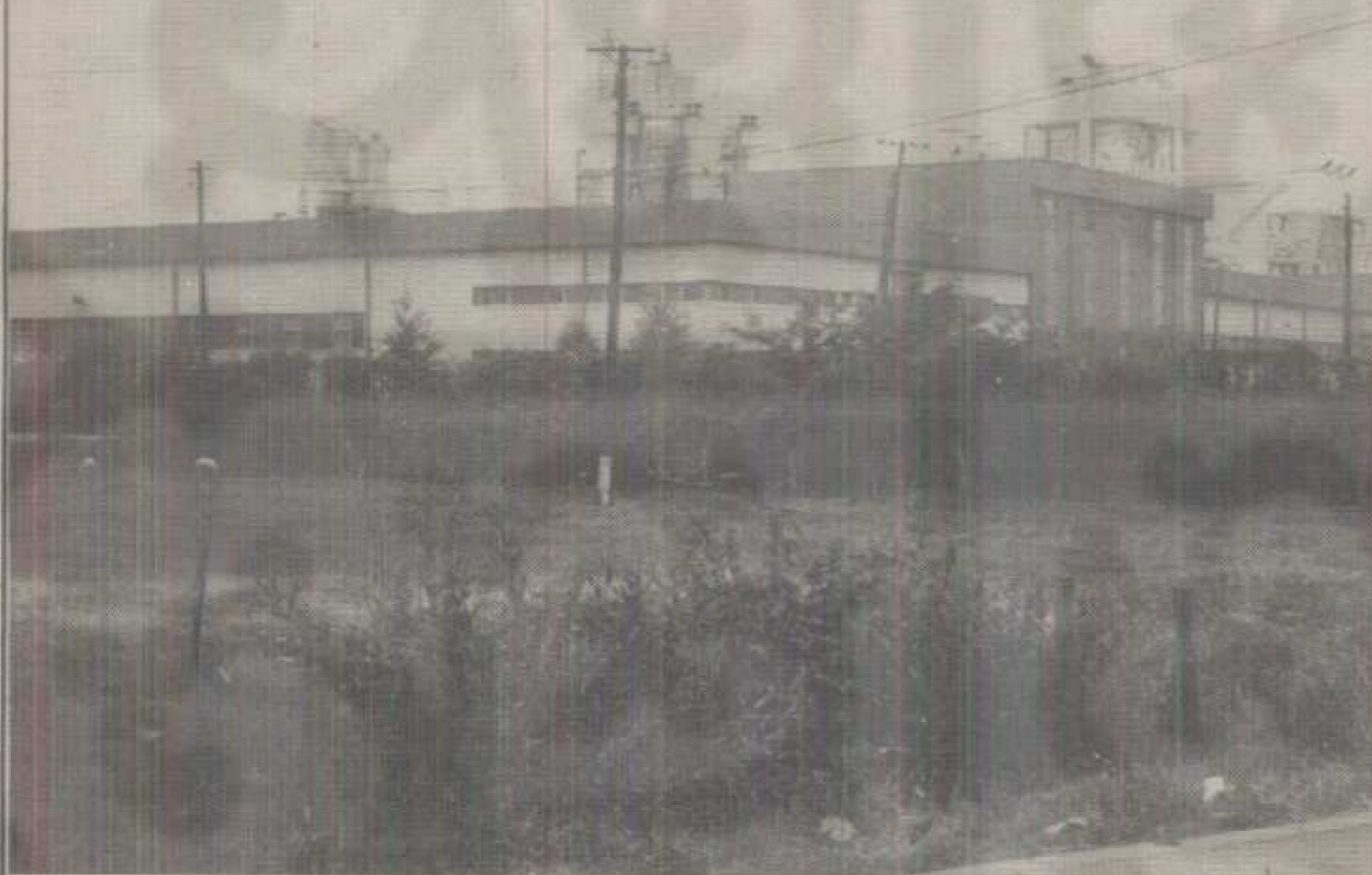
Фабрика у Конареvu чека нови потез

Сигурно је једно, да је медиалан плоча потребна нашој земљи, да већ једна таква фабрика у нас успешно ради (имала је у почет-