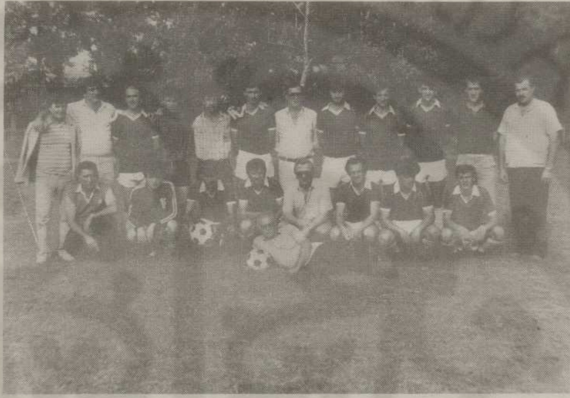
Фудбалери ОФК Трговачког са члановима управе после освајања првог места у Регионалној лиги Краљево

Од свог формирања до данас управа ОФК Трговачког желела је добре односе са домаћом Слогом. Било је својевремено и трзавица, али последњих година ови односи су све бољи. Сада, када су оба клуба у истом рангу такмичења, односи су изванредни са пуно разумевања и спортске сарадње. Тако ће ОФК Трговачки због реновирања свог игралишта „14. Октобар“, прве две утакмице у улози домаћина одиграти на Градском стадиону „Слоге“.