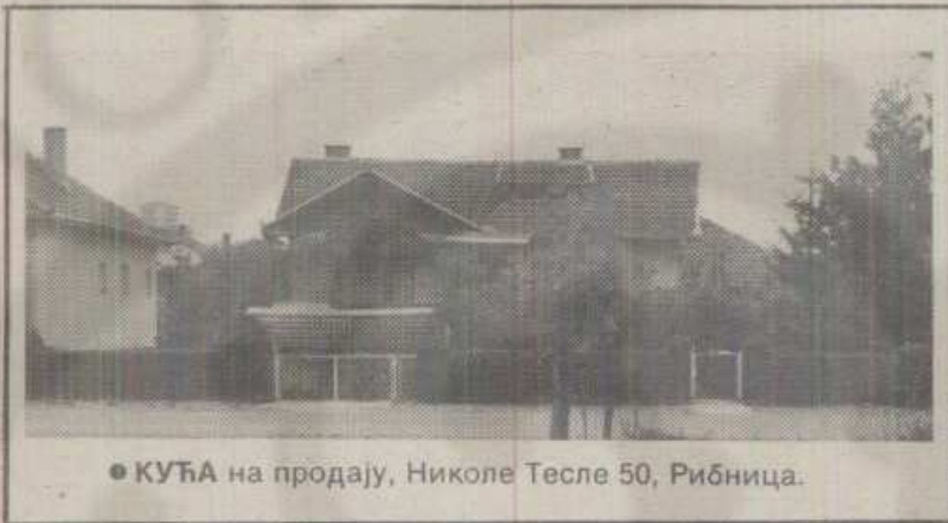
● КУЋА на продају, Николе Тесле 50, Рибница.