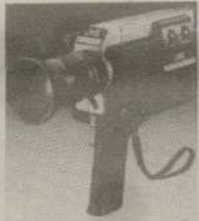
ФОТО СТУДИО „САРИЋ“ 36000 КРАЉЕВО ул. Октобарских жртава 35 тел: 036/335-134 и 24-237

● КВАЛИТЕТНО ● БРЗО ● ЈЕФТИНО ● КВАЛИТЕТНО