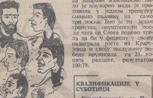
Компјаркиши Слого у карикатури

Слога је победила Морава са резултатом 85:72. У другом полуфиналу Слога је победила Морава са резултатом 95:72. У финалу Слога је победила Морава са резултатом 95:72.