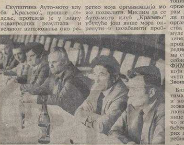
Са Скупштине аутомото клуба