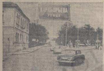
На почетку Карађорђевог улице