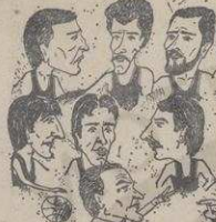
Компјаркиши Слого у карикатури

Краљево. Кошаркаши Слога из Београда и Крајевца првенства Србије у овоме првом месту и по крајњим резултатima победили су своје противнике и освојили прво место у последњој утакmici против радника из Крајевца. Слога је у последњој утакmici победила са резултатом 100:77. У првом полуфиналу Слога је победила Морава са резултатом 85:72. У другом полуфиналу Слога је победила Морава са резултатом 95:72. У финалу Слога је победила Морава са резултатом 95:72.