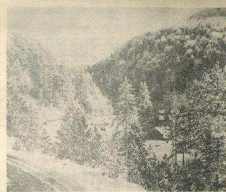
Омладинци на Гочу