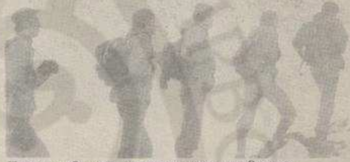
Чланови «Озрена» за време похода на Столове

То могу само најодрживији планинари, као што су чланови Огранка „Озрен“ из насеља Змајевац. Њима није ништа необично да се одлуче и на најнапорије у планинарењу. Прећи преко планине ноћу, макар по каквом времену било, не биравују чак ни доба године.