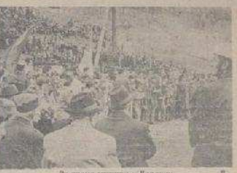
За време седнице у Беолици