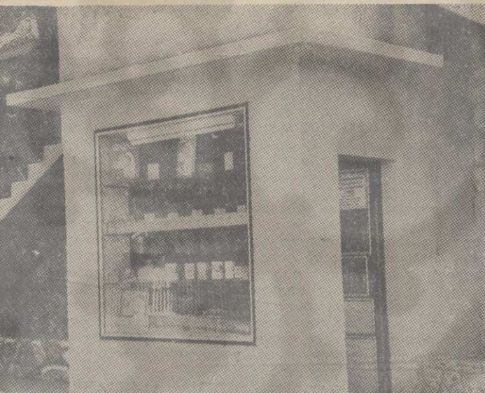
Биљна аптека у Ушћу

▲ АПОТЕКА СЕ СНАБДЕВА ЧАЈЕВИМА, ЧАЈНИМ МЕШАВИНАМА И БИЉНИМ ПРЕПАРАТИМА ИЗ СОПСТВЕНОГ ПОГОНА НА УШЋУ, ОД ИНСТИТУТА ЗА ПРОУЧАВАЊЕ ЛЕКОВИТОГ БИЉА ИЗ БЕОГРАДА И „ДАЛМАЦИЈА-БИЉА“ ИЗ ДУБРОВНИКА.