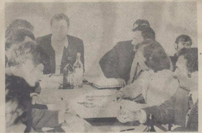
Са седнице Радничког савета

Ресторан друштвене исхране који ових дана пре