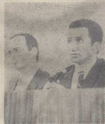
Што хитније мере за уклањање социјалне неједнакости

то кроз непостојање система за диференцирано опорезивање, кроз системски одређен неједнак положај појединих делатности у стицању дохотка, недостатак одређених при