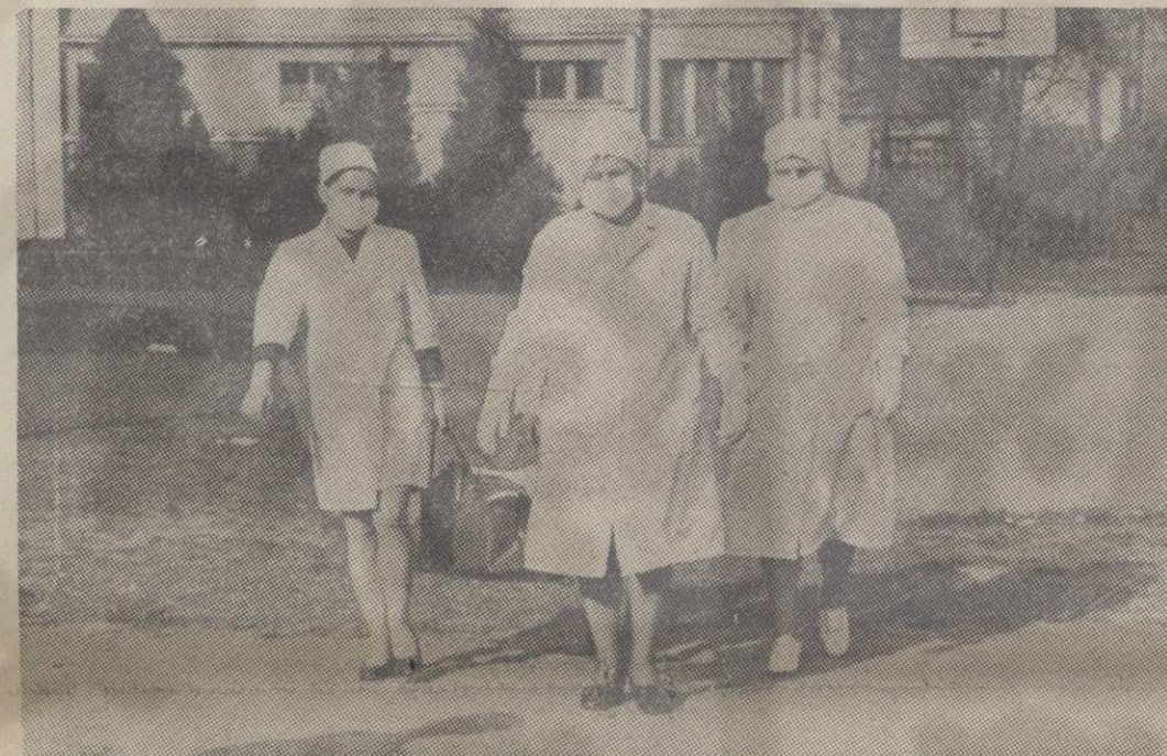
У време карантина у Шумарској школи

рантинских мера почеле су од управника интерната. Први сусрет са њим био је изненађујући: „Ми смо тражили екипу из Београда, а не вас“ — рекао је управник. Овај руководилац интерната дисквалификовао нас је још на првом кораку и изразио неповређе у наш предстојећи рад. Није било тешко закључити да од појединачног из интернатског колегијума не треба очекивати нарочиту помоћ у спровођењу одлука Општинског штаба за откривање евентуално заражених ученика. Штавише, бојали смо се ометања у раду дисциплине и његове индоленције у овом мобилном стању. Због тога сам корисно вао свој став и одлучио да будем истовремено и лекар и, ако буде требало, и диктатор. Јер, када су у питању животи скоро 230 младих људи тада се једино и искључиво примењује неограничена императивност и послушност без поговора. Због тога сам рекао управнику да ће убудуће слушати само моја наређења и да не заборави да је у карантину као и сви остали ученици. Међутим, није се могао одрећи својих прерогатива. Често је због тога долазило до онтрих и мучних сцена између нас. На пример, сукоб око изношења и продавања отпадака хране изван карантина, ометања телефонских разговора са Штабом, покушај да забрани штампу ученицима, дискриминација према ученицима који нису становили у интернату и др. Један од васпитача био је чак интолерантнији према мени него његов шеф: „Ми нисмо ваше жене да се на нас истресате“ — одбрусио ми је васпитач.