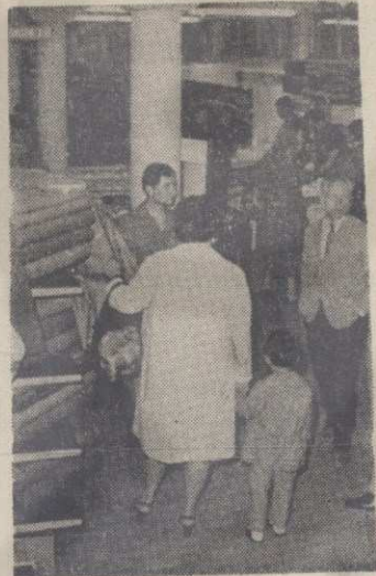
Са мамом у продавници

У позитивној породици, где влада клима међусобног поверења, љубави, где разумна мајка уме разумно да воли свако своје дете, ту су најповољнији услови да се младом човеку правилно развија и постане емотивно и социјално-хумано здрава личност у физичком, душевном и друштвеном смислу. Том циљу треба да тежи разборита и брижљива мајка, тј. да својом за дете незаменљивом нежношћу и љубављу допринесе и са своје стране да усрећи свако своје дете у интересу породице, детета и друштва. Уколико пак мајка не би умела да усклади своју љубав према своме детету, било да је још млада, без искуства, или из других разлога, она треба да се обрати стручњацима за помоћ и савет да би могла испунити своју материнску дужност према своме детету.