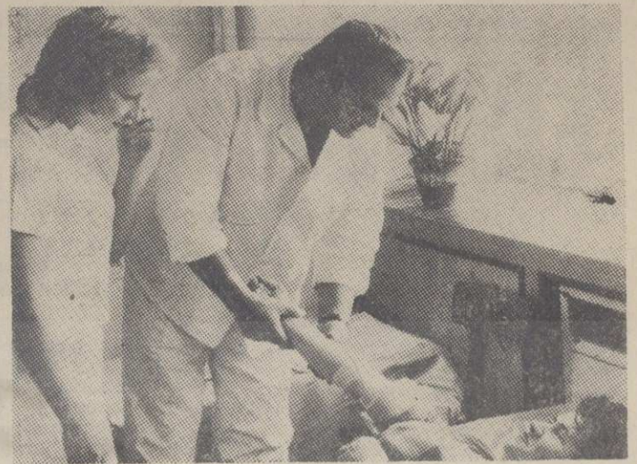
Лекари за време интервенције

— Правремена наша реакција од момента обавештења до проналажења ученика Шумарске школе у селу Моровићу, била је можда пресудна. Ми смо обавештени у пет часова 23. марта,