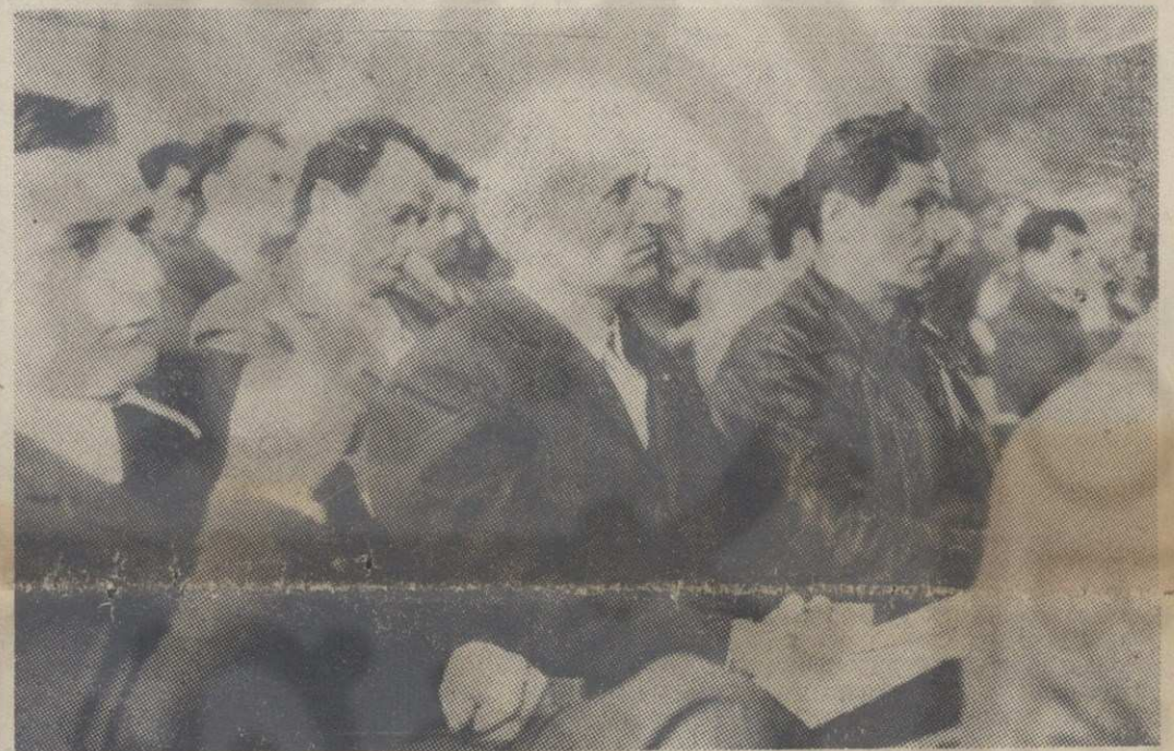
Учесници Скупштине за послове запошљавања

Скупштина је на овој седници разматрала и захтеве неких радних организација