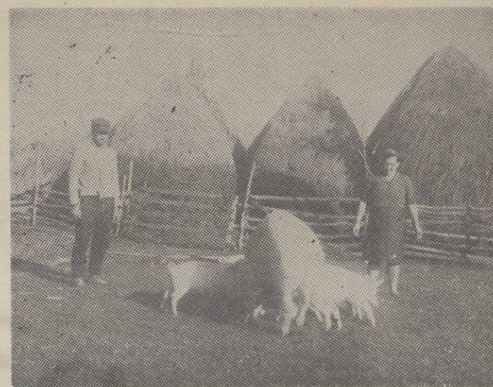
И сточарство је уносна грана пољопривреде

На недавној седници Радничког савета „Воћара“ усвојена је информација о пословању радне организације у прошлој години. Том приликом је истакнуто да је остварен укупан приход у вредности од 65.806.303 динара