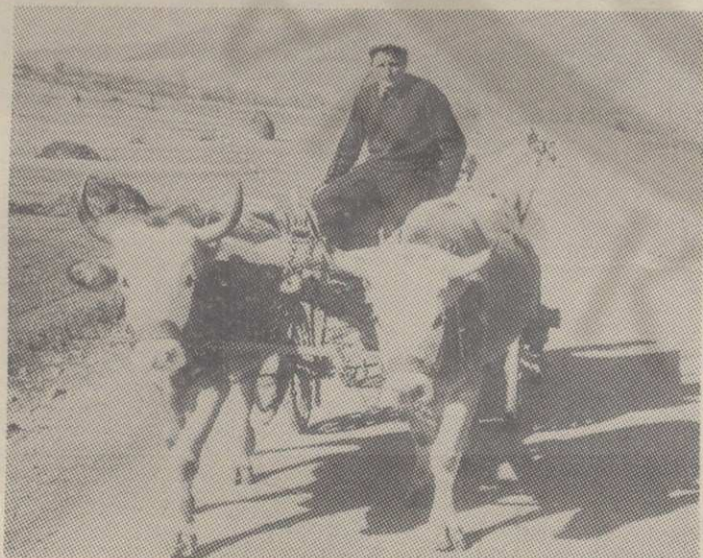
Некада се по воду ишло и овако

Међутим, касније долази до низа неспоразума око овог питања. Група људи из Драгосињаца је покушала да омете извођење радова на новом водоводу. Спор тако добија све веће димензије и долази до низа састанака друштвено — политичких организација ова два села. Да се проблем реши покушала је и Скупштина општине Кра-