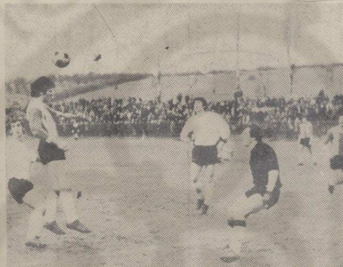
Са недавне утакмице Слога — Слобода. Водећи гол за Слогу