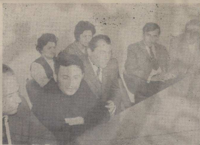
Састанак чланова Синдиката

У склопу амбуланте која има више просторија биће смештене и пословне канцеларије Погона текућег одржавања.