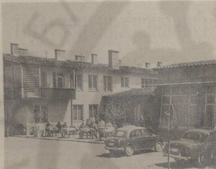
Мотел у Рашки

Према постављеним циљевима и задацима развоја општине до краја средњорочног плана, основни правци улагања у основне фондове треба да буду усмерени у реконструкцију и модернизацију производних капацитета у рударству и индустрији. Приоритет улагања имаће о-