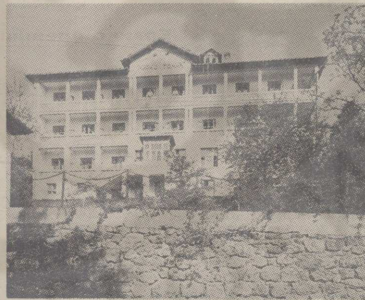
Стационар „Мирко Томић“ у Врњачкој Бањи

љиво када се зна да је поред комплетних медицинских услуга и успеха у лечењу, це на болесничког дана у прошлој години износила 85 динара.