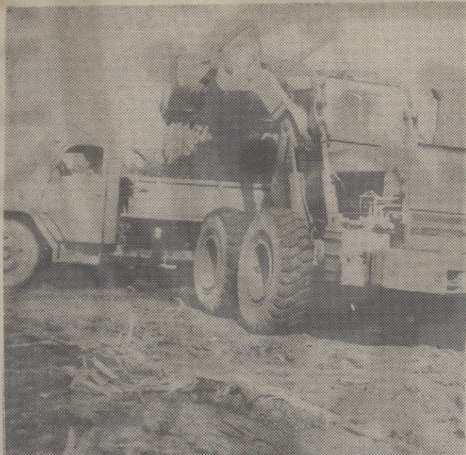
Механизација у пољопривреди

ласти економских друштвених односа у пољопривреди и селу.