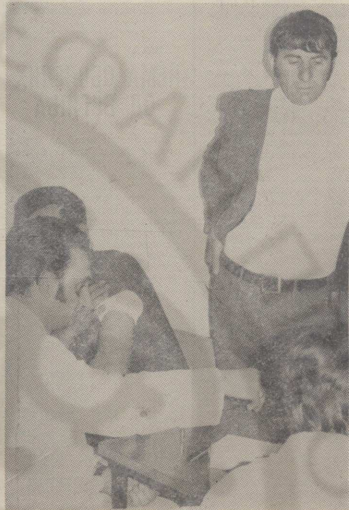
За време вакцинасиња