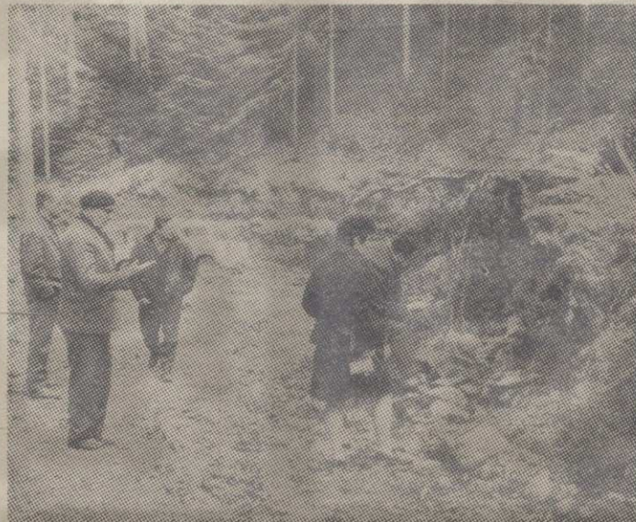
Место где се налазила средњовековна топионица на Гочу