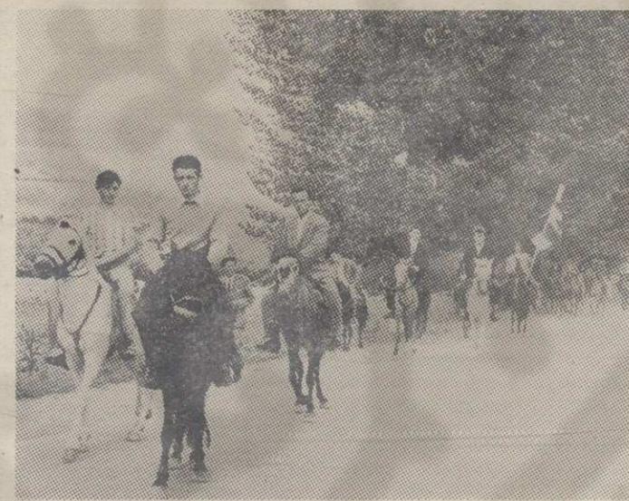
Свадбари на коњима

своју јабуку, стављајући истовремено и дар у новцу. Његови момци му пружају флашу заслаћене ракије и певају стихове: