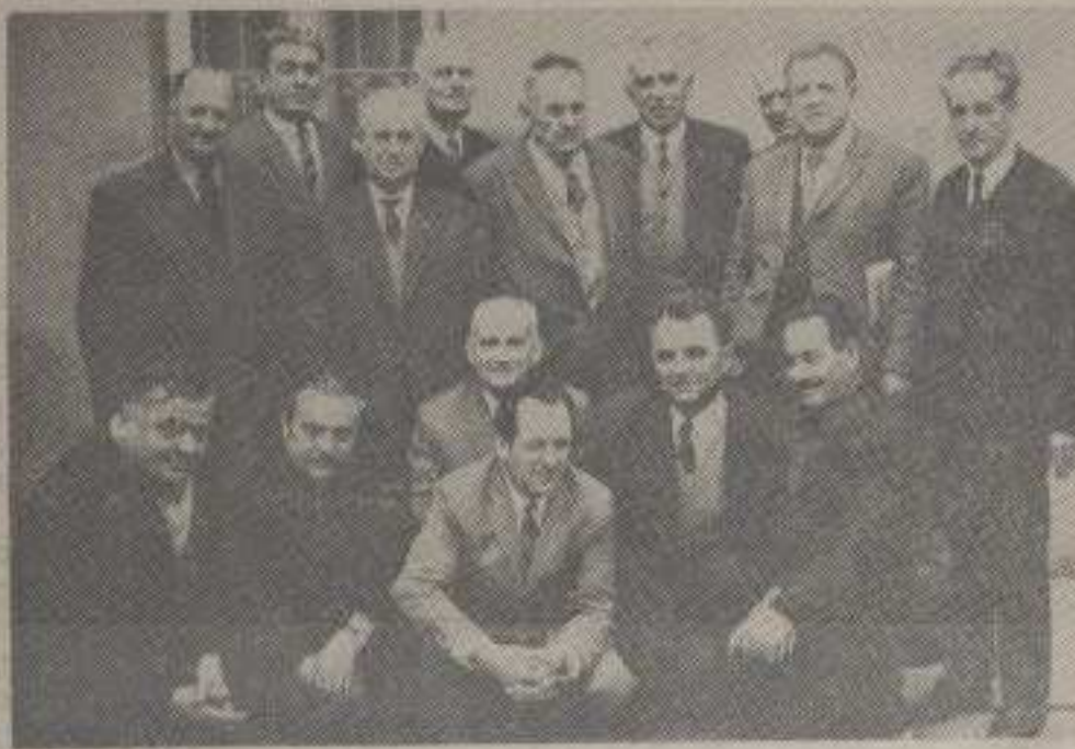
ИЗ ОРГАНИЗАЦИЈЕ ПЕНЗИОНЕРА