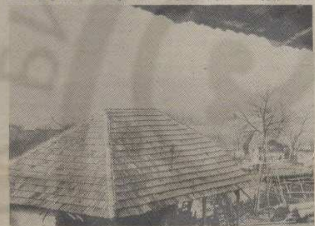
Кровови у Петропољу

Било је мало свађе, препирња, и оног карактеристичног сеоског игата, али Петропоље је добило воду. Са извора Видарича и Беда вода, свака кућа у селу добила је здраву пијаћу воду.