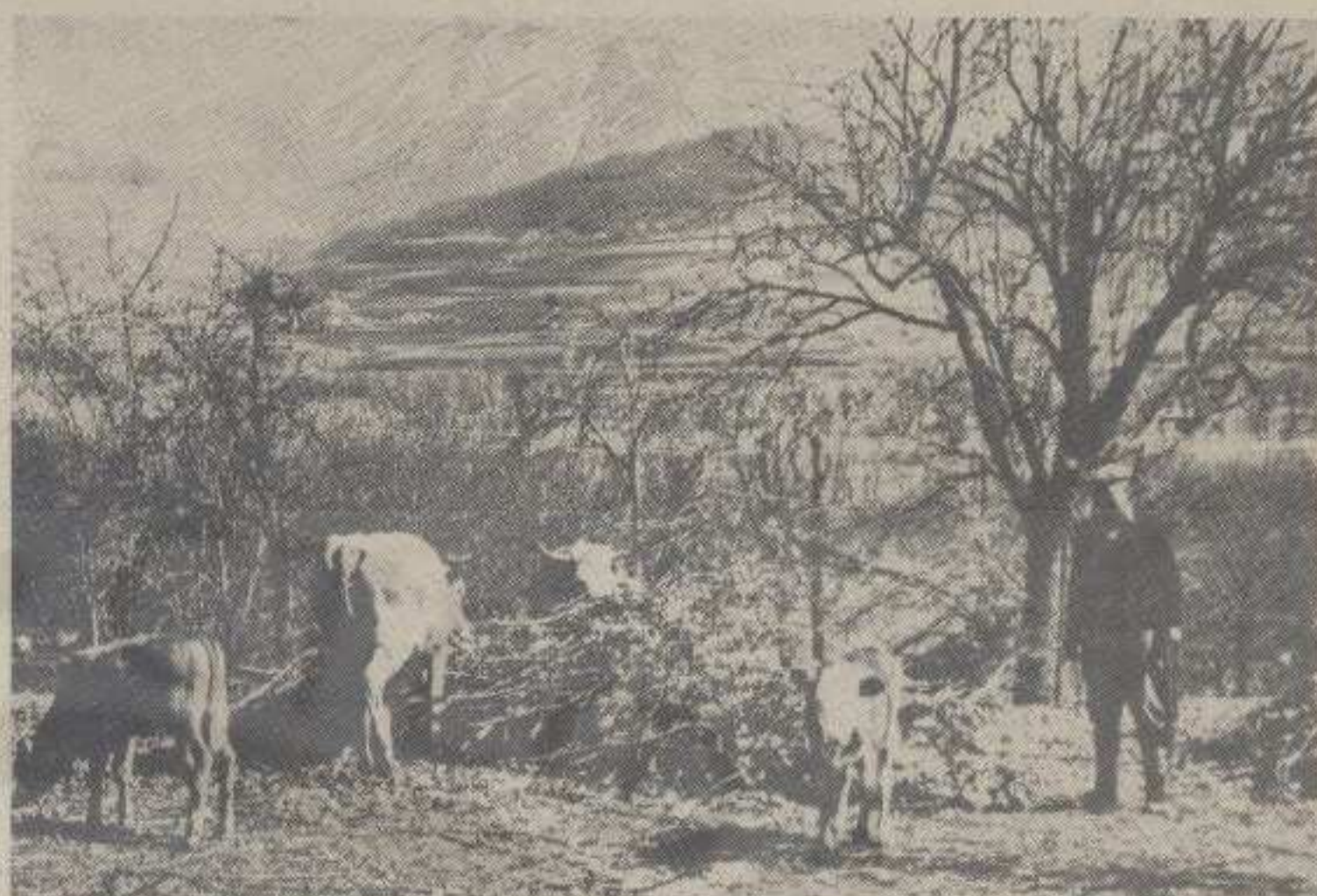
М. Јаснић: Испуст стоке на зимском сунцу

На недавно одржаној седници председништва актива Савеза омладине села Врбе одлучено је да се отвори Диско клуб, који већ ради. Том приликом је истакнута потреба веће сарадње са припадницима Југословенске народне армије из Краљева. Тако је Диско клуб Врбе постао привлачно свратиште младих са овог подручја, па и шире.