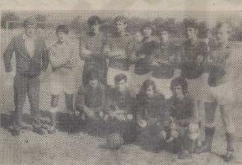
Чланови „Ибра“ на окупу

кажу стари „о том потом.“ Изгледа да ће првенство бити са много обрта и неизвесности. Гаранција је свакако решеност бар водећих да оправдају поверења савијача и некако докажу своје вредности како би стекли и нека материјална средства. Јер под оваквим условима не личи ни на најобичније децке који су се скупили на пољани да мало „ликају“ лопту. Фудбалери Ибра су пре две године успели да изграде и стадион. Обична ледина која се када, почне киша претвара у праву блатушу. После утакмице фудба-