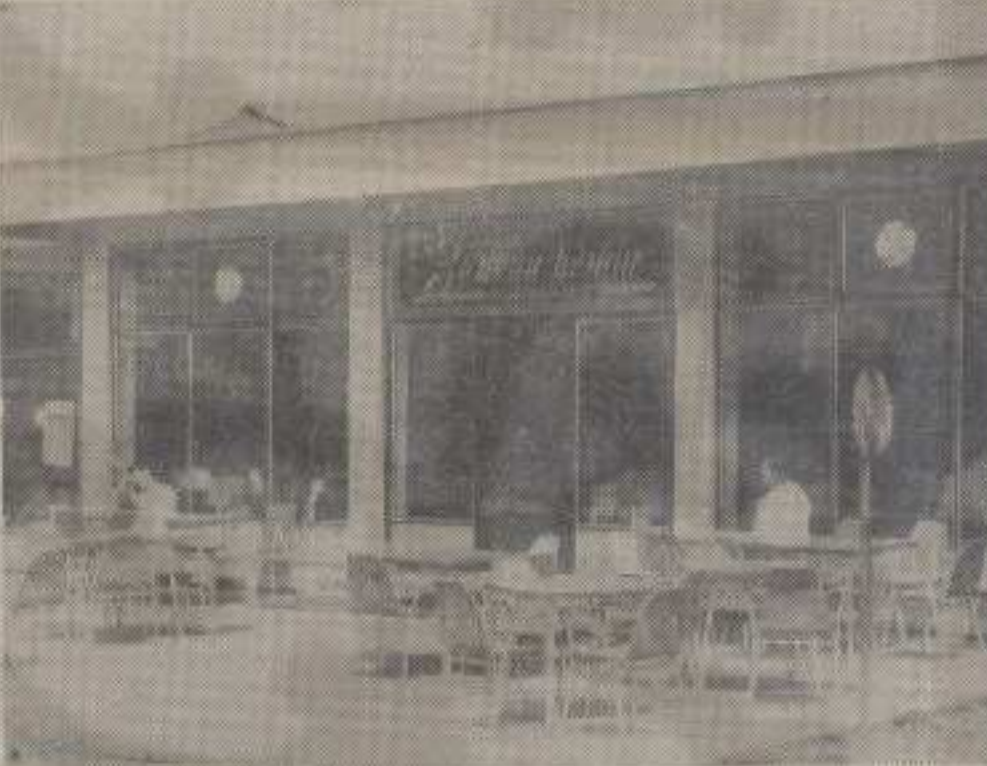
Кредити за самосталне радње

Занатлије и немају довољно снаге да саграде објекте у којима би се рад одвијао без тешкоћа јер не поседују средства за то. Код њих се јавља проблем кредитирања. Комерцијалне и пословне банке не дају појединцима средства за то, па питање изградње пристојнијих простора се одлаже ко зна до када. Било је додуше покушаја да се и на овом плану нешто учини али је и тамо зајавила покретачка машина. Покренута је акција за учлањавање занатлија у занатску — штедно кредитну за другу како би се убрала средства која би се могла користити за инвестиције. Успеха за сада није било, а како ће се ствари на овом плану одвијати даље видећемо. Овде се појављује проблем незаинтересованости самосталних занатлија за укључивање у задругу па се због тога у наредном периоду о овоме мора повести више рачуна. Ово тим пре што се зна да су на пример Крушевљани овај проблем сасвим успешно решили и што би се могла користити њихова искуства. Пр-