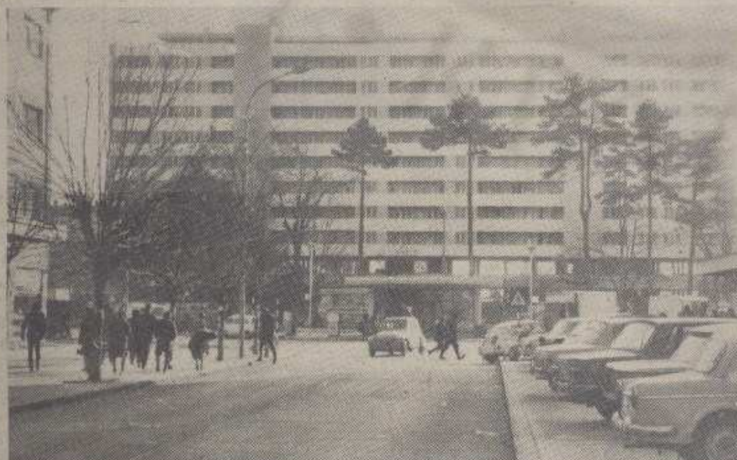
Крајево: жива политичка активност