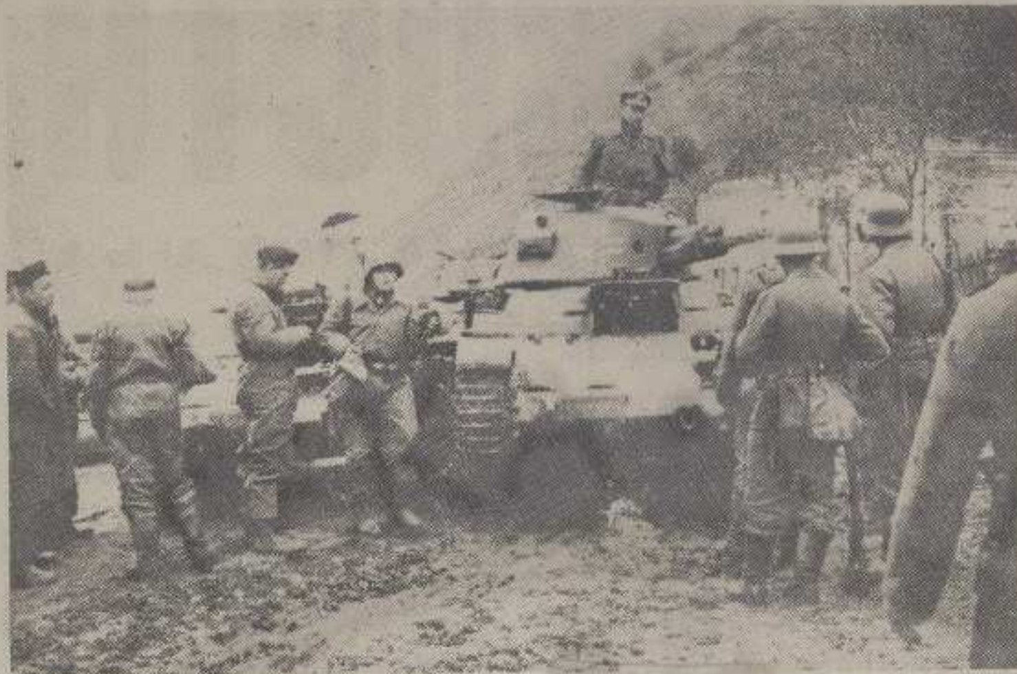
Трагом докумената о стрељању октобра 1941. г. у Краљеву