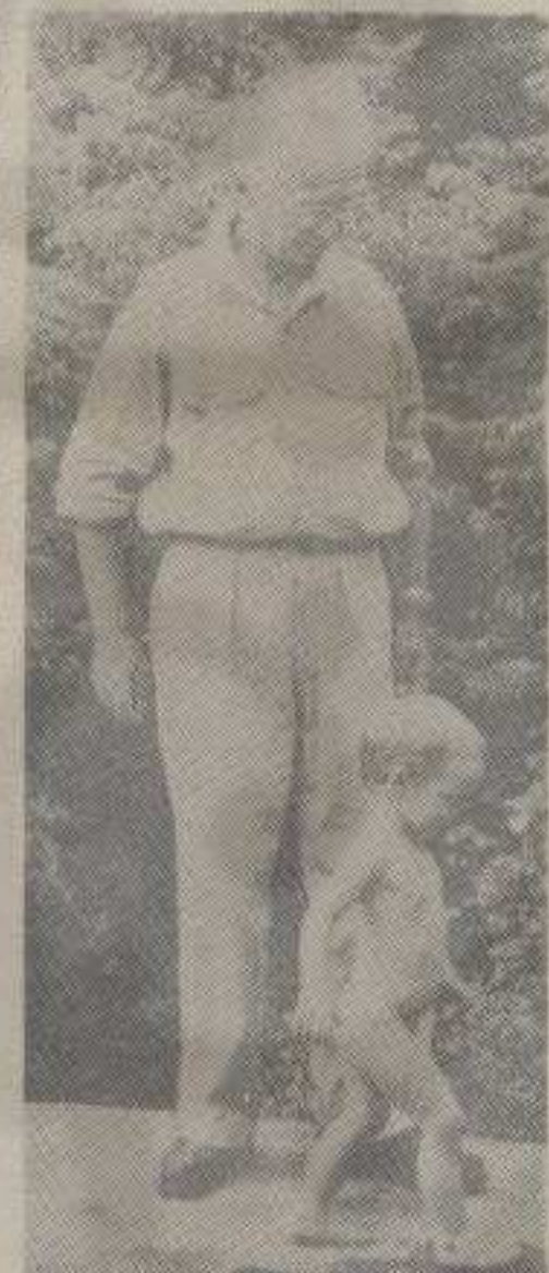
Васпитање од малих ногу

Треба да добије свој природни наставак било је доста рећи, а што је веома значајно и подударних мишљења. Чињеницу да су наше школе данас више образоване него васпитне институције многи