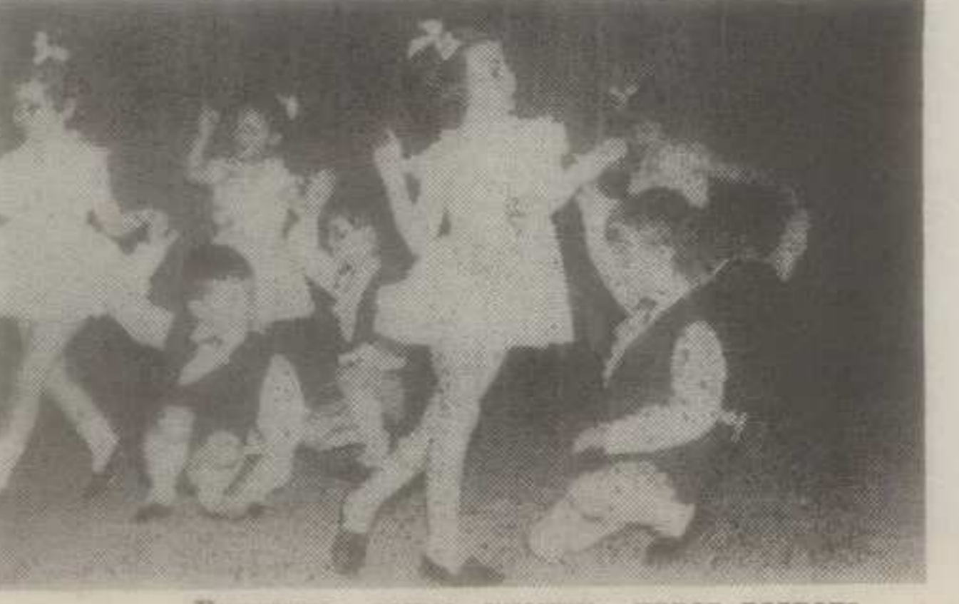
Ритмичка тачка ученика првог разреда