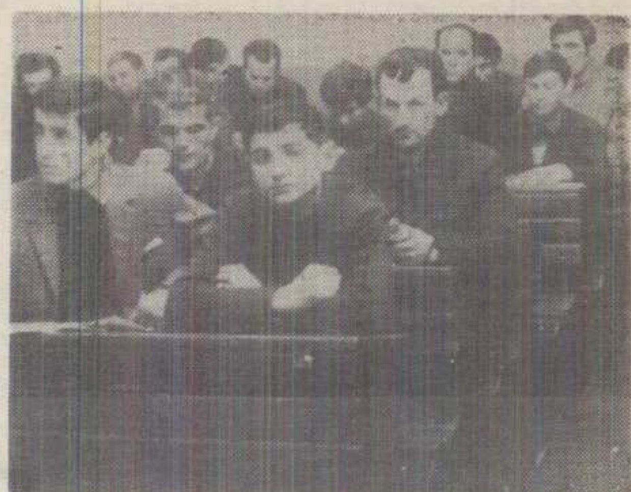
М. На часу за образовање одраслих у Вранешима

краљевачке средње школе, не појединачно, већ заједнички расписале конкурс идућег месеца за упис ученика у прве разреде за идућу годину.