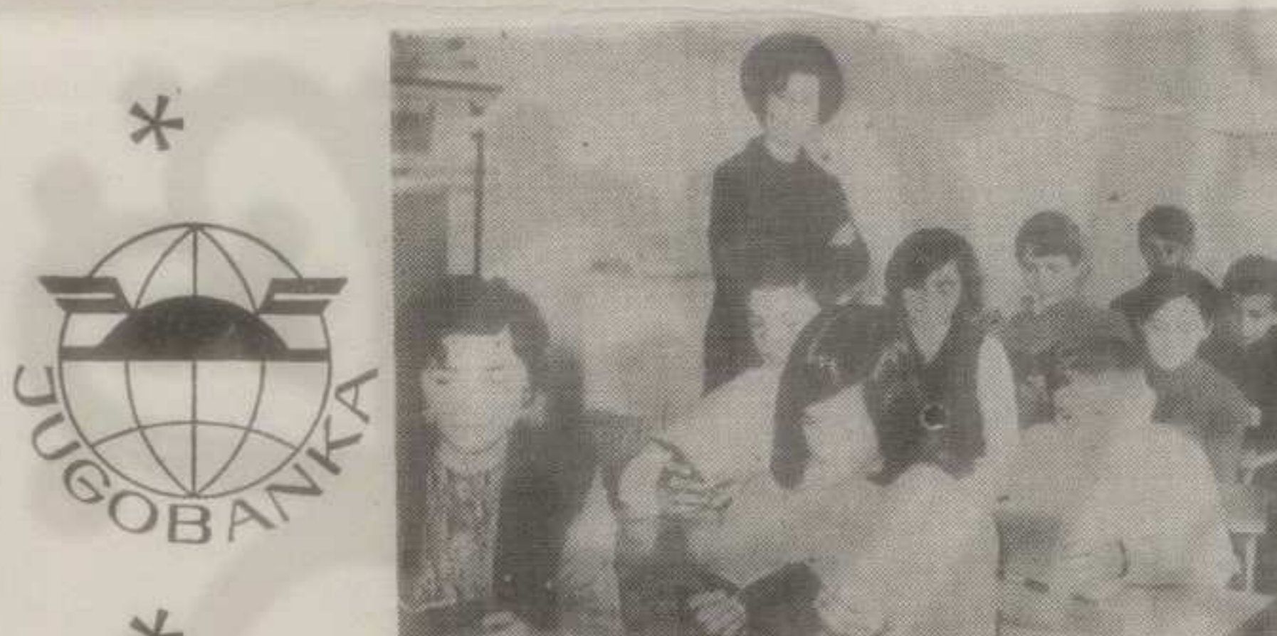
Одељење штедиша у Лаћевцима

КОД ЈУГОВАНКЕ, Филијале у Краљево штеди око 4.000 ученика основних школа са подручја општине — Краљево.