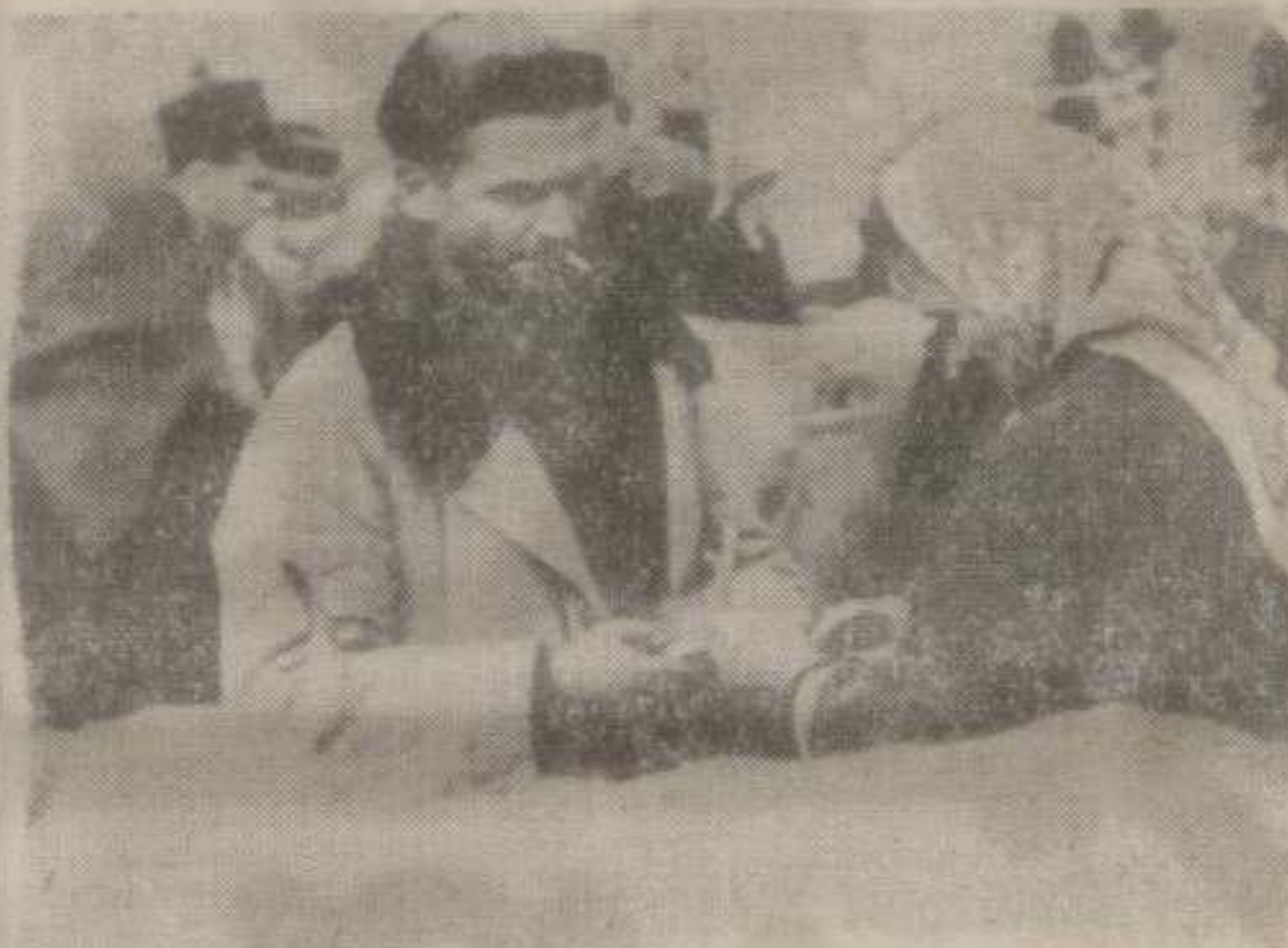
Што масовније на зборовима

Детаљни обрачуни и документација за претходне варијанте, налазе се код стручне службе Завода и због обимности нису могле да се објаве у листу.