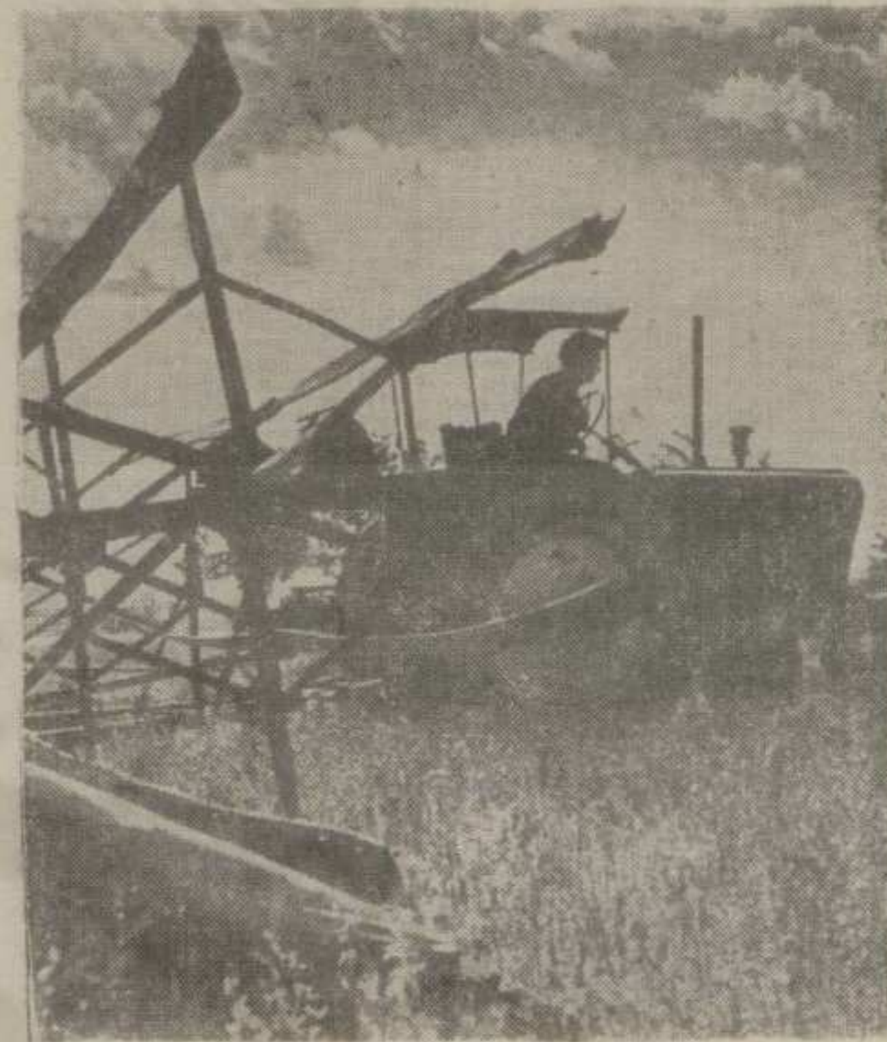
За зборове осигураника сви треба да буду заинтересовани

б) Уколико осигураници желе већи обим здравствене заштите, од овога што је Закон прописао, они сами, према сопственим потребама и материјалним могућностима утврђују на подручју своје заједнице обим права и своје обавезе према Фонду ко