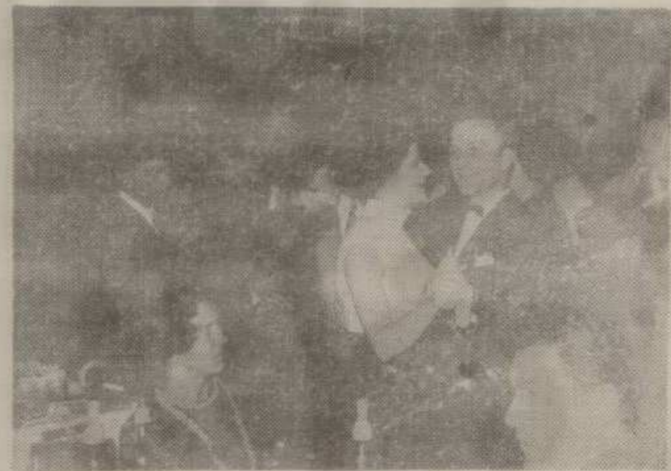
Дочек Нове године у хотелу „Турист“