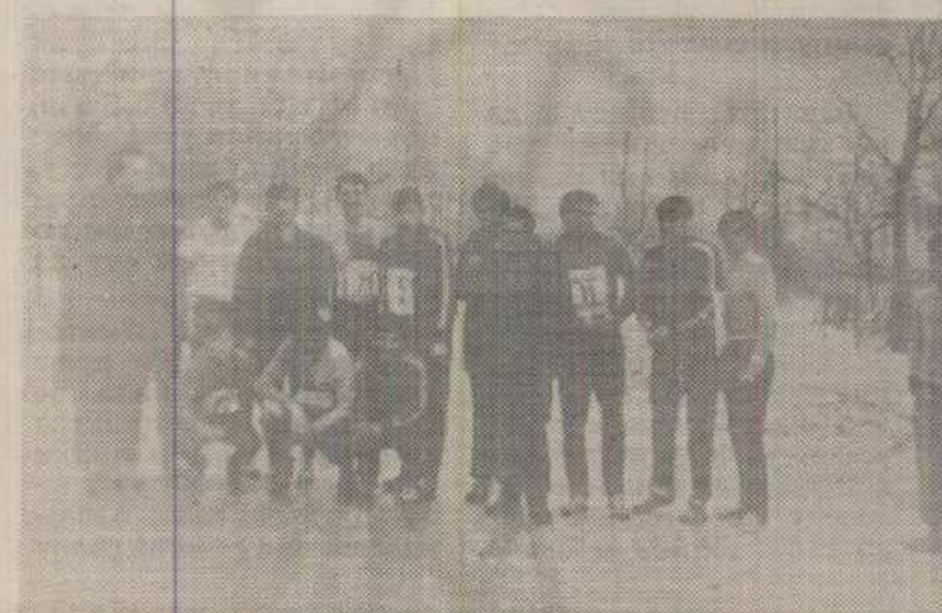
Учесници кроса у Мрсађу

★ Крос на залеђеној стази уз велики број гледалаца