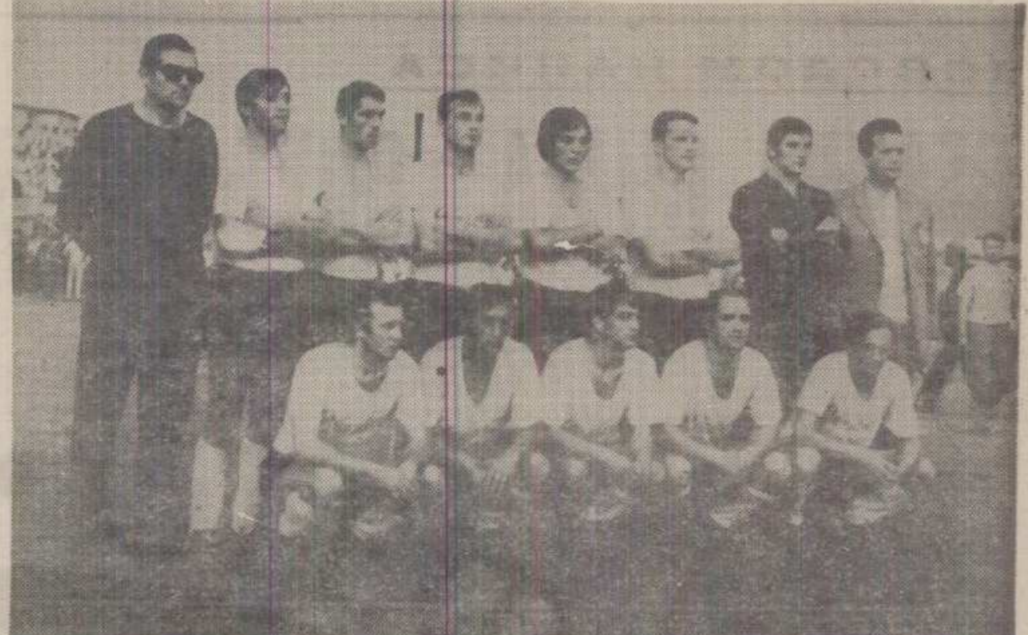
Негма успомена: тим „Слоге“ првак Источне групе Друге савезне лиге у сезони 1969/70.

Краљево — Атлетичари рили такмичарску сезону у АК „Металац“ први су отво