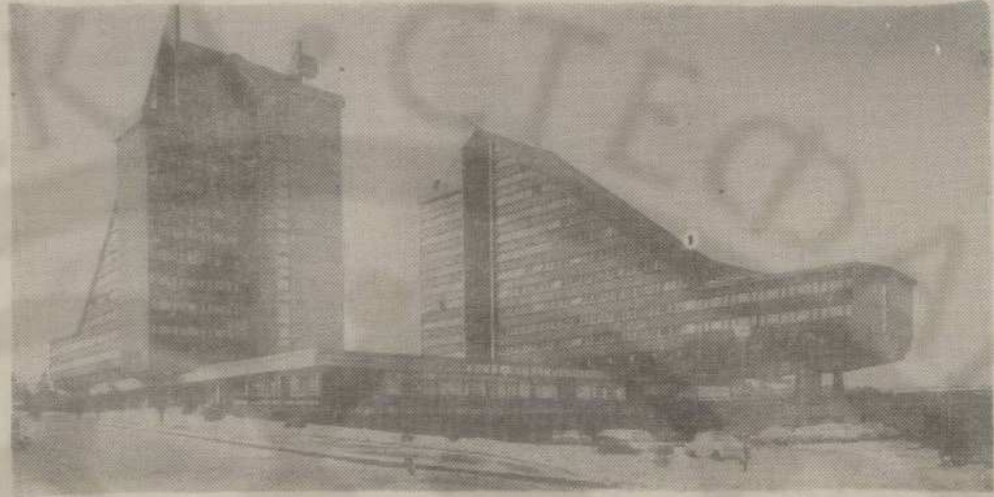
Хотел у Оберхофу на коме су изводили радове и радници „Керамике“

— Имате ли тешкоћа? — Једино око наплате реализације. Овогодишња реализација биће преко две милијарде старих динара. Трећу нам наши пословни пријатељи дугују преко 600 милиона старих динара. Послујемо старим капацитетом. У пословном фонду располажемо са 300 милиона старих динара.