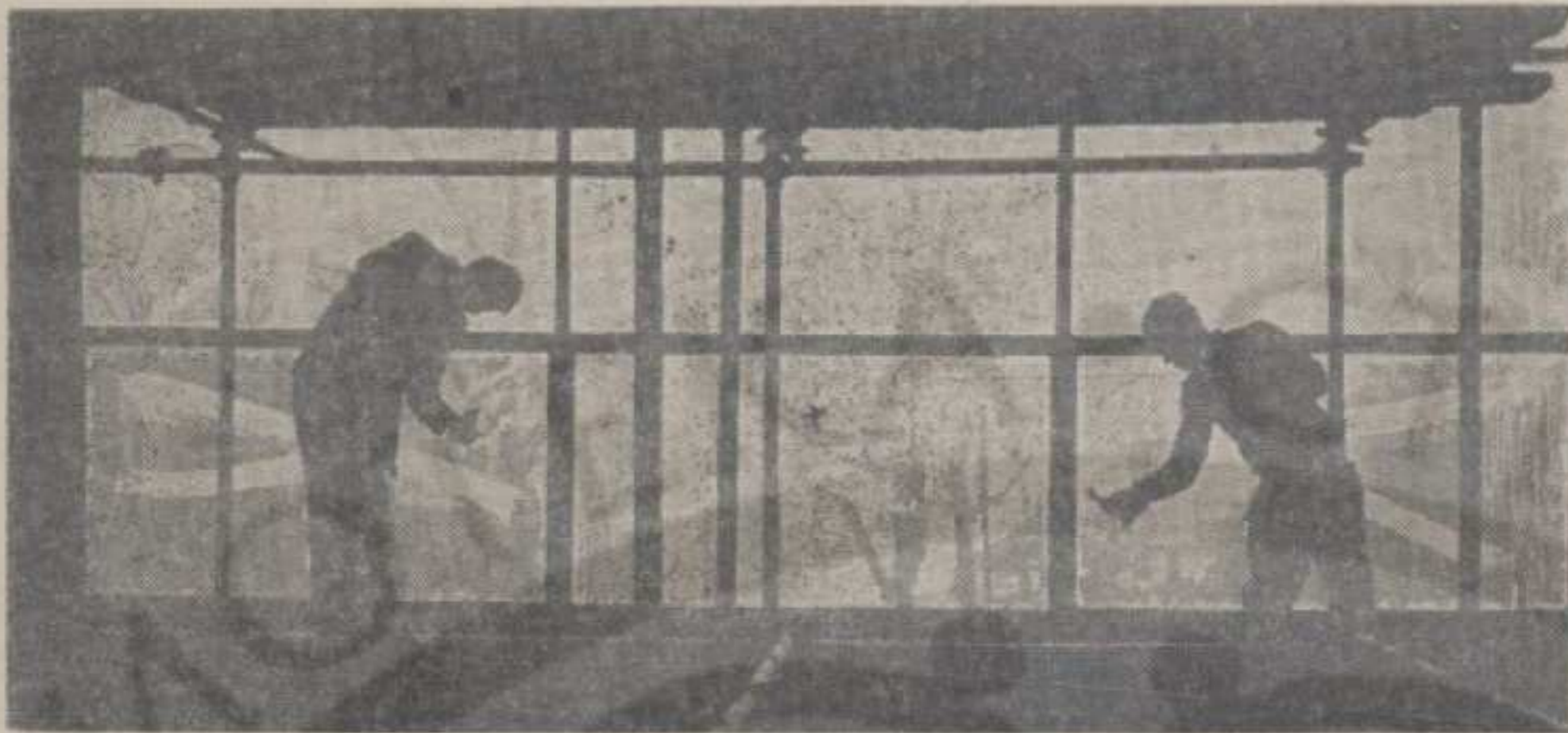
А шта сутра?