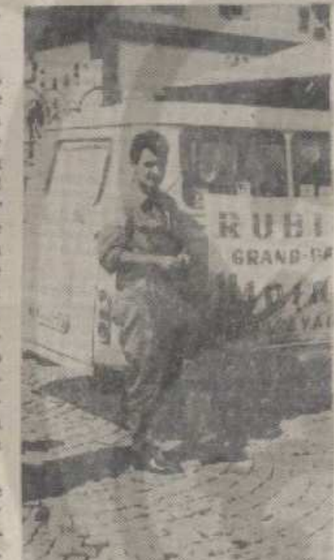
Колаковић поред кола «Жу негов рубина» из Крушевца који желе да имају патронат над краљевачким бициклистима

ца» пратио је до сада на свим већим такмичењима у земљи и иностранству (Мађарској и Бугарској), а ове године добио је значајно признање да као механичар буде члан репрезентације