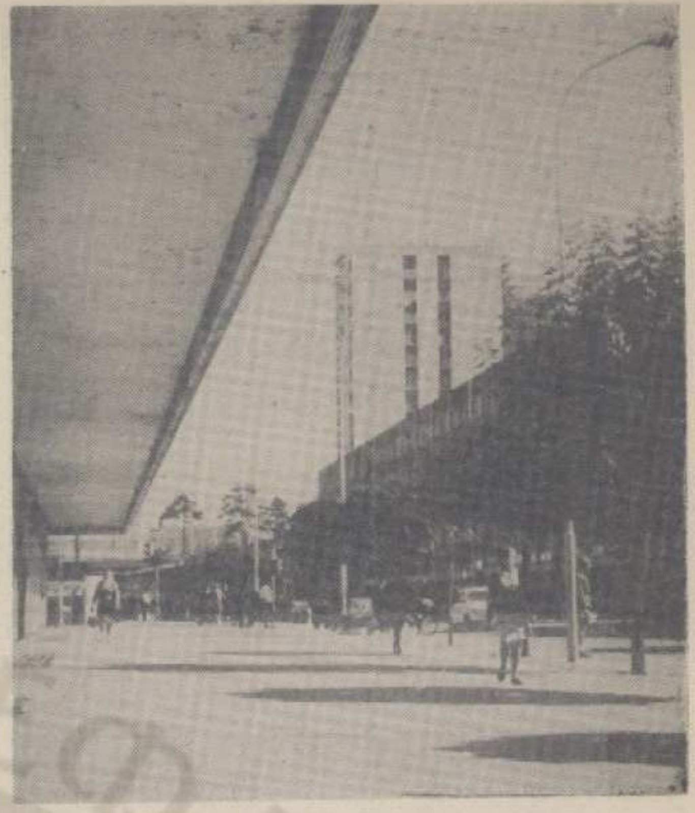
Нови углови Краљева

жњом суду, који, марта ове године, потврђује пресуду првостепеног суда. Оно што је још у вези са овим «случајем» интересантно напоменути: ни до данас није расписан поновни конкурс за радно место референта заштите на раду, што озбиљно доводи у сумњу основаност потребе за њихово расписивање.