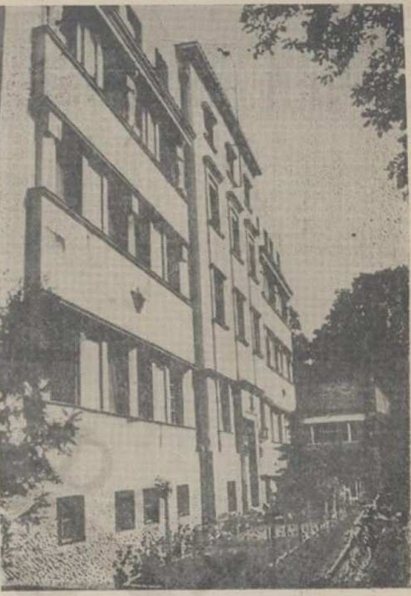
Зграда Железничког одмаралишта у Врњачкој Бањи