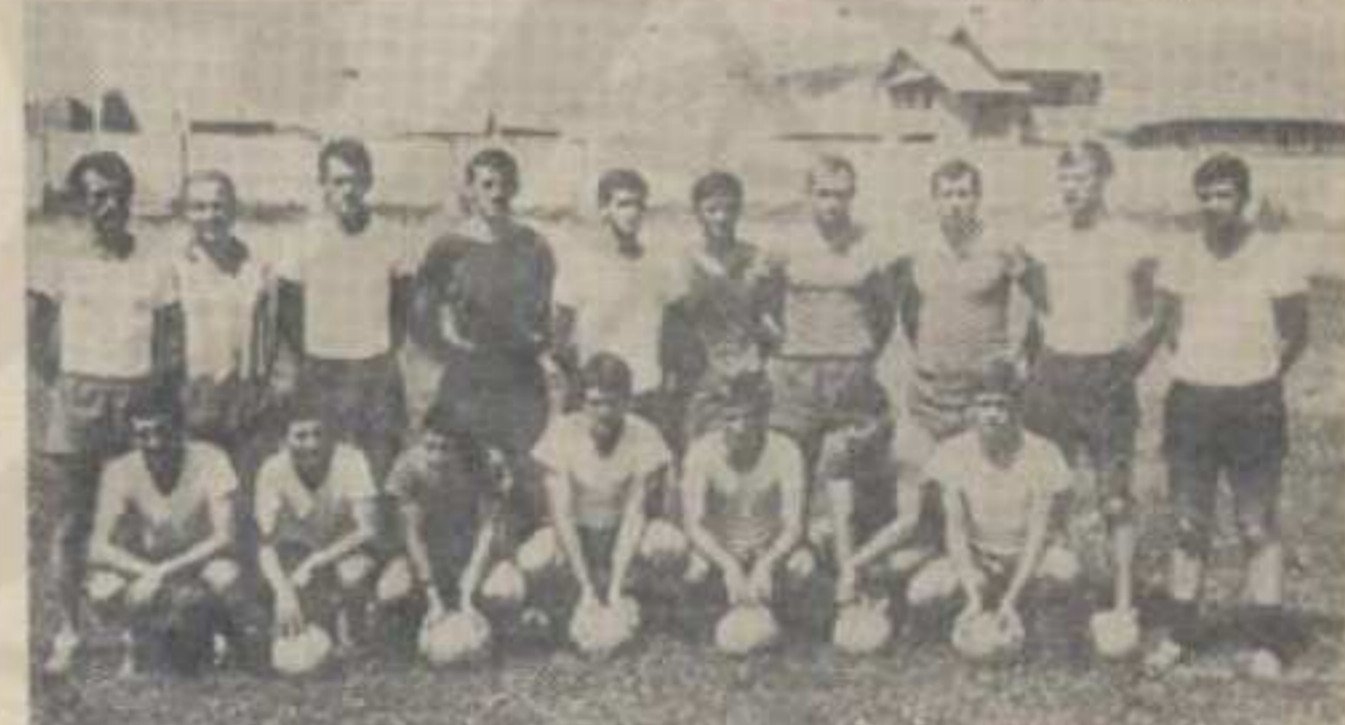
Екипа Новог Пазара

Играло се на градском стадиону по лепом и сунчаном