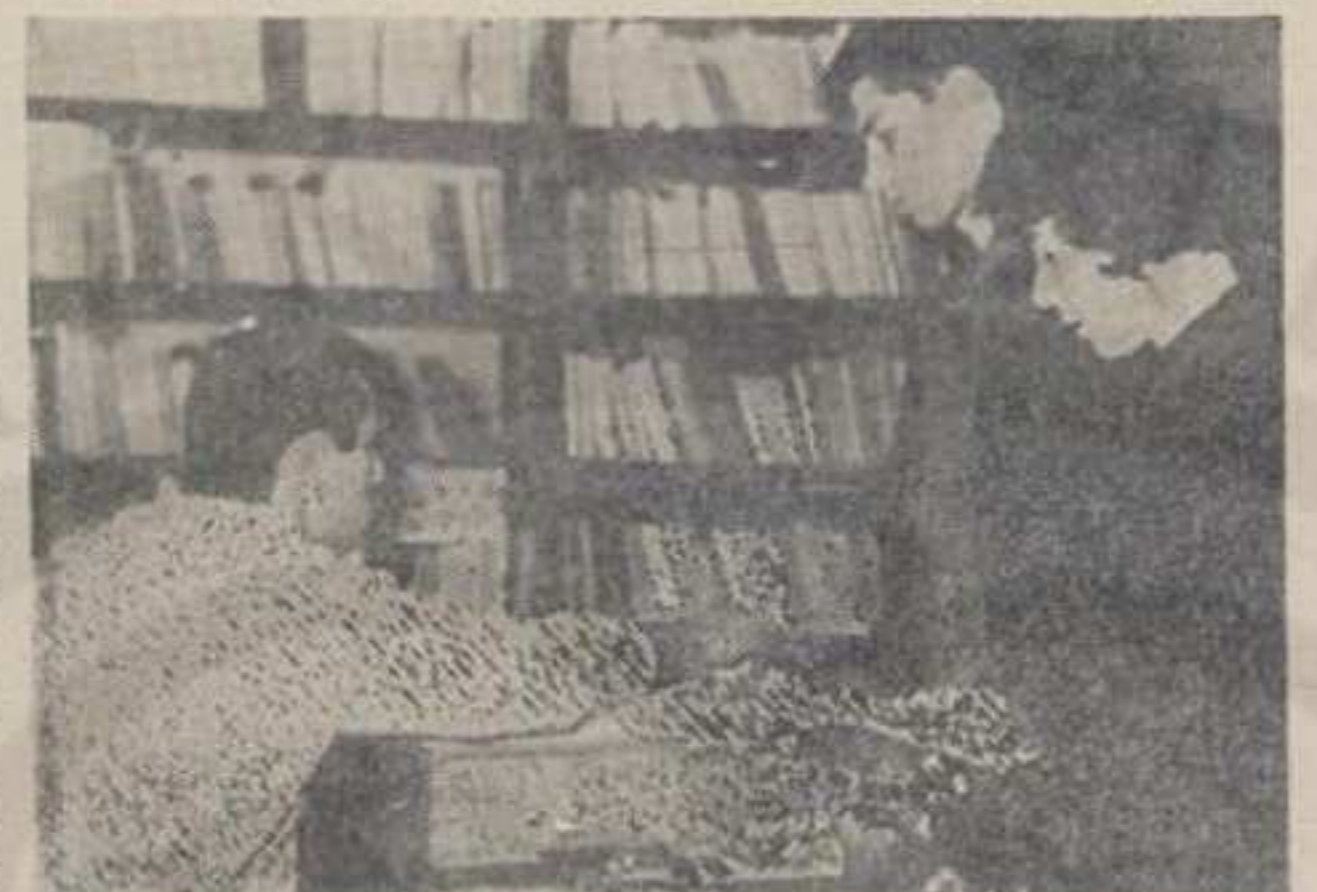
Тешкоће у финансирању образовања

њачке Бање. Да би убудуће Заједница образовања што боље пословала Савет за просвету, културу и физичку културу Скупштина општине је мишљења, да би што пре требало предузети неке мере. По водом тога препоручује се Заједници образовања, да што пре размотри могућност оснивања међуопштинске заједнице образовања са суседним општинама. Исто тако препоручује се Заједници образовања да поново раз-