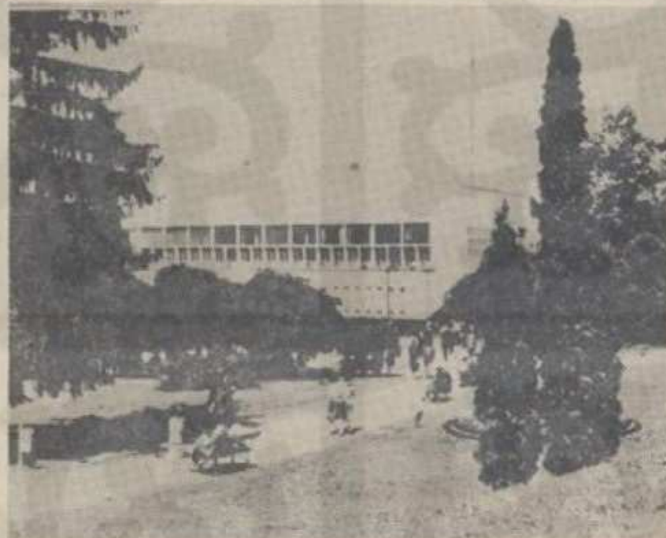
Зграда купатила Врњачке Бање

Општински статистичари бележе и један охрабрујући податак — да је Врњачку Бању до краја прошлог месеца посетило 3.519 странаца, што такође представ-