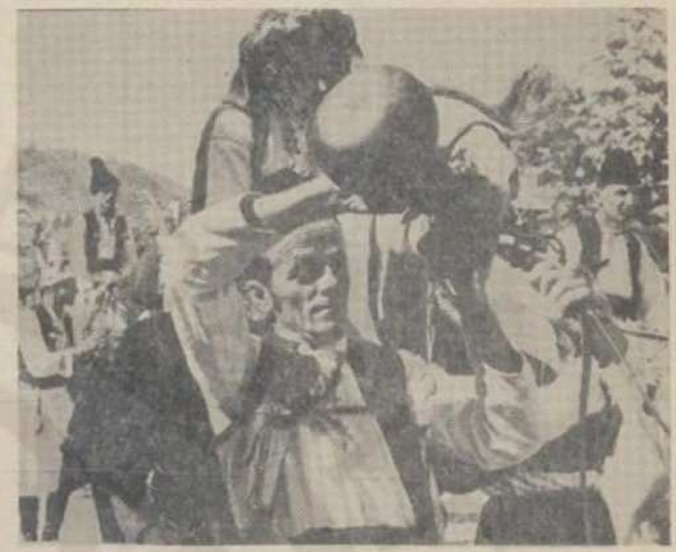
Прошлогодишња «Драгачевска свадба»

Седми традиционални Драгачевски сабор сеоских трубача одржаће се и ове године у Гучи 2. и 3. септембра. Организатори ове несумњиво највеће туристичке мани