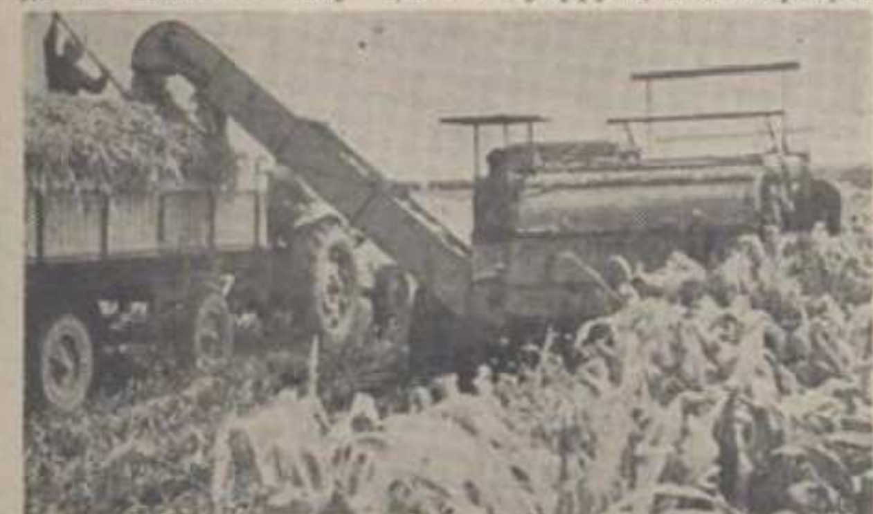
Много се променило и у пољопривреди