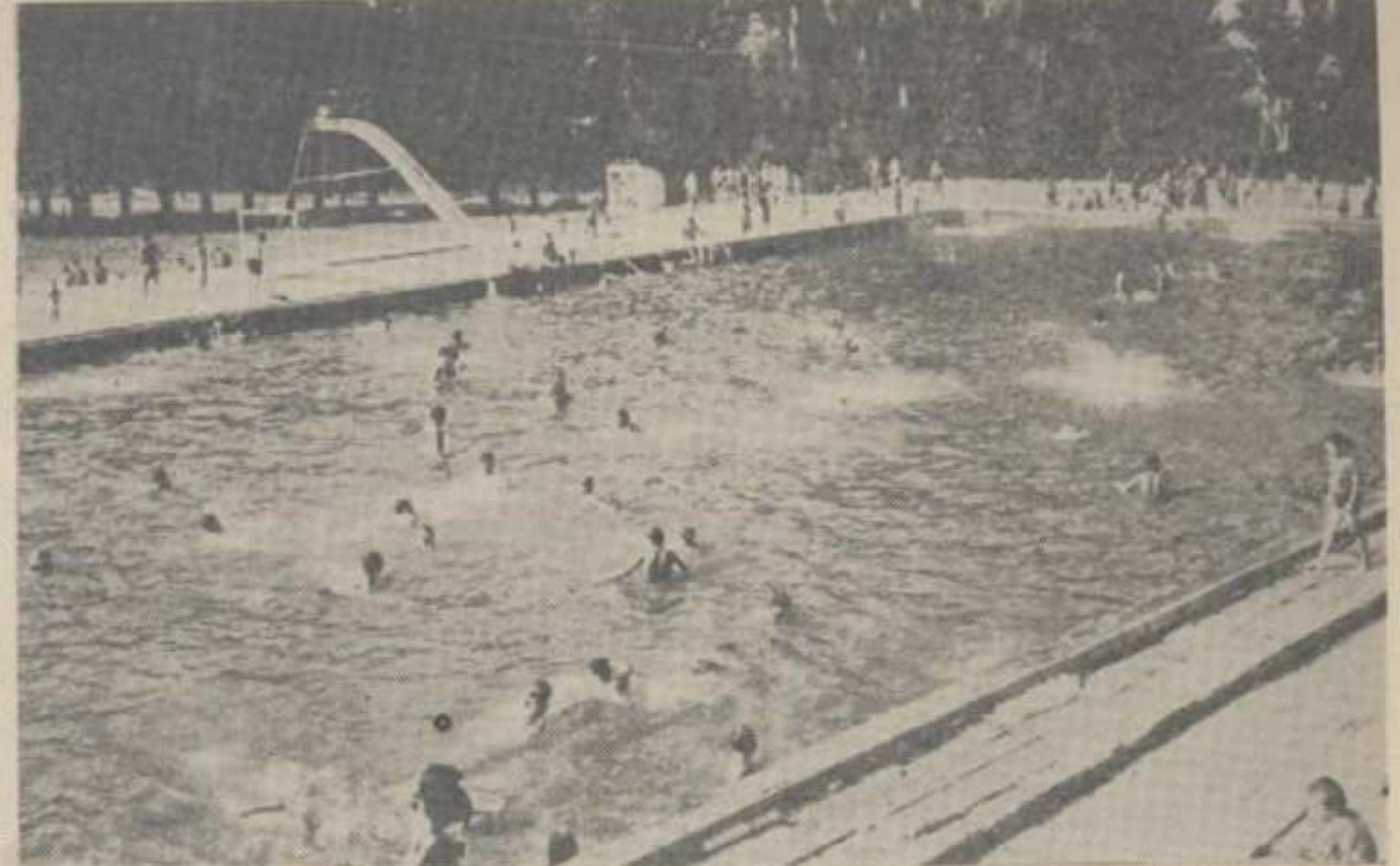
Олимпијски базен у Новом Пазару

Ловачко друштво «Партизан» из Краљева увело је награде за уништење штеточина и опасне дивљачи. Награда се даје за вука 200 нових динара, за лисицу 10, дивљу мачку 20, пса скитницу пет, мачку скитницу два, а за јаја пернатих штеточина по комаду десет нових пара. Оваква дивљач — штеточина може се ловити преко целе године. Као доказ за уловљену штеточину признаје се неопштењено крзно, а за пернате штеточине горњи део кљуна, за лисице, мачке и псе скитнице — реп.