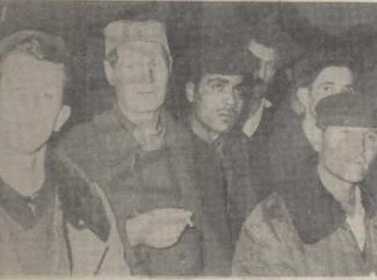
И они имају своје мишљење о култури

Циљ наше анкете био је да изнесемо што више различитих мишљења о стању, проблема и перспективама културног рада и стваралаштва у Краљеву и по селима краљевачке општине. Утолико пре, јер у овој етапи развитка нашег социјалистичког друштва, више него ма када раније, наука, образовање и култура постају саставни део производних снага и це докупне друштвене репродукције. И свакако не само то. Они су све више и један од битних чиниоца даљег развоја и усавршавања нашег самоуправног система и формирања радног човека као свестране и слободне личности. Ако узмемо још у обзир да је културно стваралаштво нераздвојни део друштве