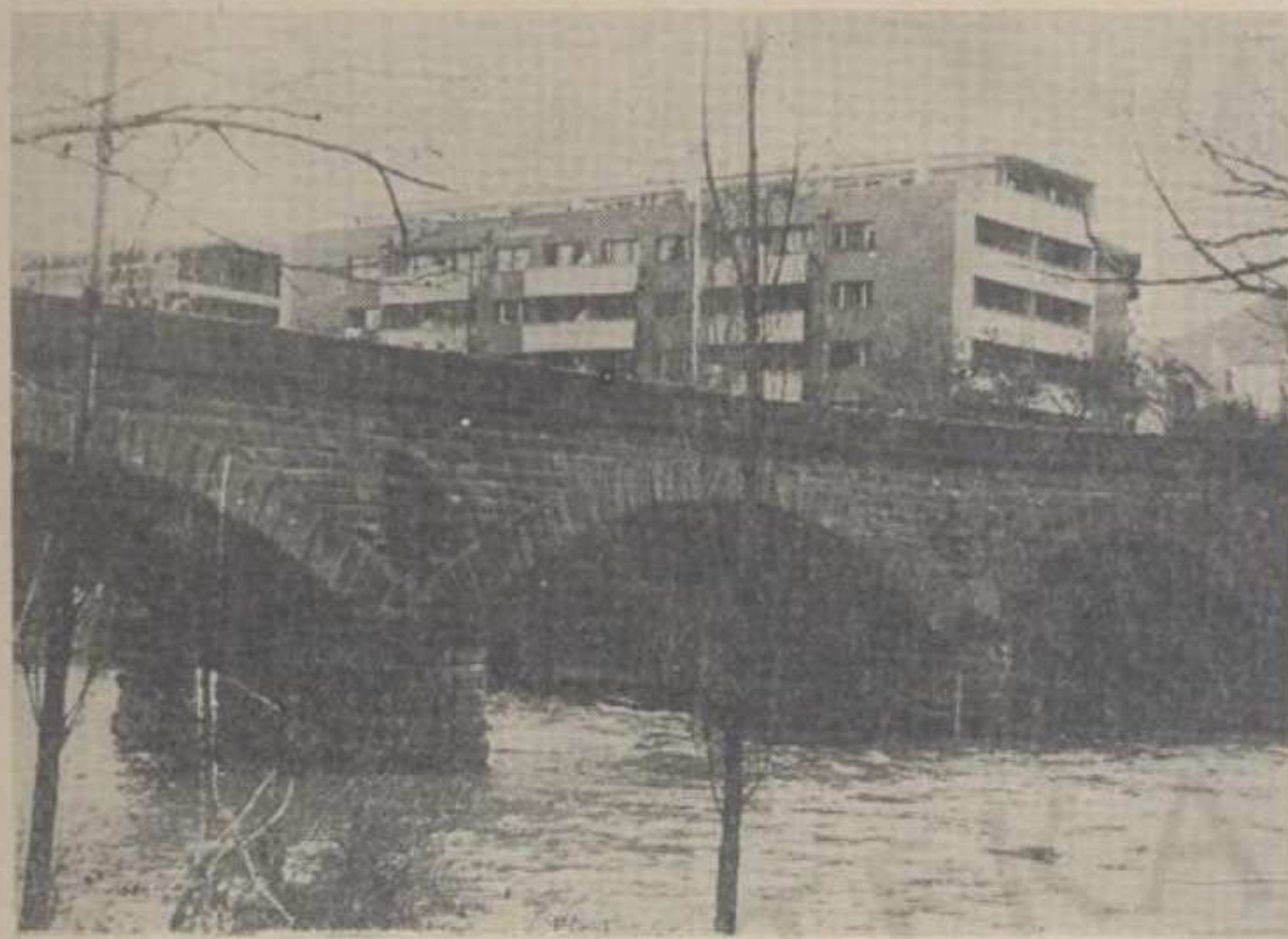
РАШКА: Мост на Ибри