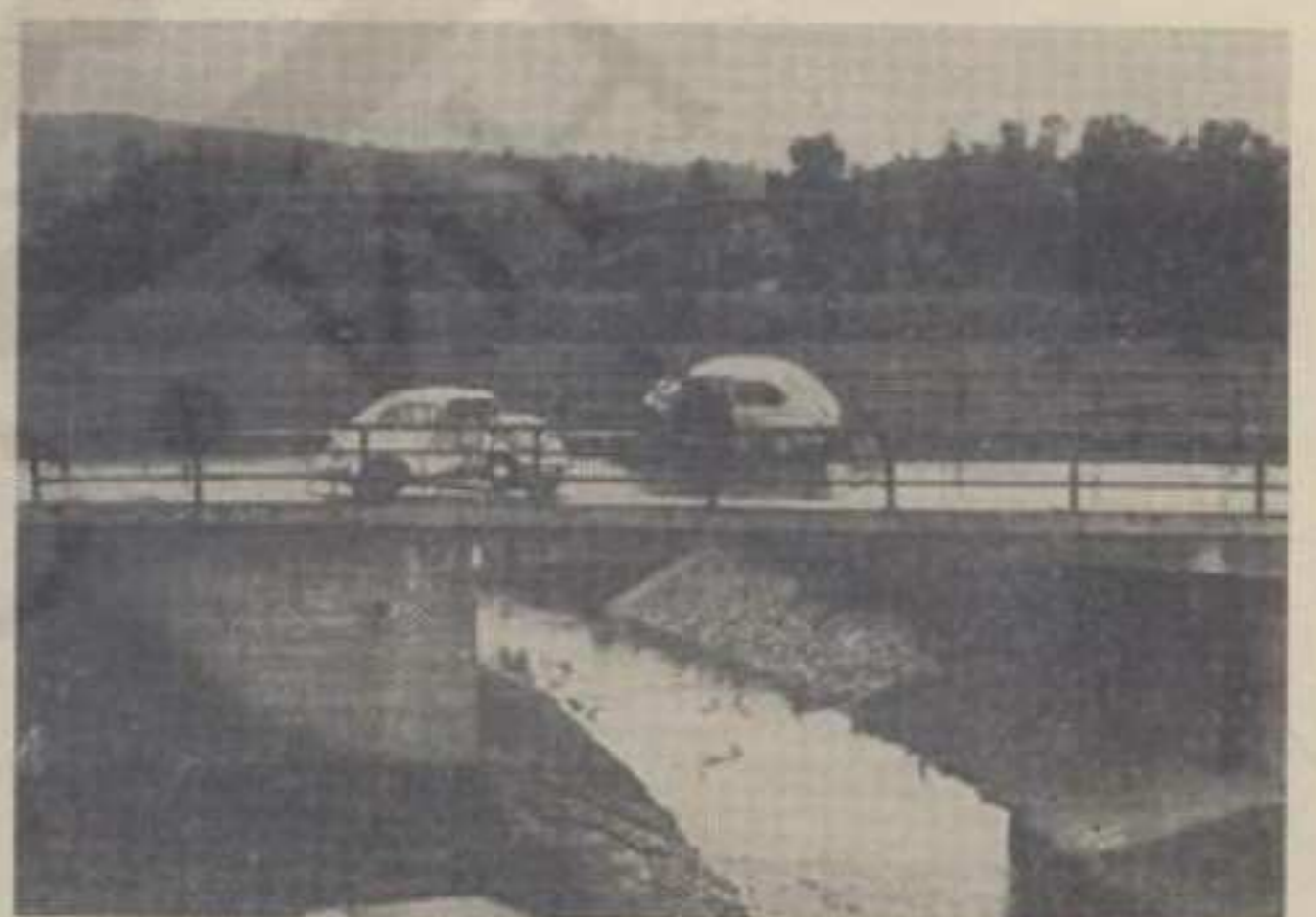
Удес на Ибарском мосту

свих учесника у саобраћају. Нарочиту пажњу треба покренути у школама кроз систематско упознавање ученика какве све опасности могу да искрсну у саобраћају.