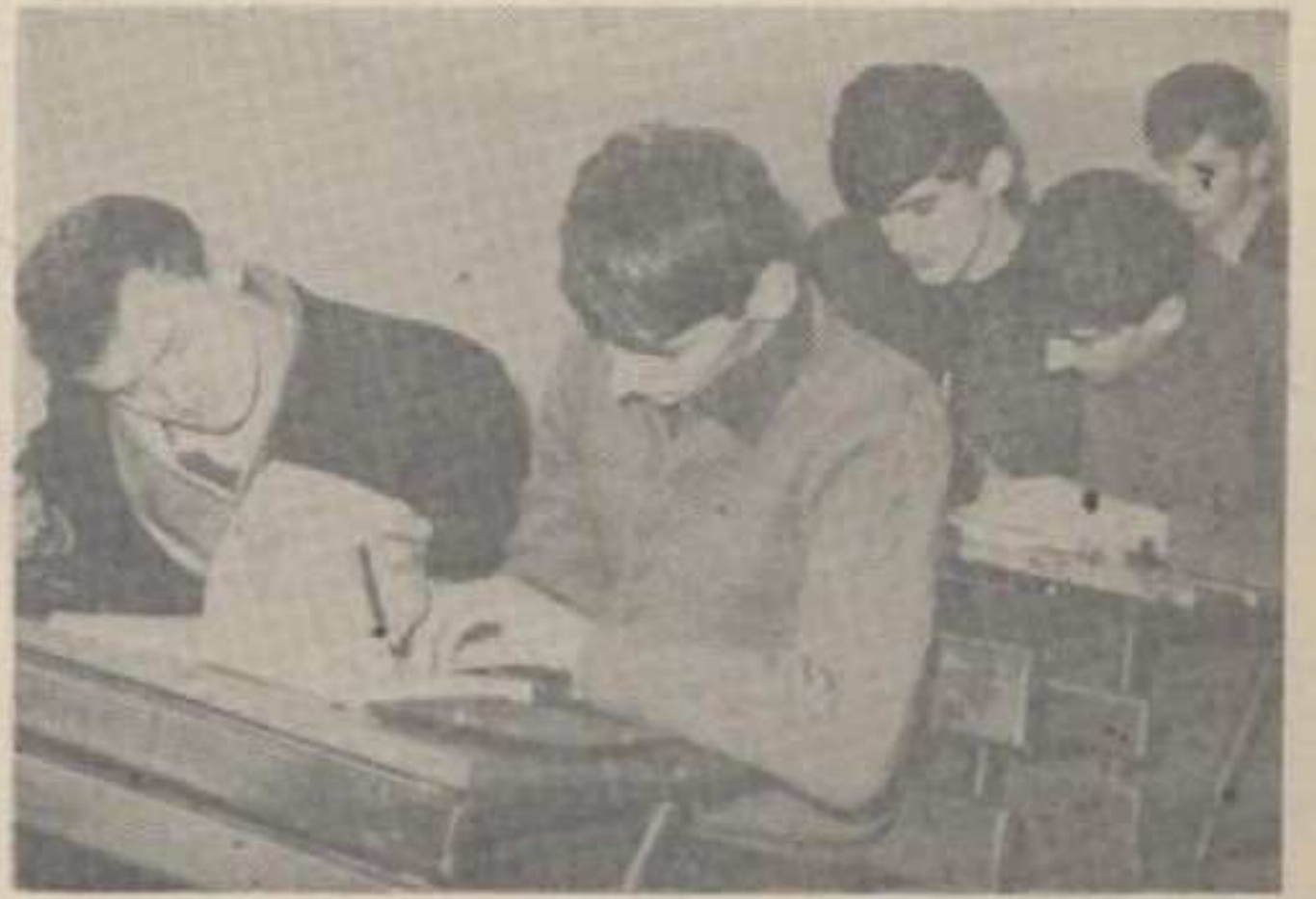
Није само тешко доћи до дипломе