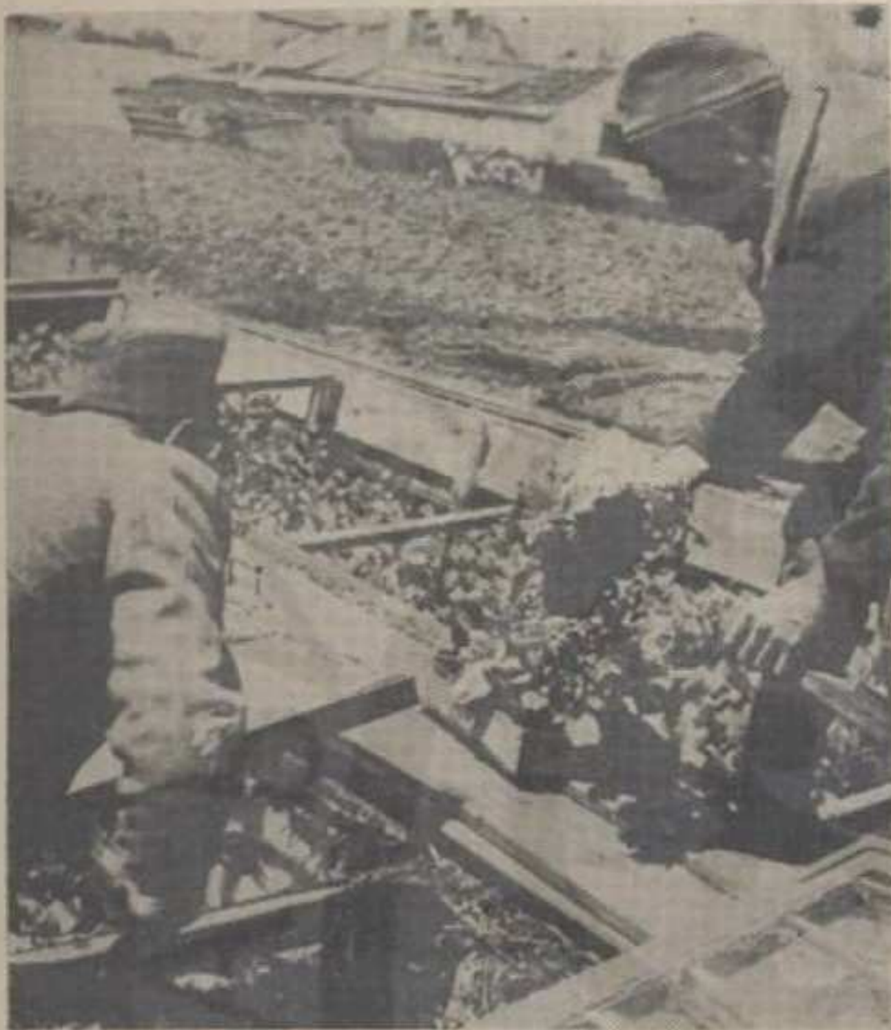
Све веће економско снажење села

И док у великим градовима без одобрења урбаниста не може ни у дворцима зграда да се подигне гараже или нешто друго, дотле се у највећем броју села широм