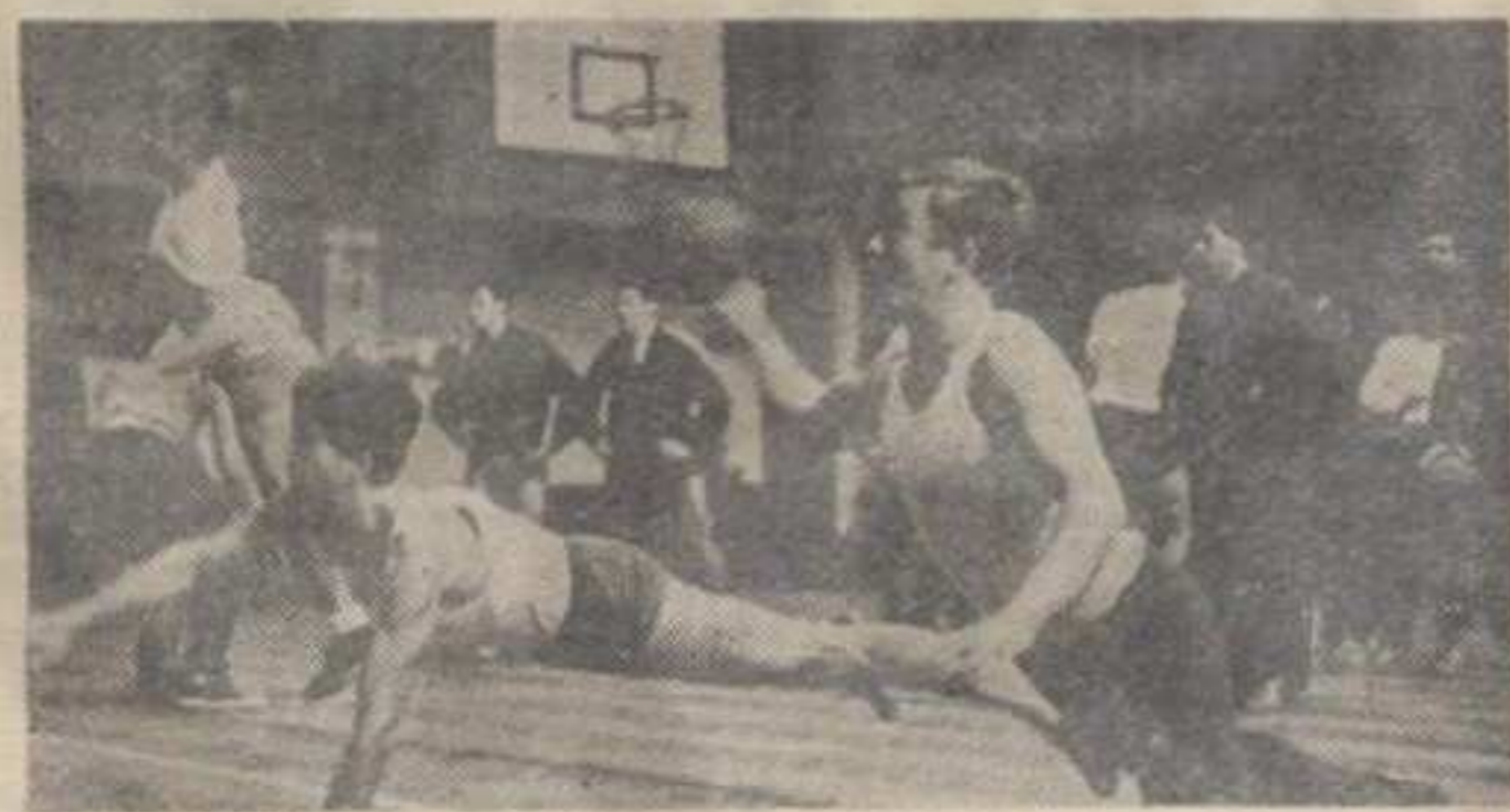
На школском часу физичке културе

Док крајњи исход на табели толико не забрињава чланове Управе Металца, њих мори друга брига, како и на који начин финансијски опстати. Само од улазница, чланарине и помоћи неких привредних организација клуб је у јесењем делу првенства остварио 835.000 старих динара, док су трошкови за путовања, хранарина играчима, плаћање тренера, економија, набавка реквизита, одржавање тренинга, плаћање огрева, светла и осталих трошкова, изнели близу 4,5 милиона старих динара.