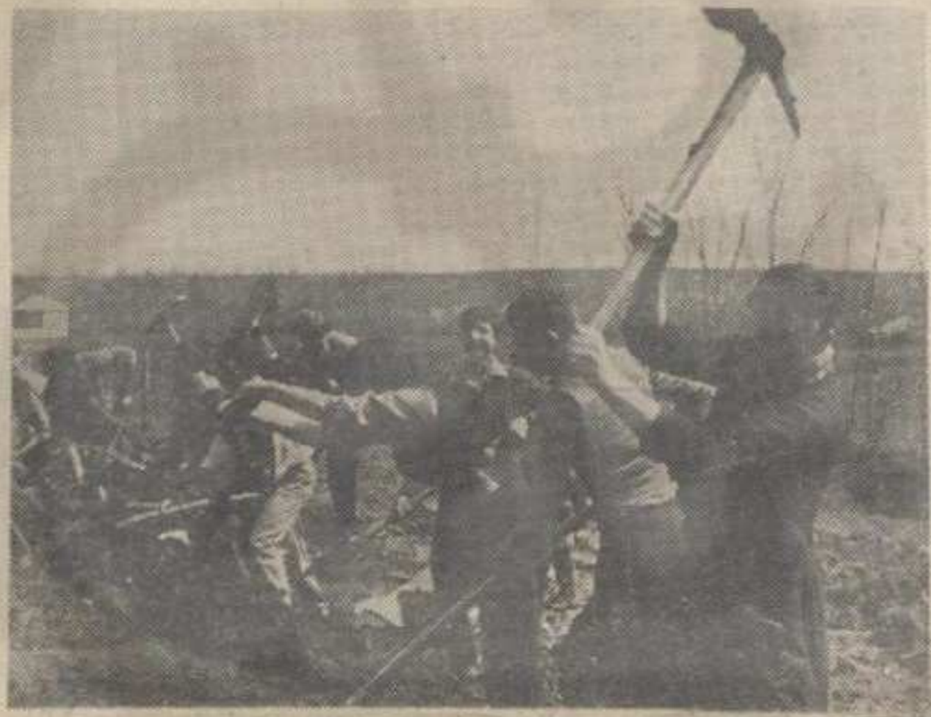
Омладинци на радној акцији

«Активност школске омладине одвијала се кроз најразличитије форме рада. У току протеклог периода постигнута су различита резултата у појединим школама. У част новембарских празника и Дана ослобођења Краљева, уз учешће великог броја омладине из свих школа, изведен је марш «Трагом ослобођења Краљева». То је била значајна манифестација у којој су учесници марша имали прилике да се ближе упознају са историјом ослобођења града.