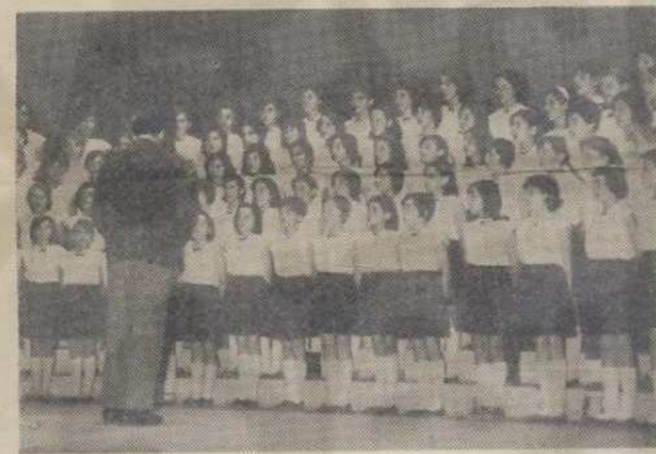
Хор новопазарских ученика Основне школе »28. новембар«

празник. Једини хотел, који узгред речено већ годинама нема музике, није баш погодно место за породичног човека, па ипак многи навраћу тамо — јер немају где. До душе, других кафанија и кафејација има на претек. Једини биоскоп у граду је такође поново привлачан за бројне љубитеље филма. Али, то је све што град у оквиру културне разоноде данас може да пружи радном човеку. Прилично сива и монотона панорама.