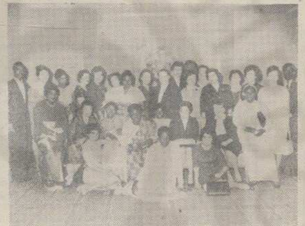
Представнице Гане, Кеније, СССР и Пољске са представницама жена Југославије