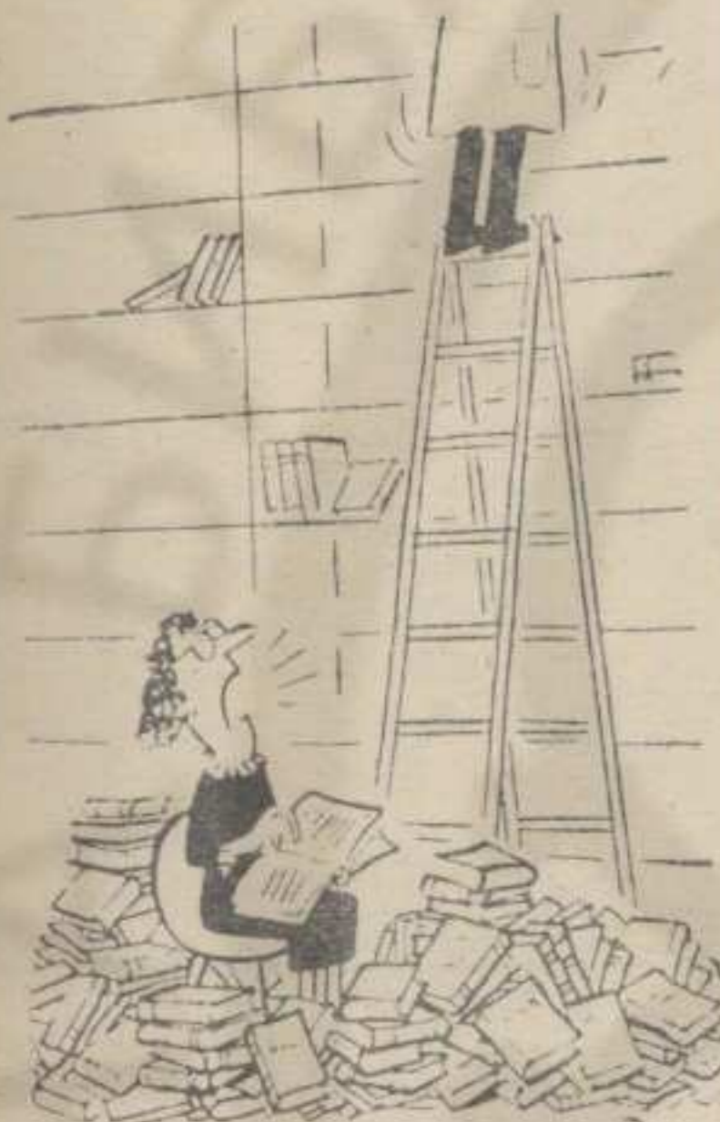
— Ни овај ми се свршетак не допада