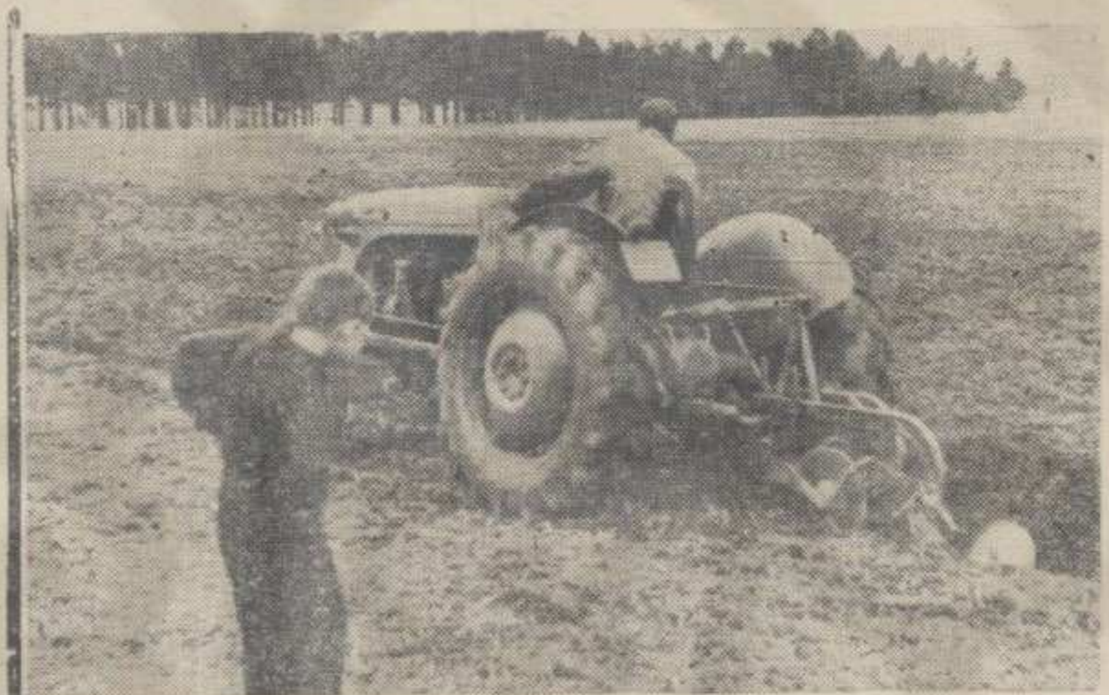
Орање трактором за јесењу сетву

Други важан фактор за постицање високих приноса је примена потребних количина минералних ђубрива. Пшеница, као и другим живим биљкама за њихово ницање, пораст и доношење високих приноса неопходна је храна. Она ту храну не налази у довољним количинама у земљишту.