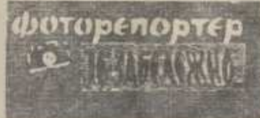
Фото-новине ученика основне школе