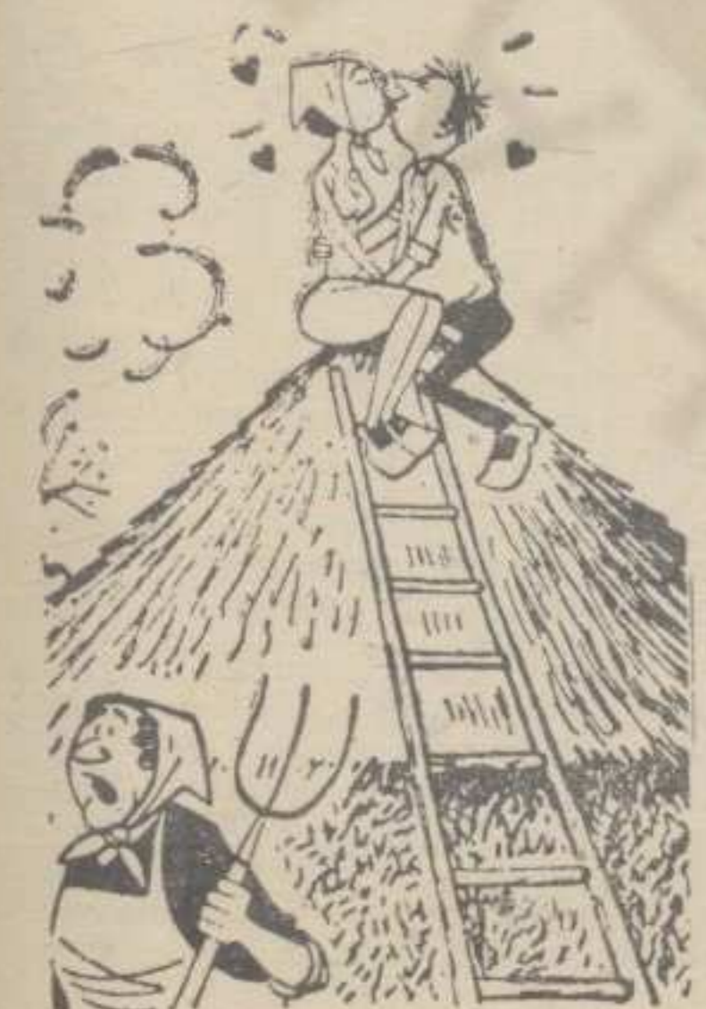
— А, јутрос ми је рекла да има састанак на врху?!