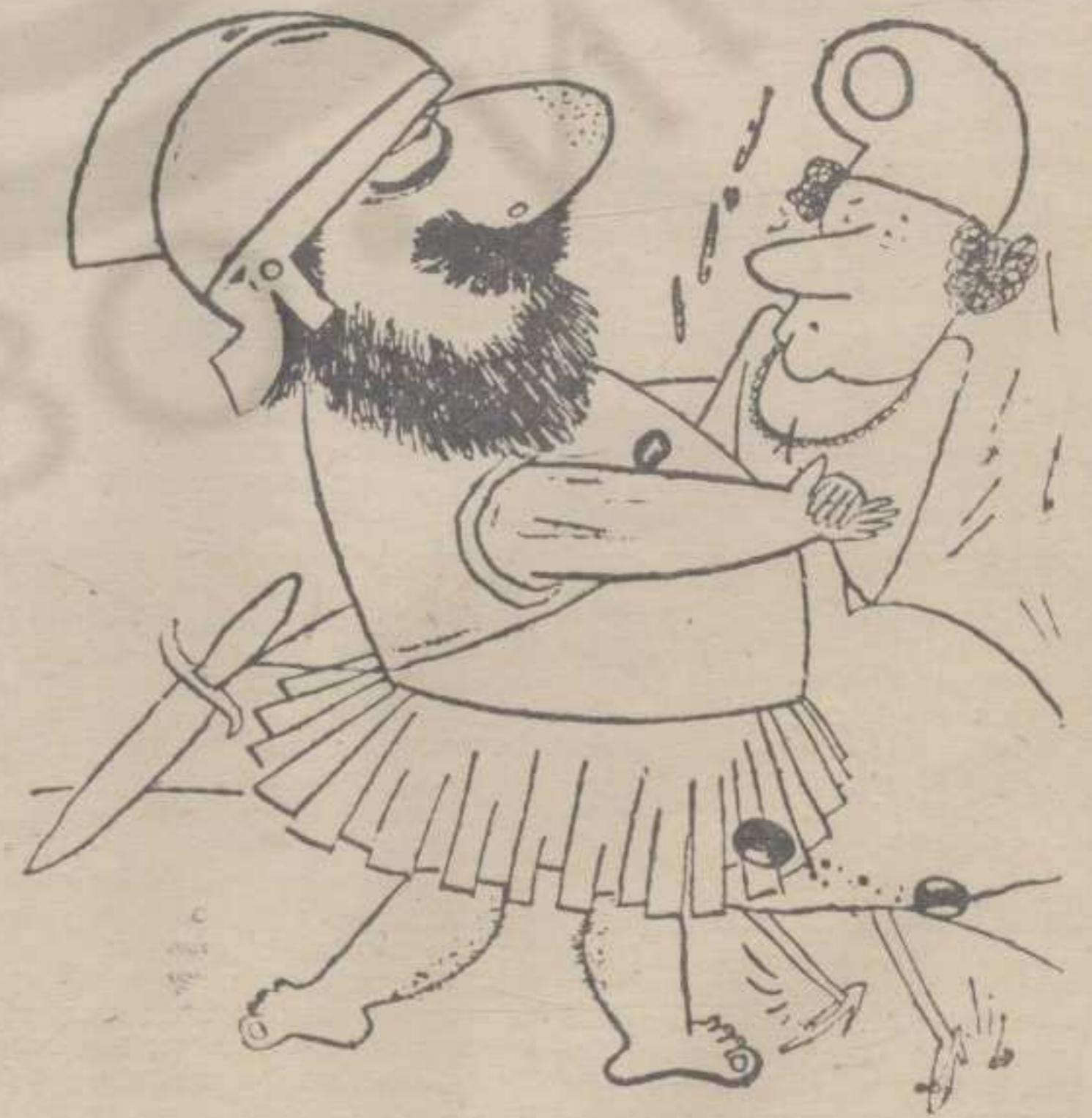
— Драги, наставаљемо!!!