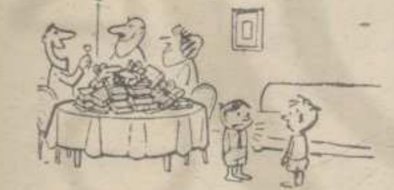
— Е, баш сам малер. Роџендан ми пада у »Месецу књиге«.