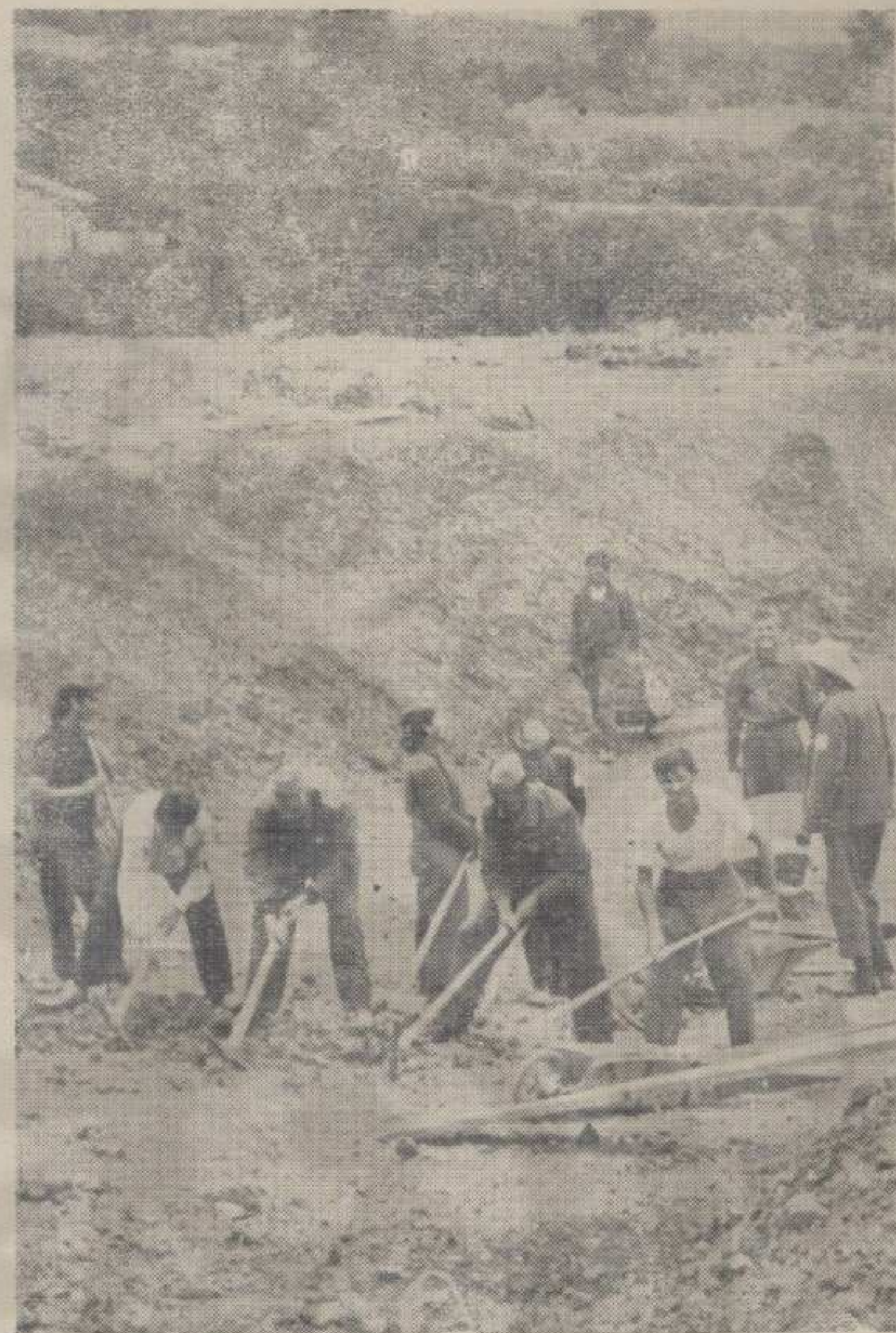
СУНЦЕ И КУБИЦИ — Омладинци прве смене

Песма тад почне да одзвања падином... Песма, она широка, сетна, велика и пространа као Пештер