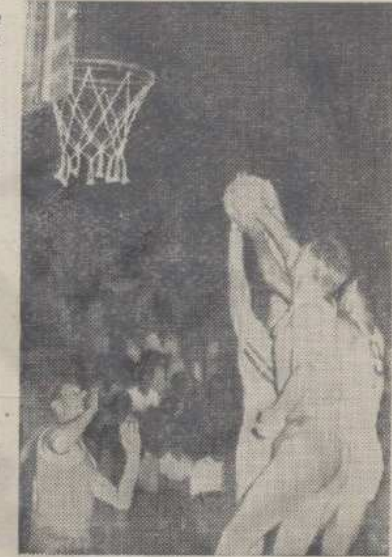
ИГРА ИСПОД ПРОСЕКА