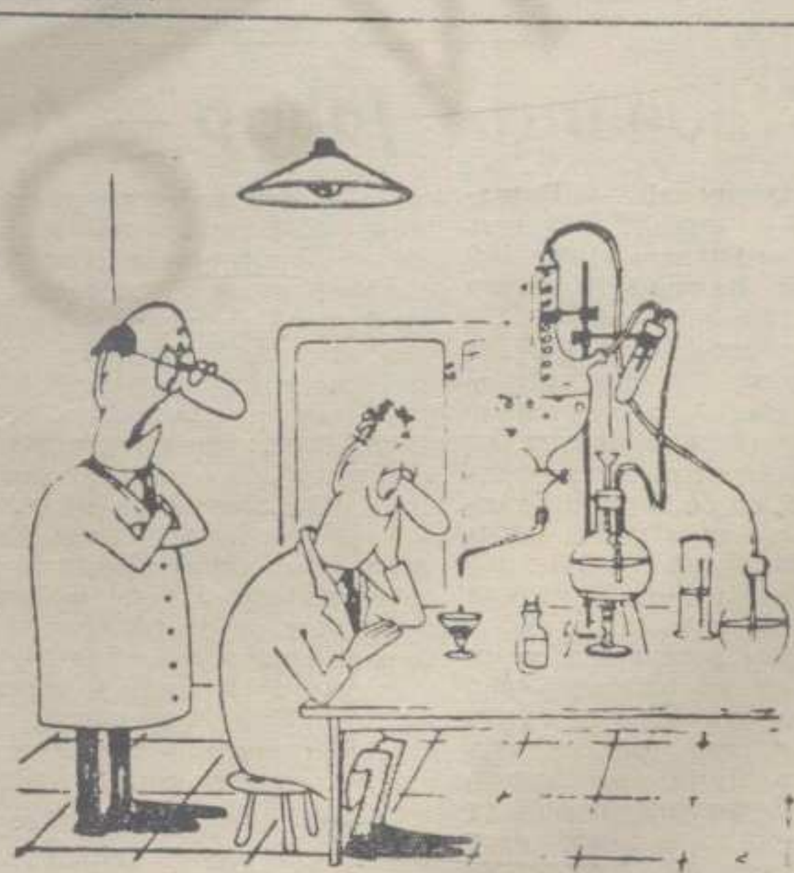
— Плаћамо вас за нуклеарна истраживања, а ви печете ракију!