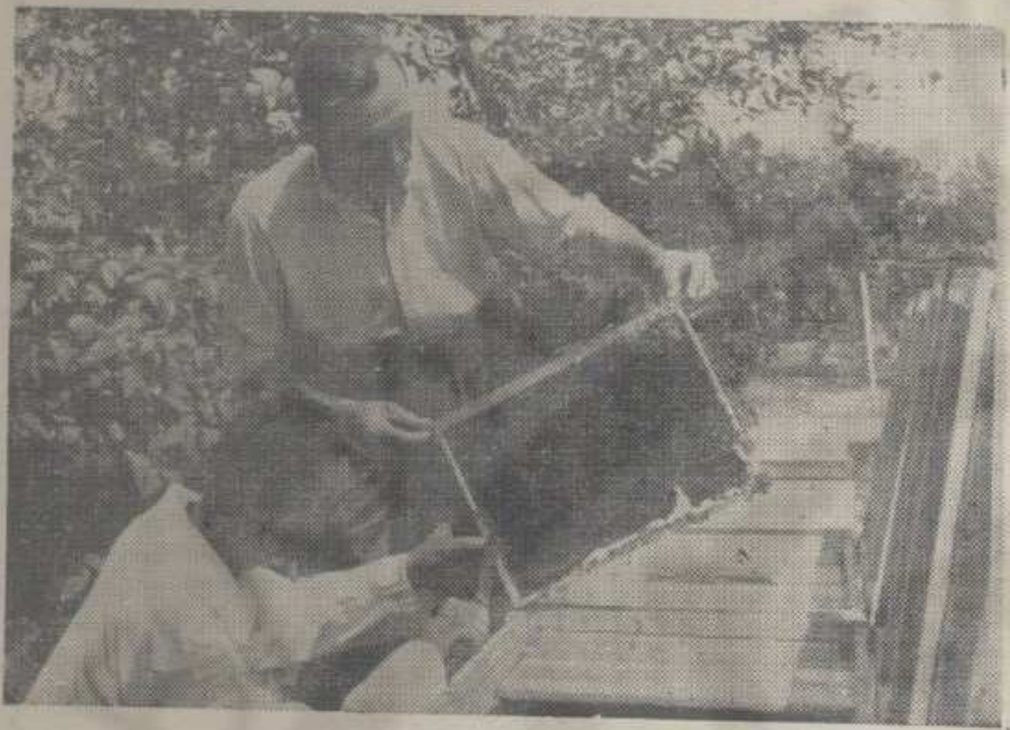
МОЖДА И СЕКЦИЈА ПЧЕЛАРСТВА

борима утврђен је број месних организација и подружница. Али, које секције формирати у месним организацијама и када, једно је од најчешћих питања у практичном раду активиста. У тежњи да формирање секција не добије шематски карактер, у неким организацијама постоји мишљење да не треба журити са њиховим формирањем.