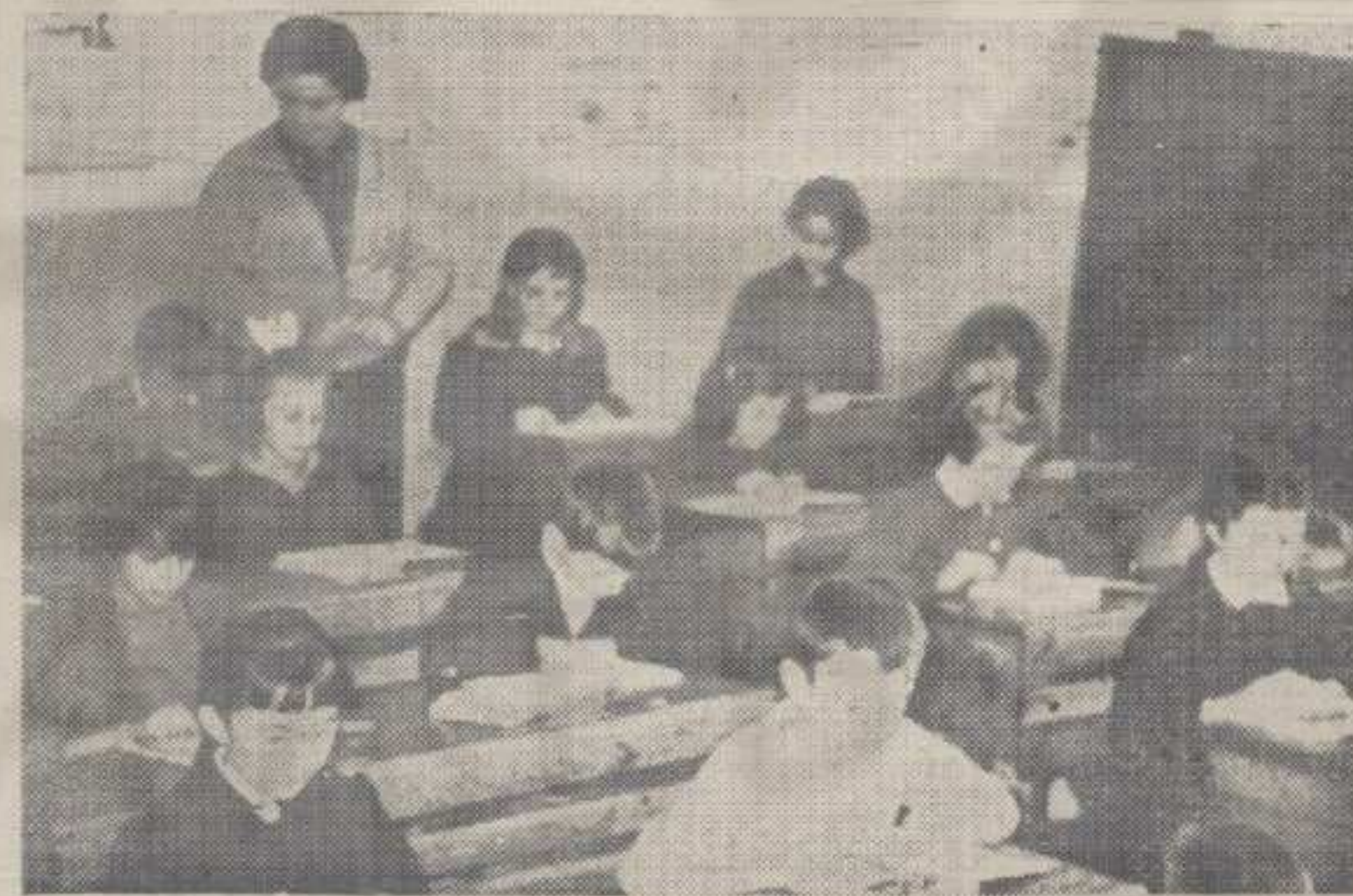
На првом часу

На територији општине Краљево почела је ових дана настава по свим школама. Од укупно 40 школа, колико их има у овој општини, најбољније су основне школе.