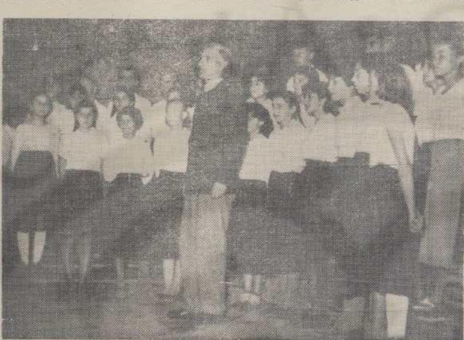
Хоће ли краљевчани наступити са хором или без њега?

чење по једног интерпретатора на родне, забавне и озбиљне музике, као и по два инструменталиста. Градови нашег среза моћиће да се такмичење представнике опште културе.