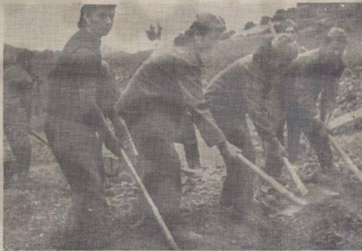
ЗА НОРМУ — Омладинке на раду