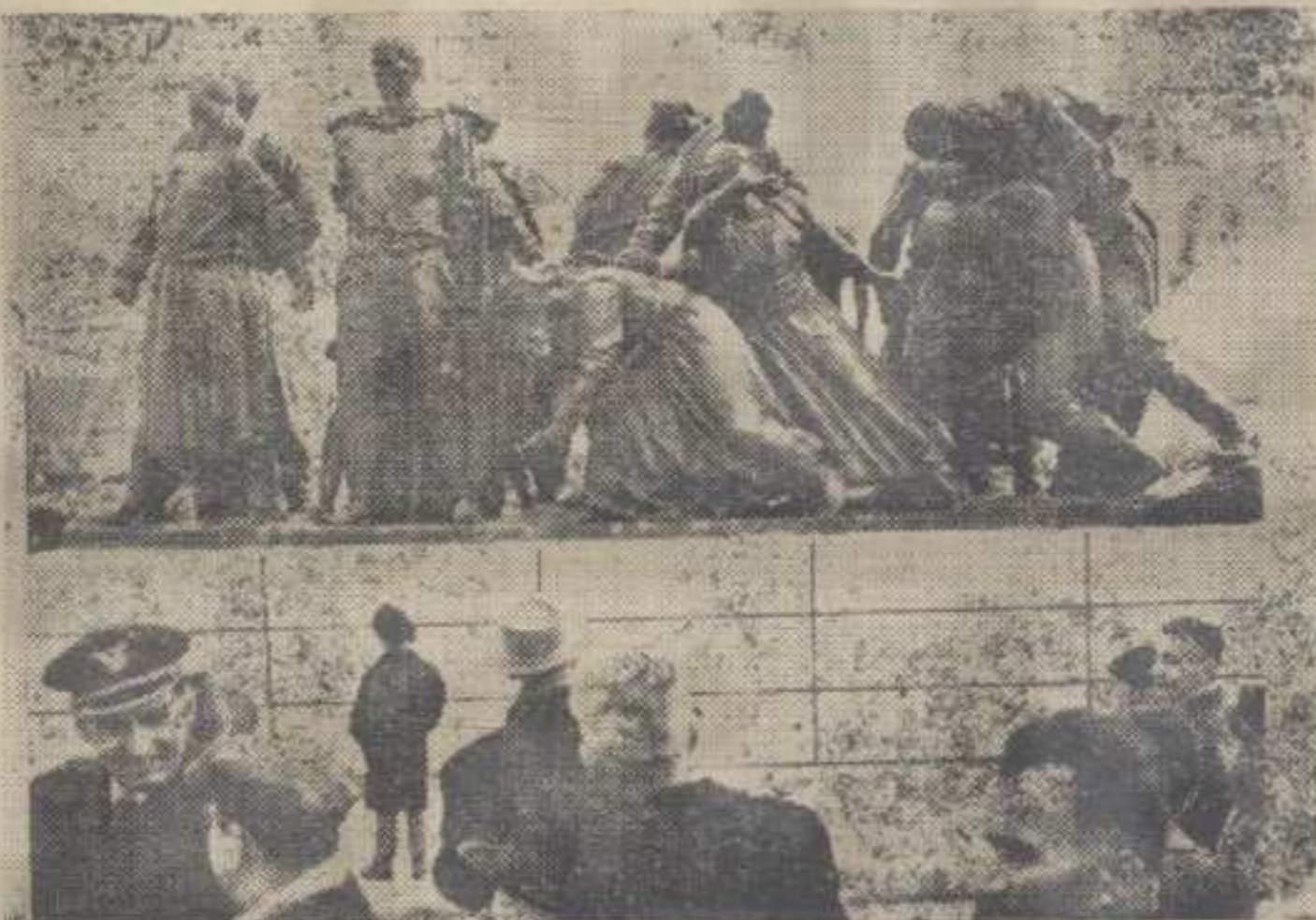
ОТКРИВАЊЕ СПОМЕНИКА «ОТПОРА И ПОВЕДЕ»

за учеснике Народноослободилачког рата, као и о деци и породицама палих бораца и жртава фашистичког терора. Помоћ у ловцу дата за ту сврху само од стране Народног одбора општине Краљево износила је око 15.000.000 динара. Од те суме Срески, Републички и Централни одбор Савеза бораца уложили су преко 4.000.000 динара. За последње две године знатну суму је уложила и Општина Нови Пазар. Остале општине такође нису изостале у материјалној помоћи општинским организацијама Савеза бораца.