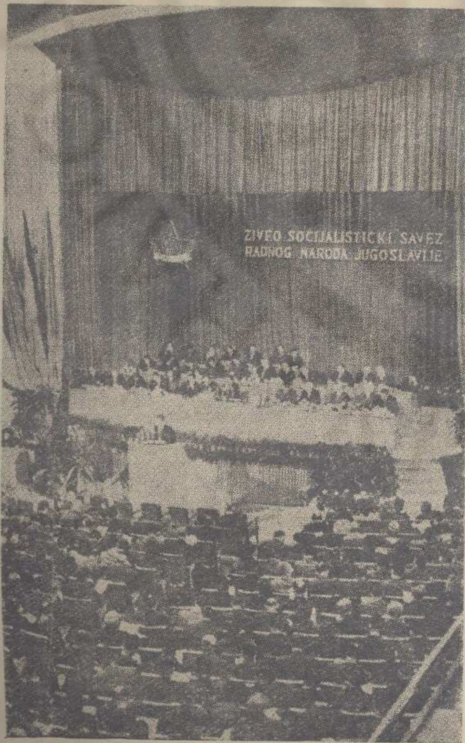
СА ОТВАРАЊА КОНГРЕСА

Никада још од Наполеона европска историја није видела тако челичну вољу. Никад још после својих херојских векова, европске религије нису познавале апостола такве гранитне вере. И што је најважније, никада људска делатност није стварала власника и господара људи коме су апсолутно били туђи лични интереси. Још за живота он је излио своју моралну фигуру од бронзе, која баца изазов вековима.»