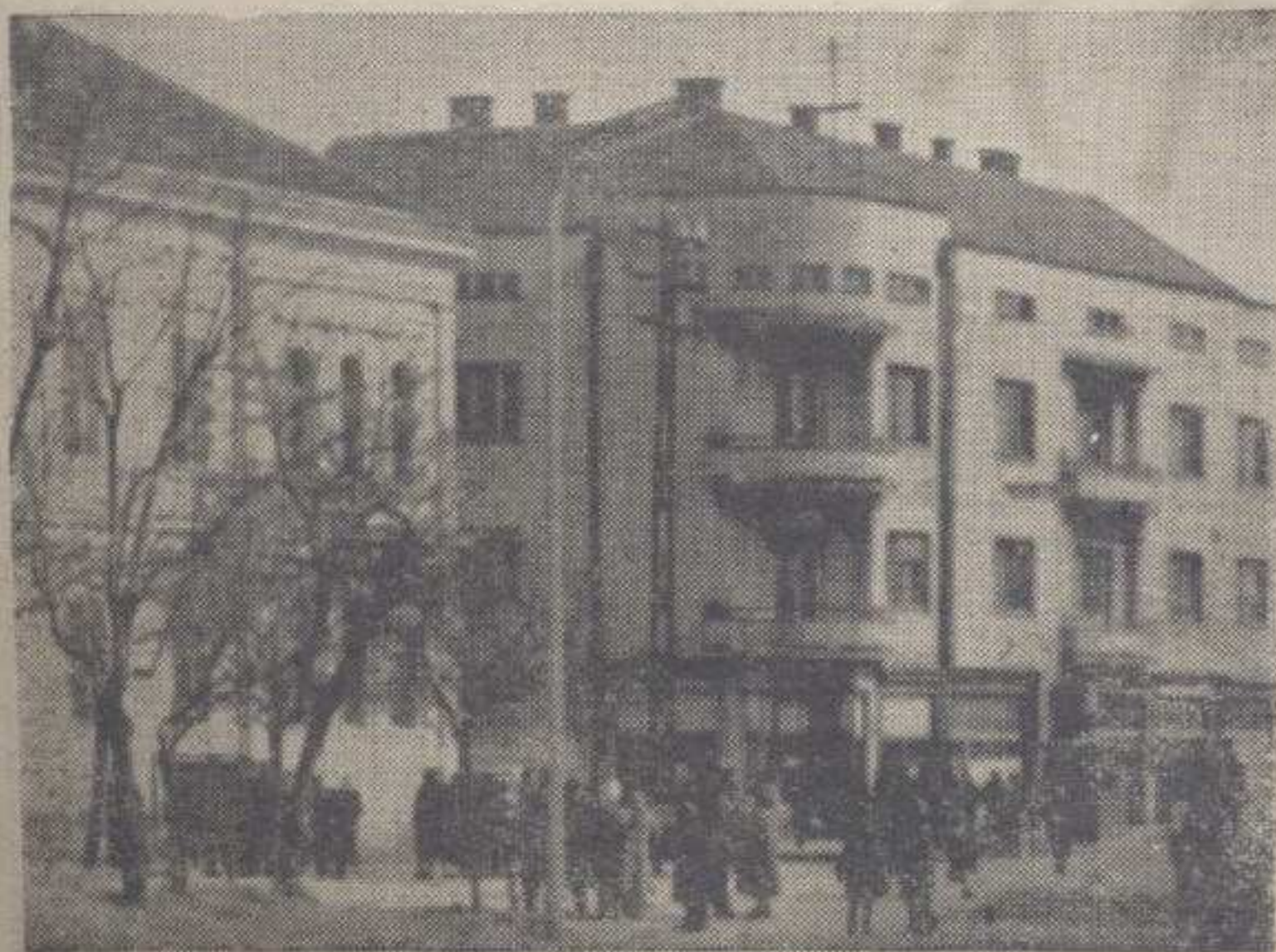
ВГРАДА НО СРЕЗА КРАЉЕВО

Избори у суботу и недељу показују још једном оданост наших грађана социјализму и њиховом већу да ће се убудуће кроз комуналне заједнице најдоследније моћи преко својих представника, борити за бољи просперитет и нове победе у социјалистичкој изградњи.