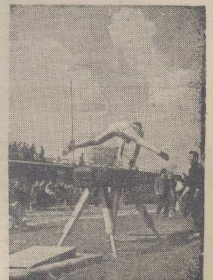
ДЕТАЉ СА ТРЕНИНГА