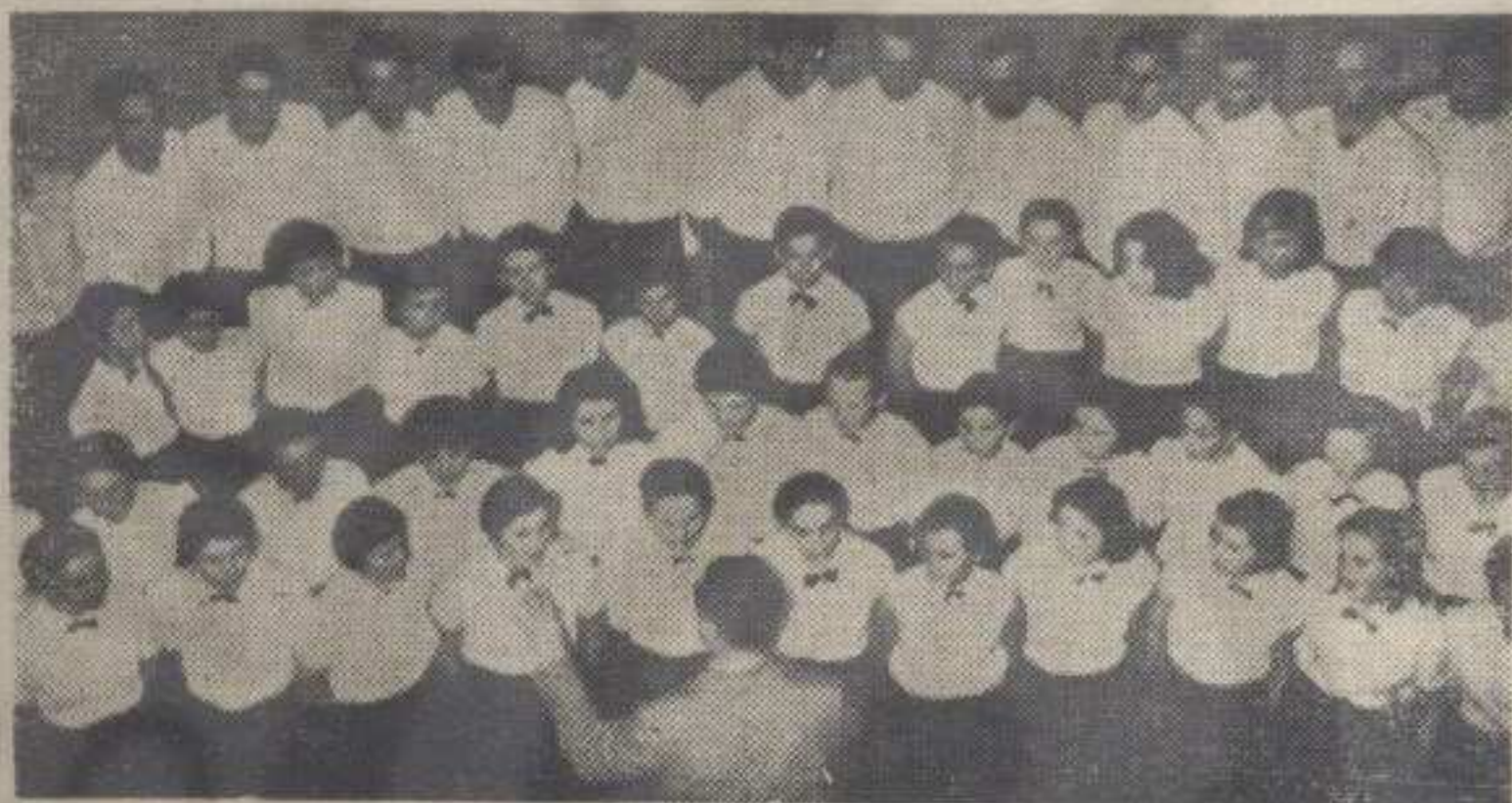
ХОР ИЗ ВРБЕ

У ТОКУ СМОТРЕ КУЛТУРНО-ПРОСВЕТНА И УМЕТНИЧКА ДРУШТАВА НА ТЕРИТОРИЈИ НАШЕ ОПШТИНЕ ОКУПИЛА СУ НАЈВЕЋИ БРОЈ СВОЈИХ ЧЛАНОВА У РАДУ ПО ДРАМСКИМ СЕКЦИЈАМА. НЕШТО ВЕЋИ БРОЈ ЧЛАНОВА БИО ЈЕ ОКУПЉЕН У СЕКЦИЈАМА ИНСТРУМЕНТАЛИСТА И ПЕВАЧА НАРОДНЕ И ЗАБАВНЕ МУЗИКЕ. ФОЛКЛОРНЕ СЕКЦИЈЕ ИМАЛЕ СУ ВИДАН БРОЈ СВОЈИХ ЧЛАНОВА, ДОК СУ РЕЦИТАТОРСКЕ СЕКЦИЈЕ БИЛЕ НАЈМАЛОБРОЈНИЈЕ. НА СМОТРИ ЈЕ БИЛА ЈЕДИНО ЗАСТУПЉЕНА ХОРСКА СЕКЦИЈА КУЛТУРНО-ПРОСВЕТНОГ ДРУШТВА »IV КРАЉЕВАЧКИ БАТАЉОН« ИЗ ВРБЕ. КУЛТУРНО УМЕТНИЧКО ДРУШТВО »АБРАШЕВИЋ« ИЗ КРАЉЕВА НАСТУПИЛО ЈЕ СА ОРКЕСТРОМ ВЕЛИКОГ САСТАВА И ЦЕЗОМ.