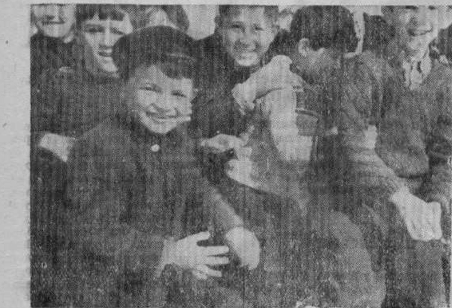
За време одмора између часова

После дискусије изабрано је ново руководство и секретаријат омладинске организације.