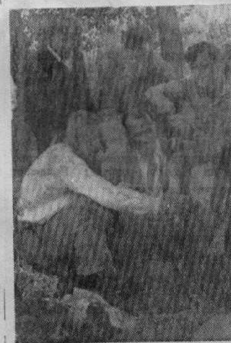
Са недавног излета у Врби

Срећки ловачки савез у Краљеву одмах је приступио извршењу овог задатка, те је уз сарадњу Института за научна истраживања у ловству ФНРЈ и ветеринарске службе изврши отстрел зечева у свим ловиштима. Том приликом констатовано је