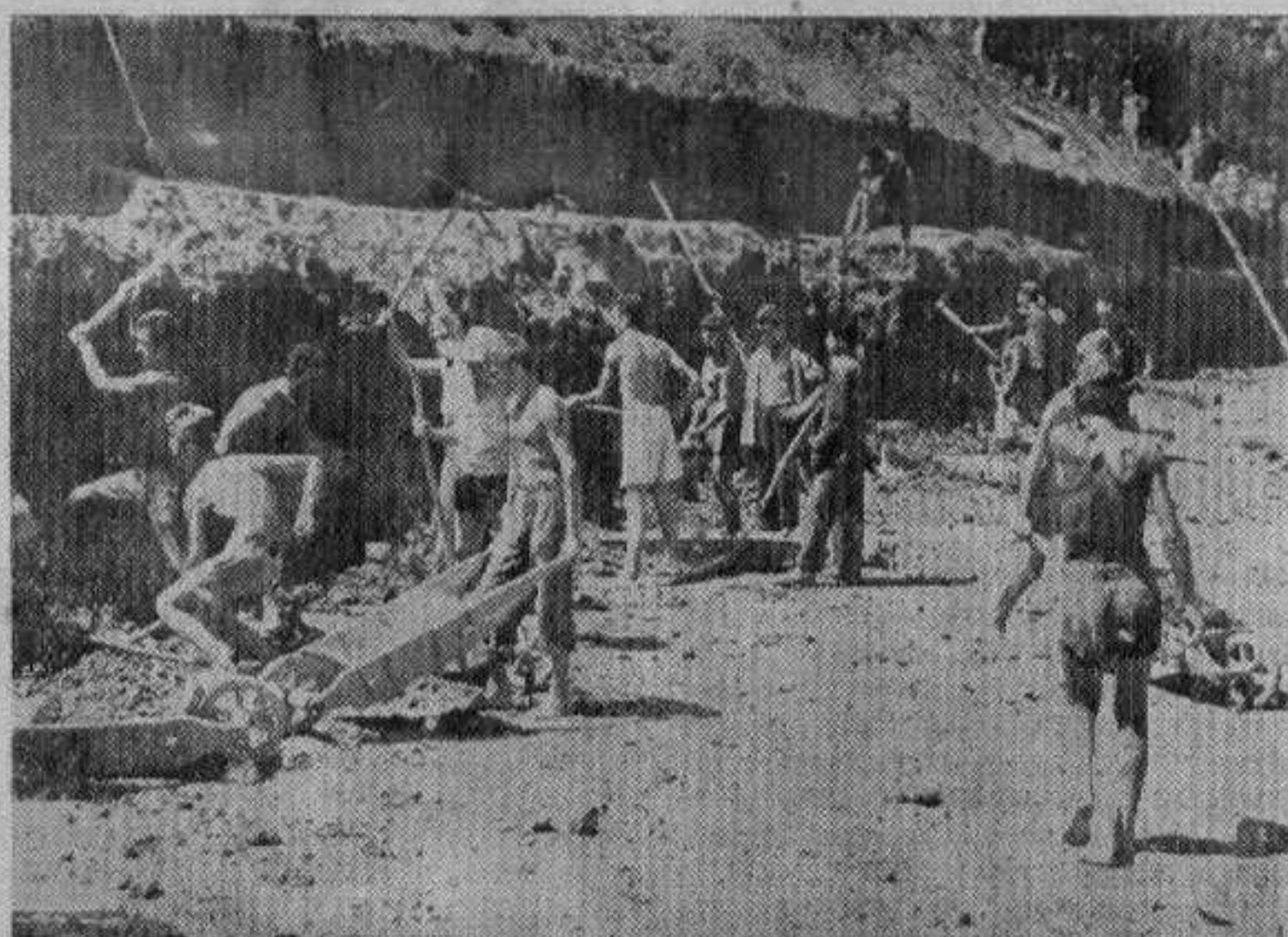
За време рада на траси

По руку нам је дошло писмо једног малог бригадисте, који сељаци (Наставак на другој страни)