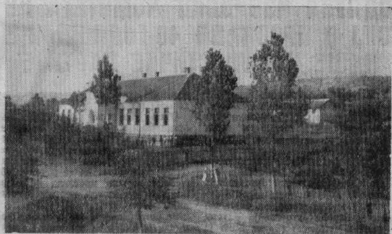
Школа у Витковцу

Бачка задруга ове школе има производни карактер ратарско-живинар