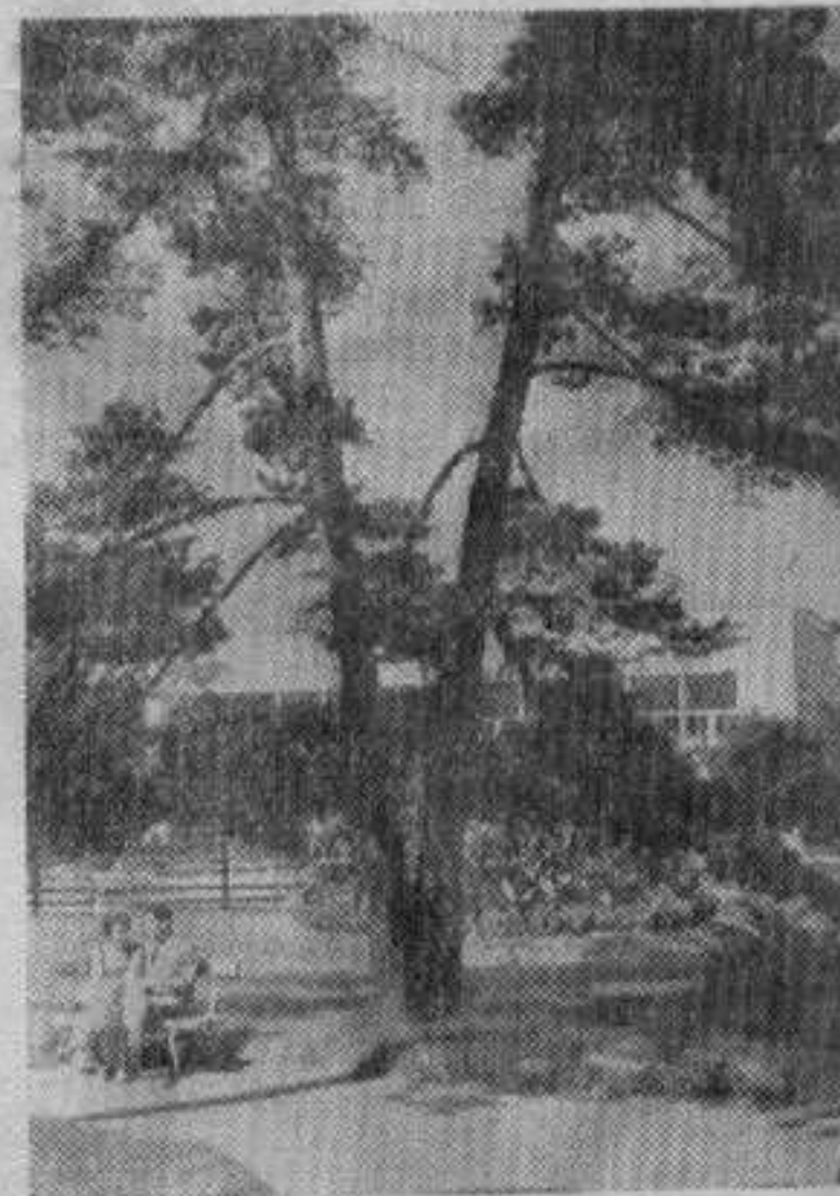
Врњачка Бања после 50 година

Пошла сам поново у Врњачку Бању. Те године сам лутајући по околној долини на једно удубљење у стенама где је извирала вода. Проба да сам је и осетила њен кисели укус. О томе сам обавестила тадашњег управника бање који ми је дао раднишце и ја сам на месту где се сада налазе извори хладне киселе воде „Снежник“ подигла прву спомен чесму о своме трошку. Овај датум обедежили смо скромном свечаношћу покрај самог извора, а једна успомена из тога доба је фотографија, коју сам предала Управи бањског лечилишта за музеј. Од тада, редовно сваке године, углавном на завршетку сезоне, посећујем Врњачку Бању. Имам осећај да после лечења у овој бањи, све иде како треба, не осећам већ дуже година никакве болове.