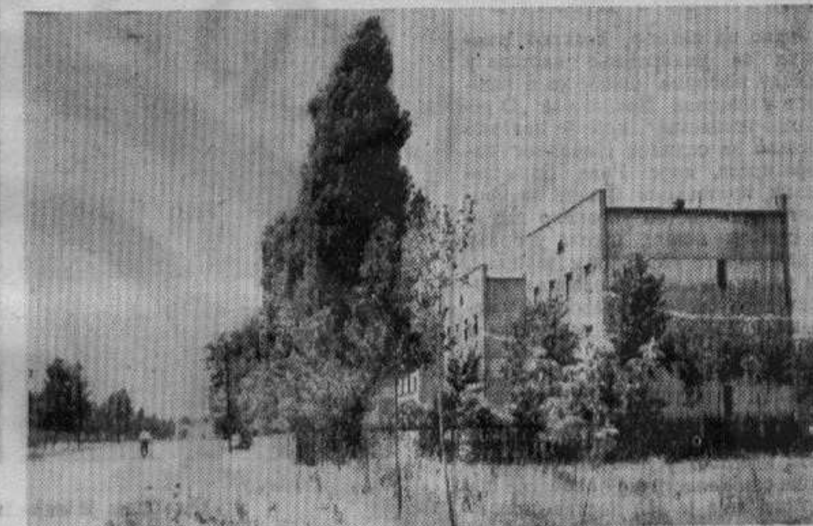
Станбени блок у улици Бориса Кидрича

мном месту 67 милијарди дина. друштвених средстава за станбено-комуналну изградњу у 1958. години. У 1957. години за ту сврху било је спре-