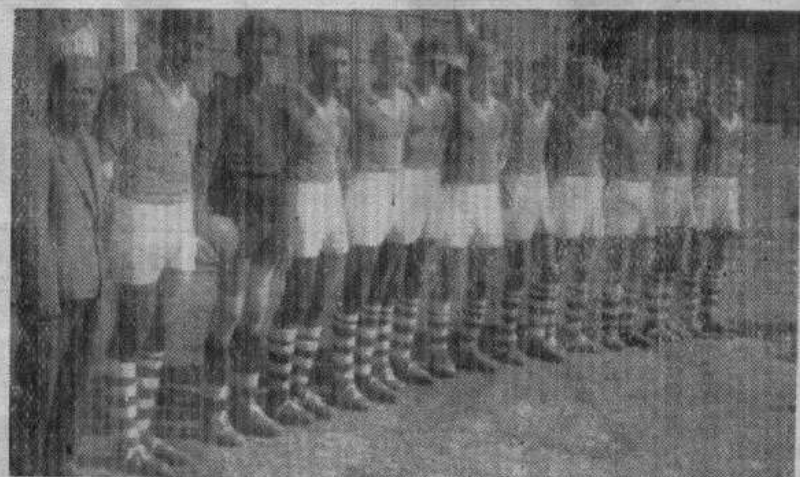
Изгубљени бодови на свом терену: Карађорђе

Стање у коме се клуб налази лоше је и ничему добром не води па би требало нешто учинити да ова спортска грана не ниште на са српског спортова нашег града. Уколико меродавни нешто предузму можемо се ускоро надати новим победама боксера.