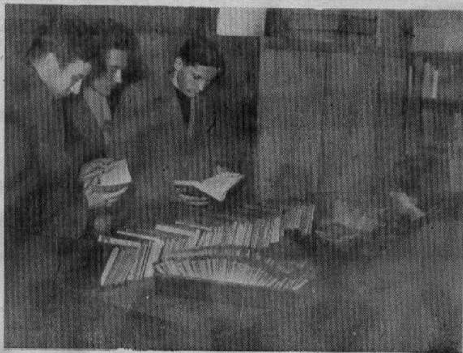
Омладина је највећи љубитељ књига

Да може, али само површно. Ухватиће се фабула, али оно што је битно и од стварне вредности остаће незапажено. Отуда и саму вредност тако јасне и прете жироде књижевности могу у потпуности открити и уживати је само они који су, разним путевима, развили своја естетска осећања