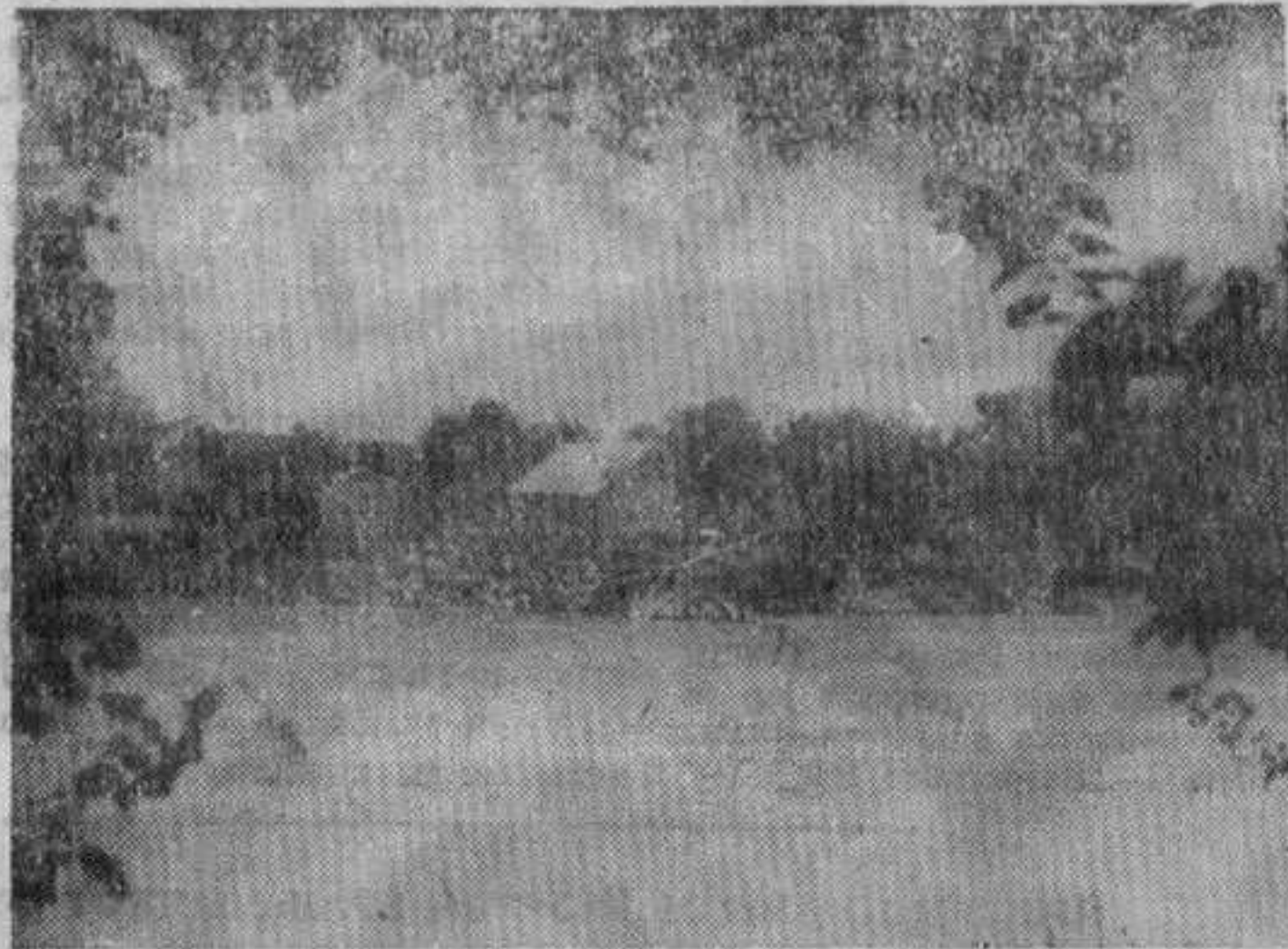
Воденица на Ибру код Матарушке Бање

Ибра. После само једне године њиховог рада, опасност је постала тако очигледна, због рушења десне обале, коју нису могле да заштите ни дебеле старе тополе, да се морало нешто хитно предузети како би се спречила