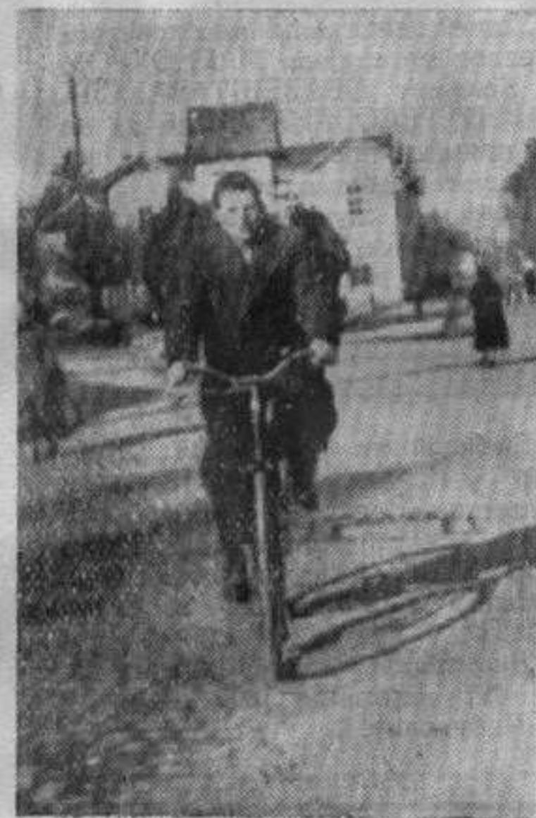
Један од Врњачких рекордера