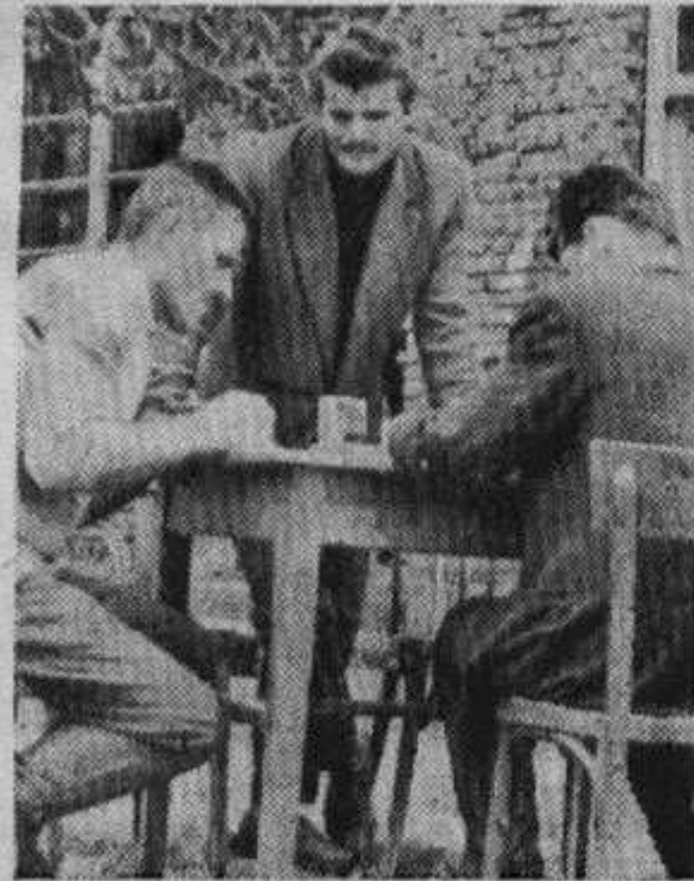
Потписивање уговора о кооперацији у Лађевцима

— Сетву треба обавити обавезно сејалцом и то на дубини од 4—5