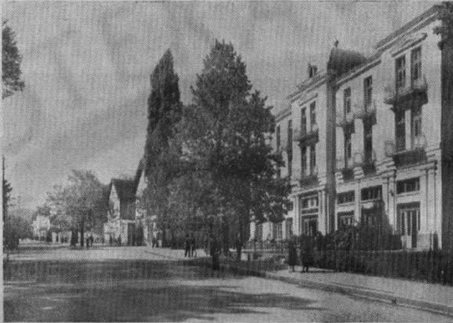
Врњачка Бања — Главна улица