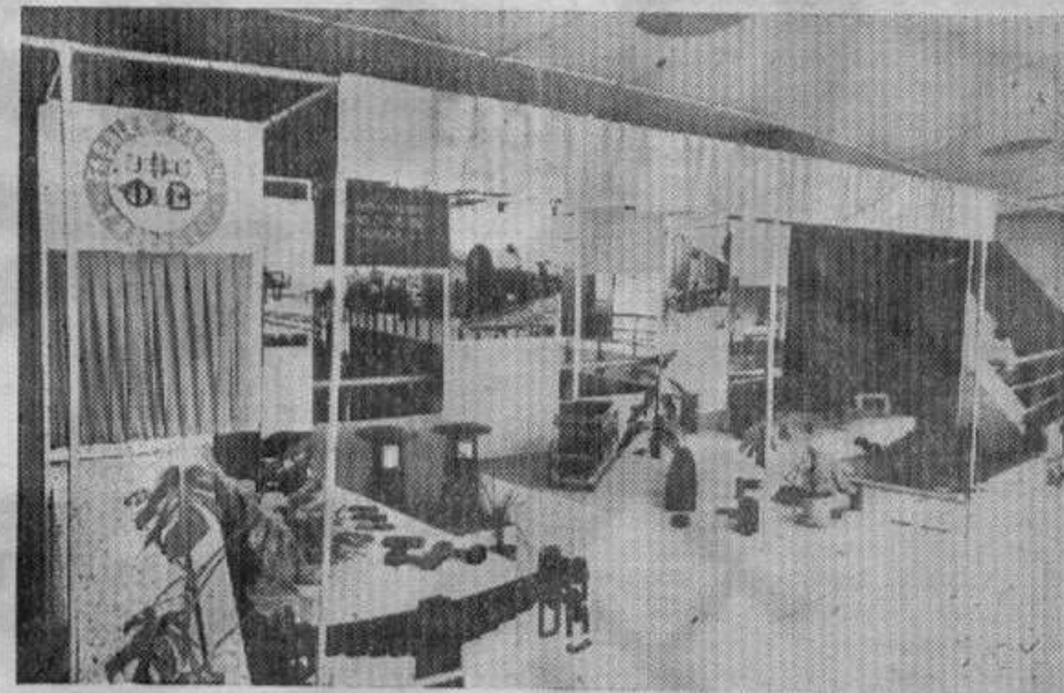
Изложени производи Фабрике вагона на сајму

Иначе, Фабрика вагона излагала је ове године своје производе на проле-