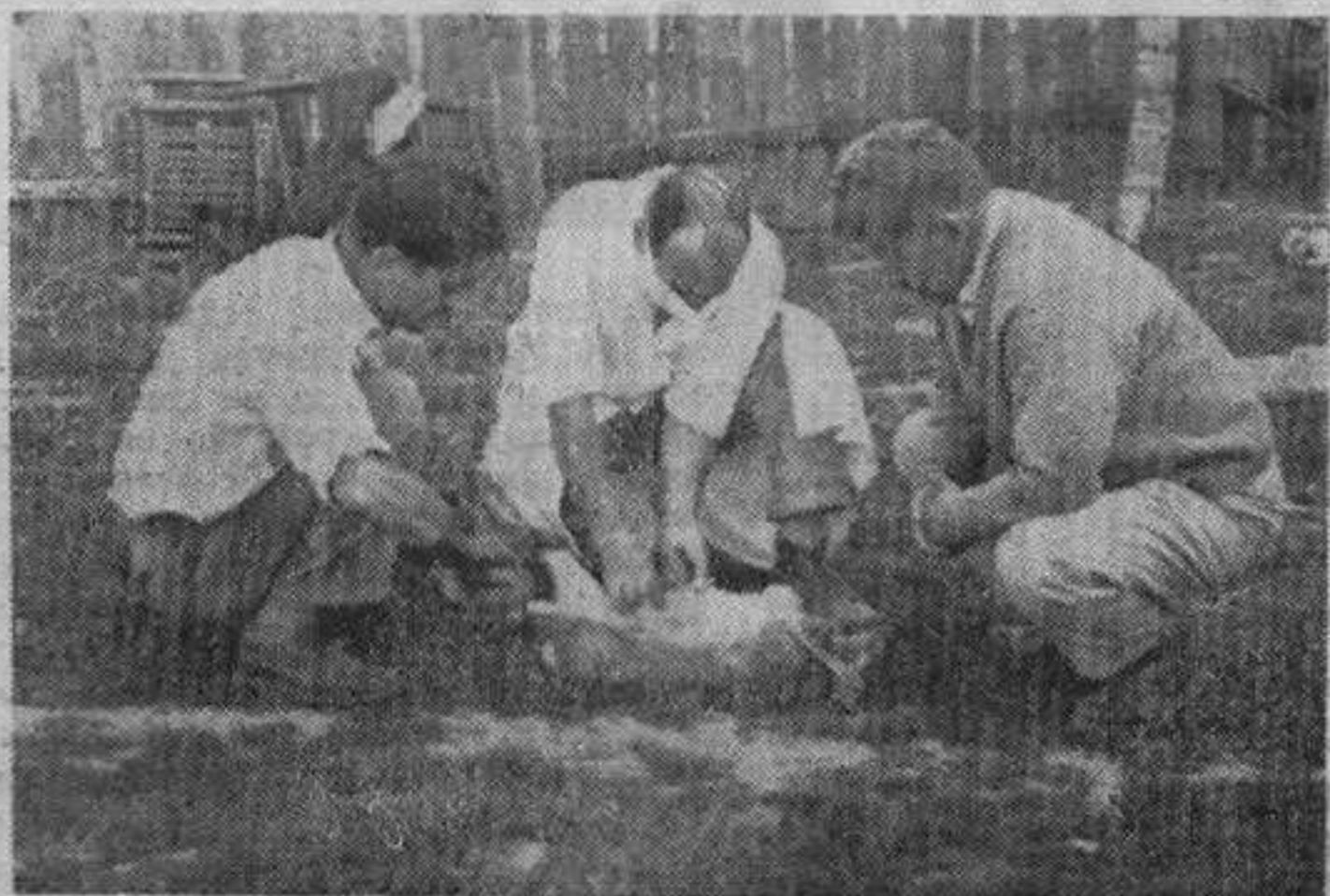
Ветеринарски преглед уловљеног зеца