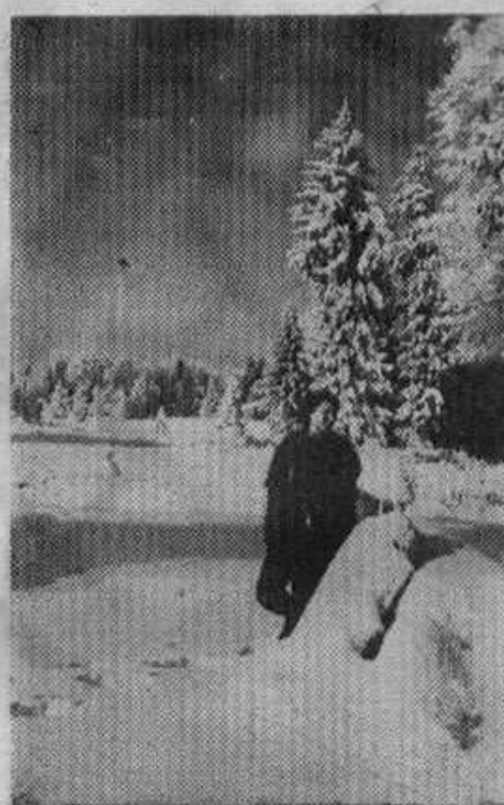
Зимски мотив са Копаоника

Занимљиво је да је бригада у својој деценији добила назив ударна, а поред тога и похваљена је као најбоља на траси.