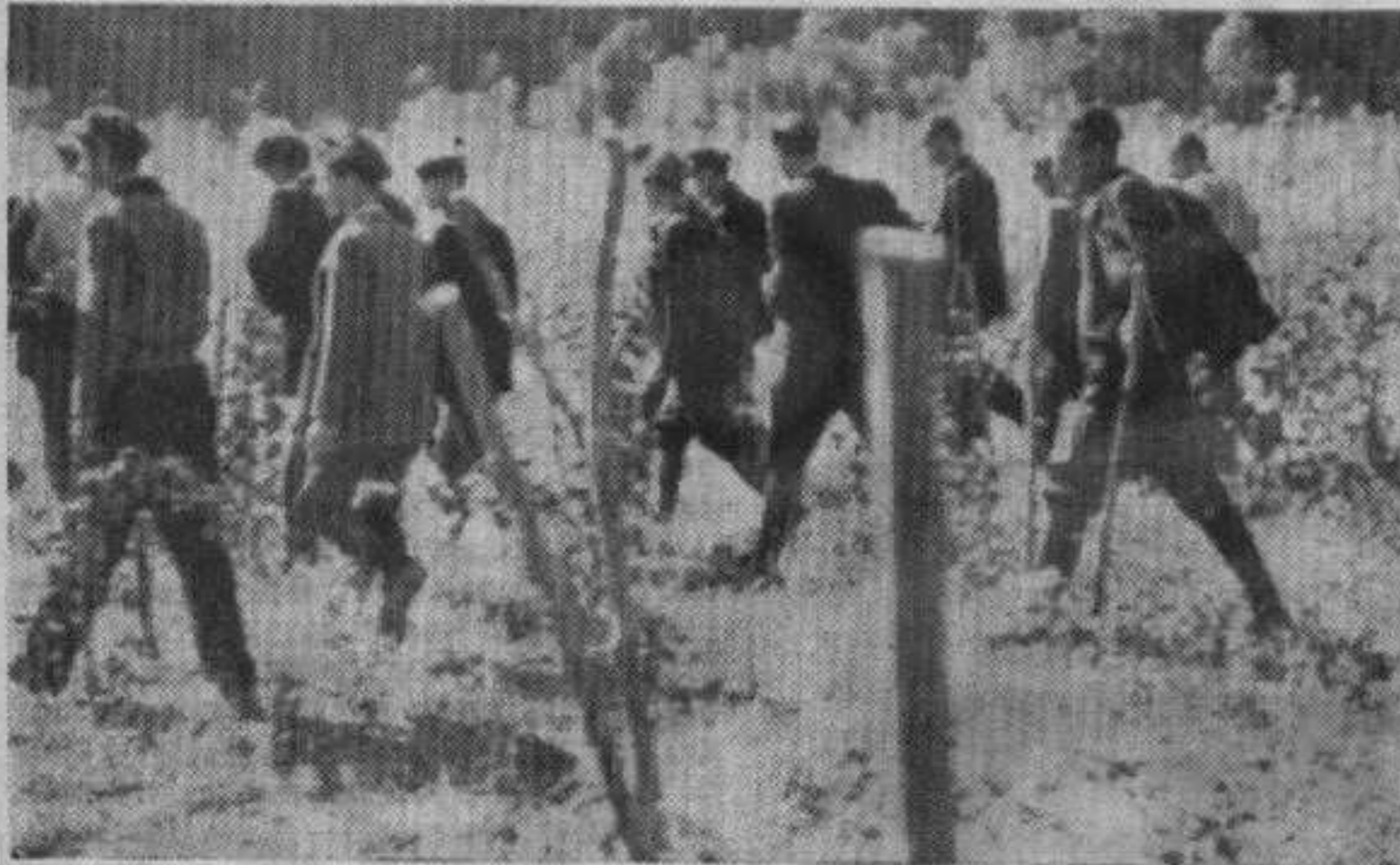
На плантажним воћњацима

Ведрa расположења воћари из комуне Богutowaц вратили су се обогаћени знањем, да је њихова будућност у напредном плантажном во-