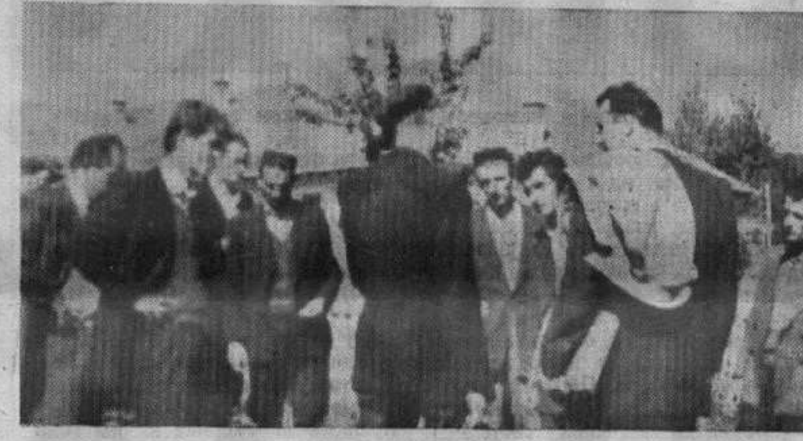
Свако је имао понешто да упита