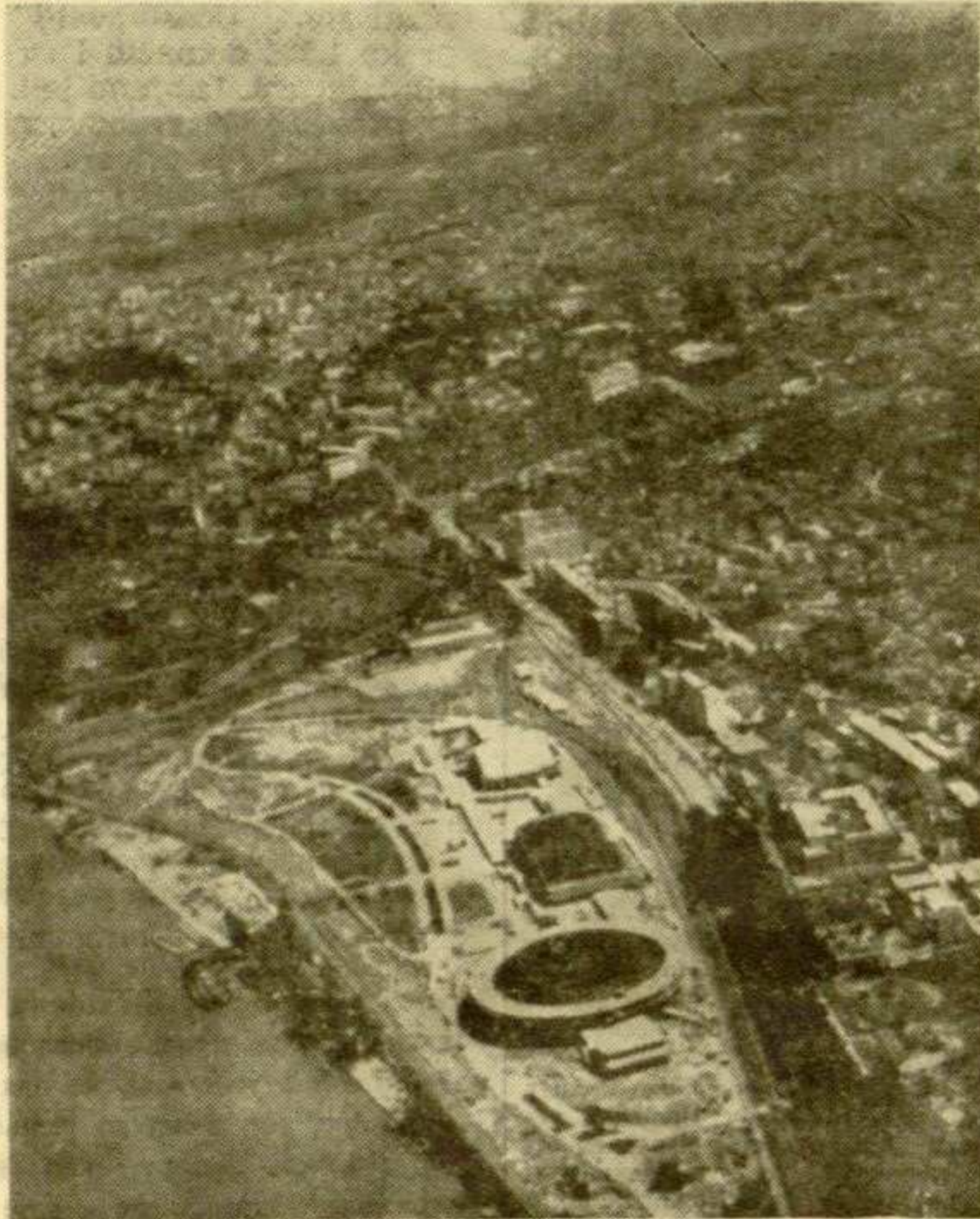
ПОГЛЕД НА САЈМИШТЕ: (снимак из авиона)