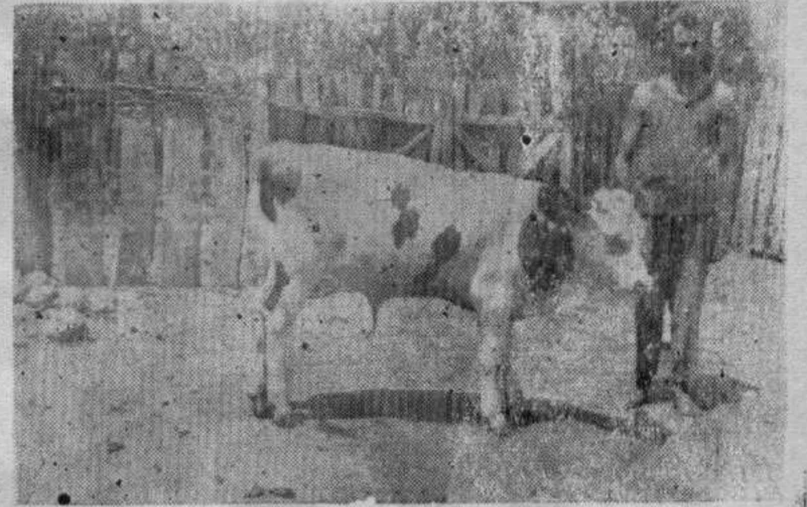
Добри резултати вештачког осемењавања крава

памћеној суши, многи су се пољопривредници уверили у предност доброг орања.