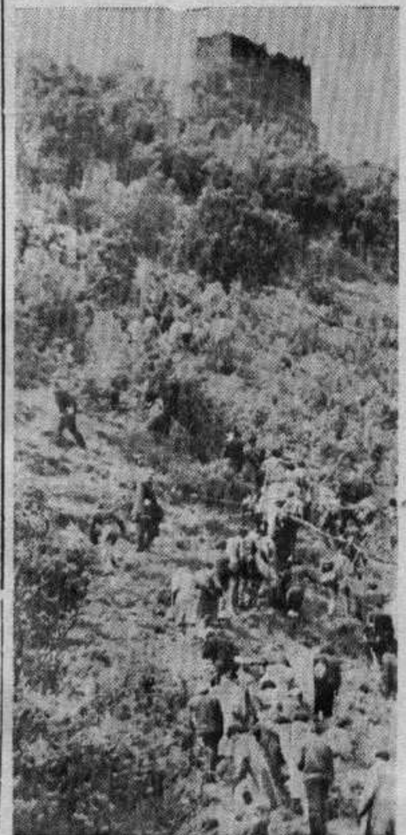
Поход на Маглич

ки феријалци учинили. На тим путовањима учествовало је 472 члана феријалног савеза из Краљево. Поред тога 130 феријалаца провело је летовање на мору и другим познатим летовалиштима Југославије.