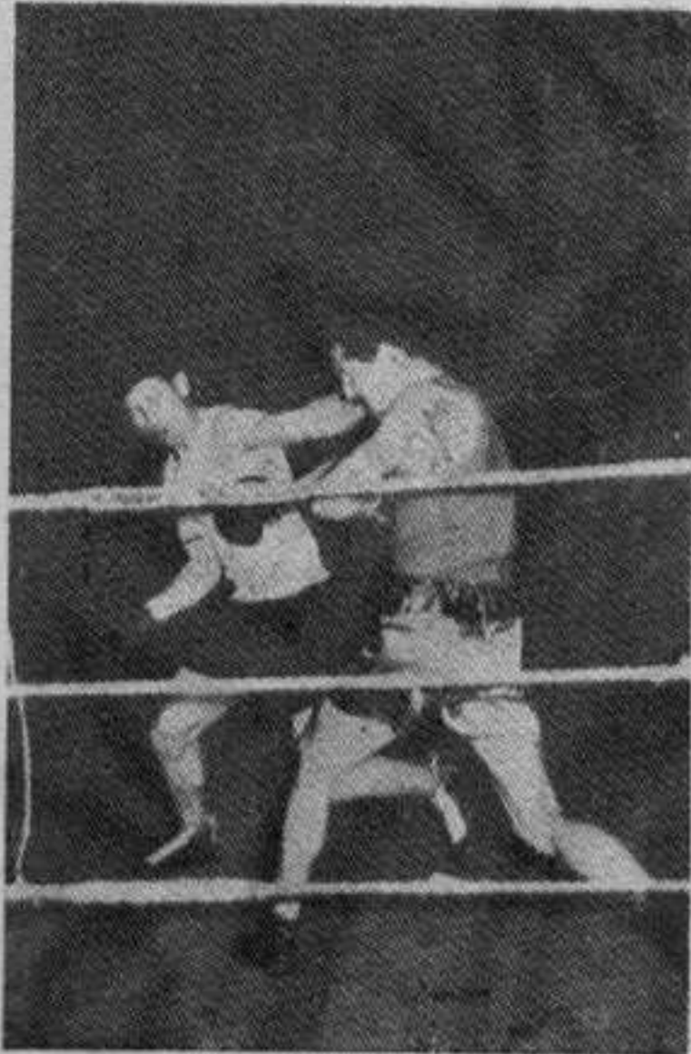
ХОЋЕ, НЕЋЕ: са једног боксмеча

ПРЕ ДЕСЕТ ДАНА, КАО И У СРЕДУ ВЕЧЕ, УПРАВА Б. К. ИБРА ОДРЖАЛА ЈЕ САСТАНАК И ПОКРЕНУЛА ПИТАЊЕ ОЖИВЉАВАЊЕ БОКСА У КРАЉЕВУ. Ова кратка информација нас је изненадила и наравно заголицала, јер смо били убеђени да боксерски спорт у нашем граду више не постоји.