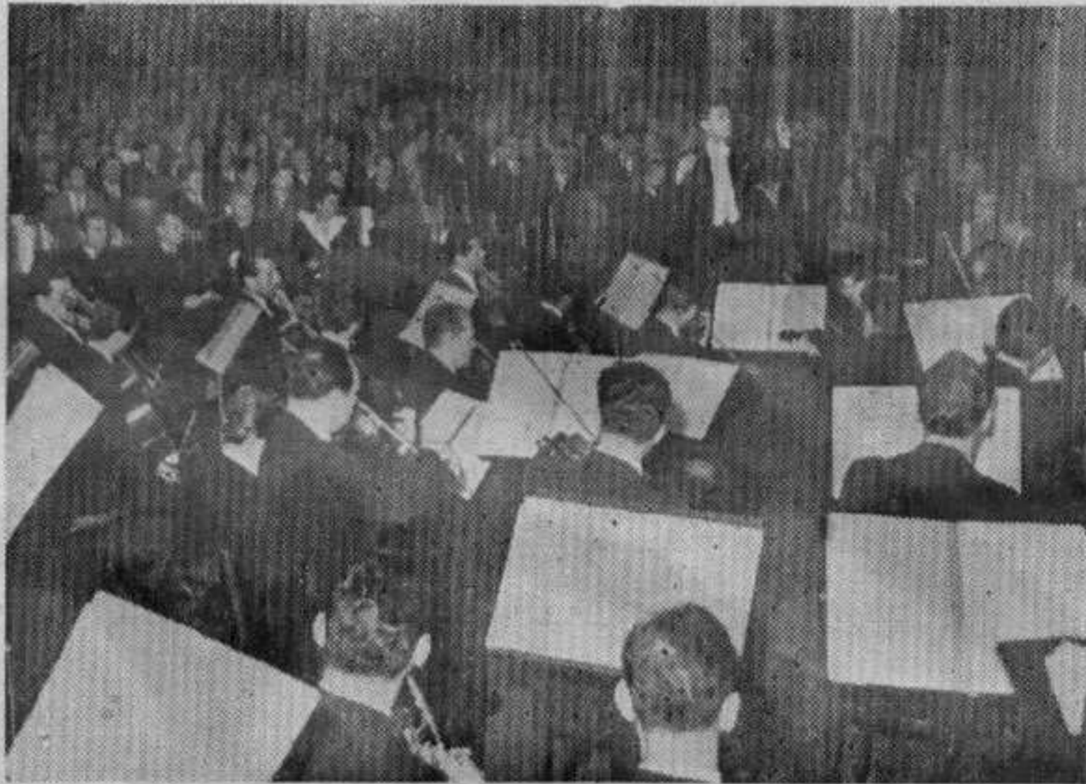
Оркестар Београдске филхармоније гостовања свакако овога лета у Краљеву

„Ми имамо такву каванску музику, која ствара негативне особине у нашем човеку, јер је њен квалитет