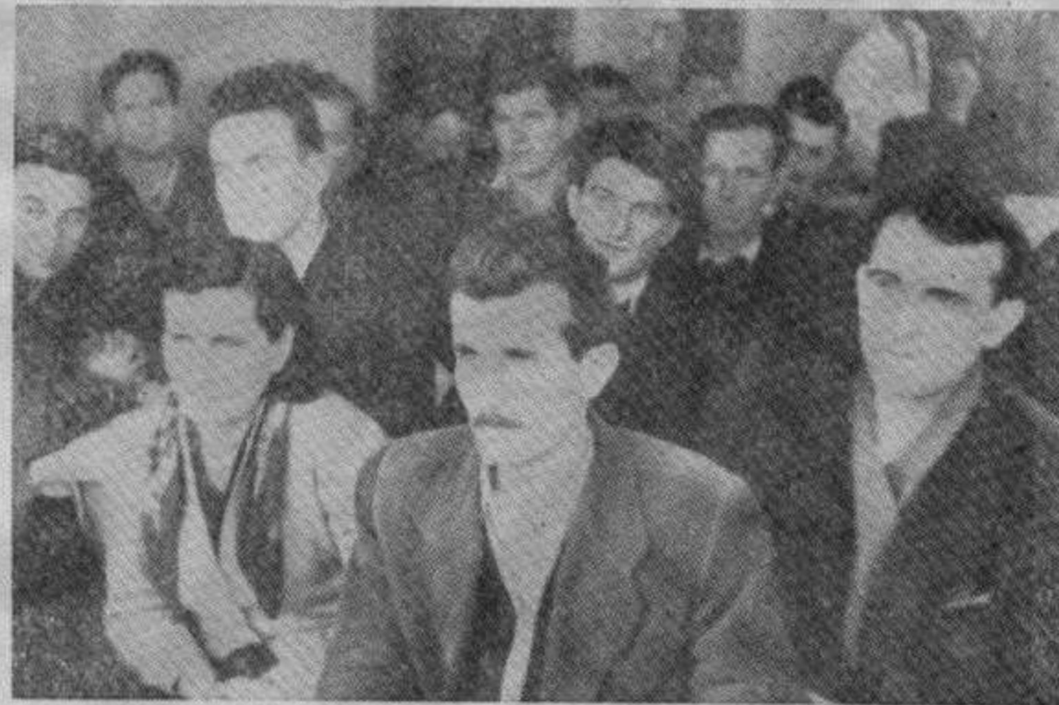
Са Среске кандидационе конференције у Конареву

лом селу — омећеном између Мораве и железничке пруге, иако је се ло прекрила прохладна зимска ноћ, излокви путеви нису остали без жи