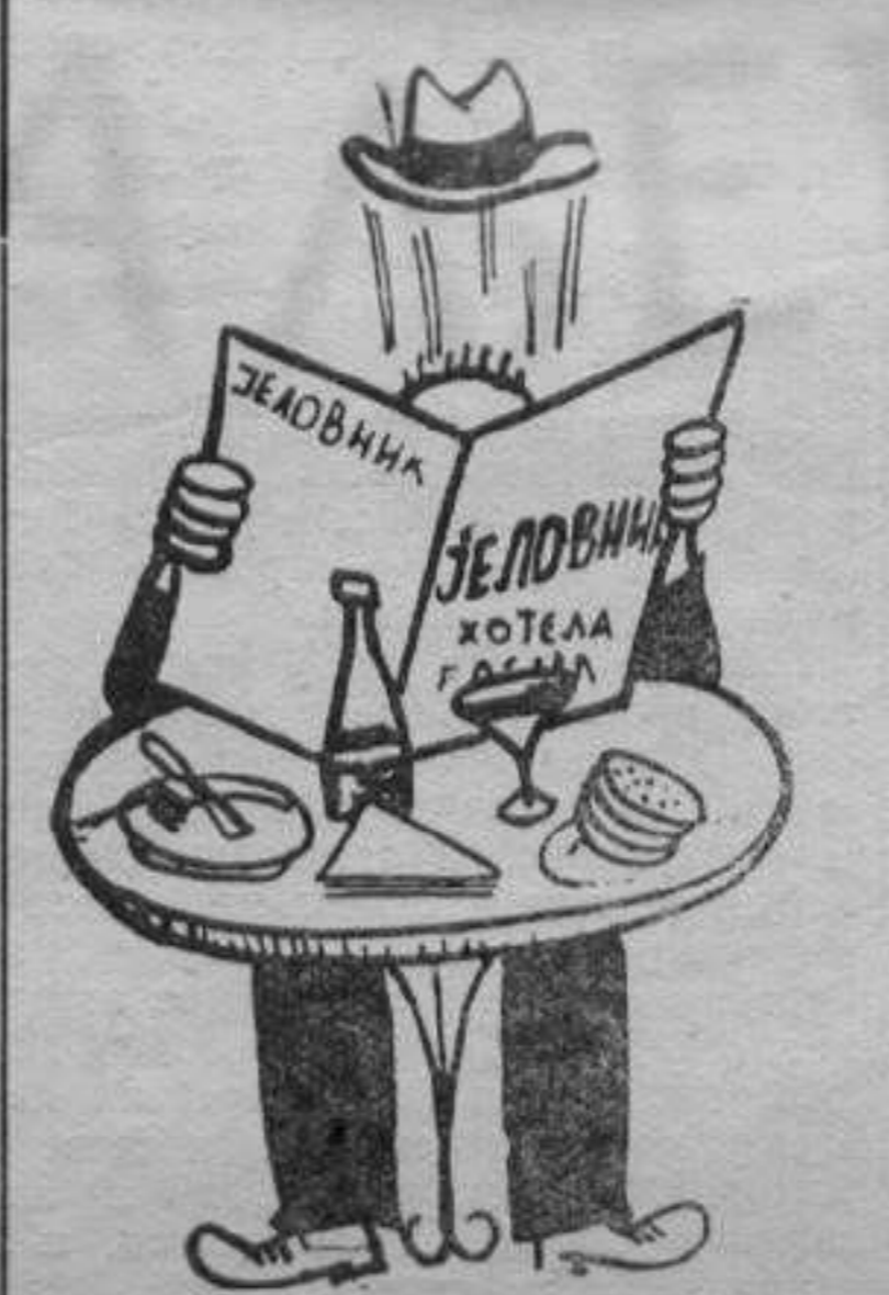
— Гле, пржена сова!