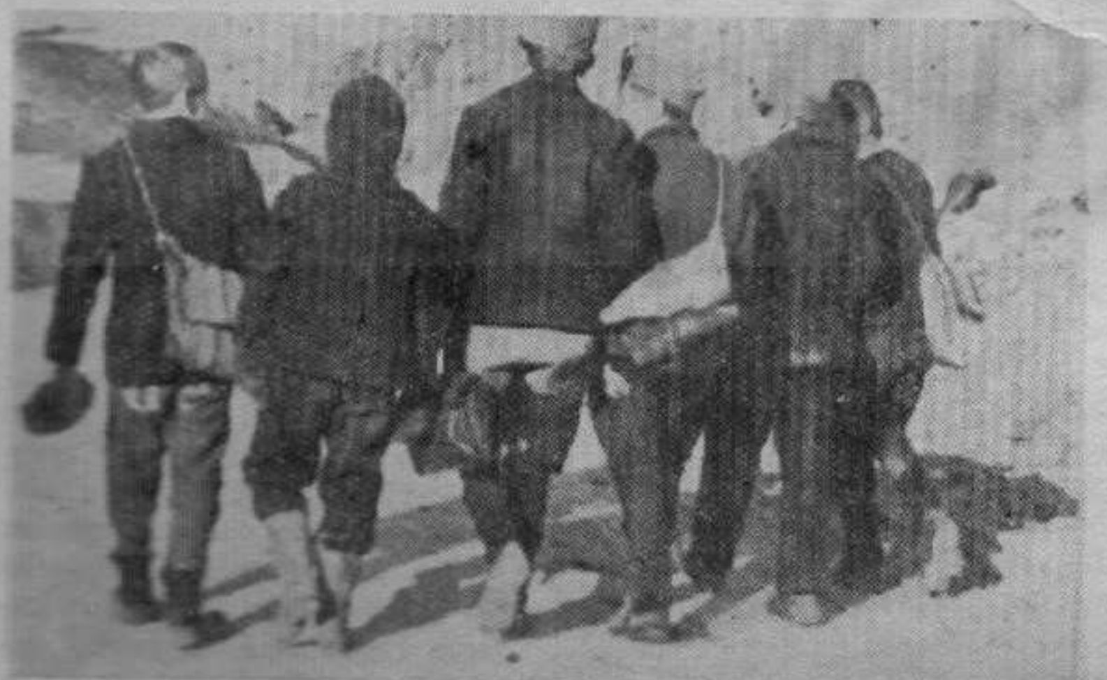
Привлачно је почело још онога дана када је звоно објавило крај првог часа и они кренули истим путем. Од тада, по сунцу, киши и снегу са планинских планина књига и хране свакодневна иде ова мала дружина.