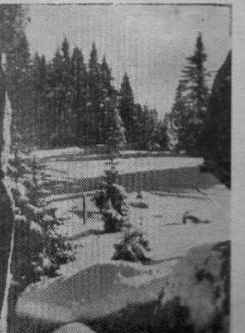
ВРЕМЕНА СЕ МЕНЈАЈУ. Нова је дошла зима, са снегом и радостима за децу али и са бригама за оне чије су задатке дрво и снег пре крају.