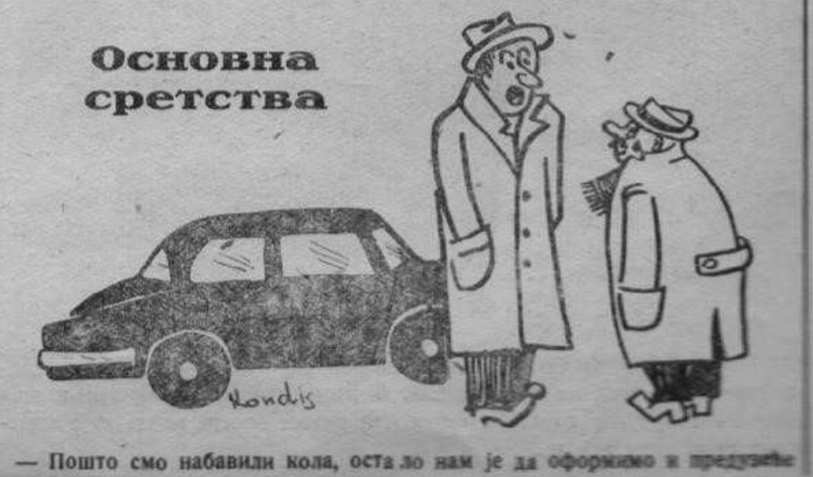
— Пошто смо набавили кола, остаје нам је да оформимо и предузеће