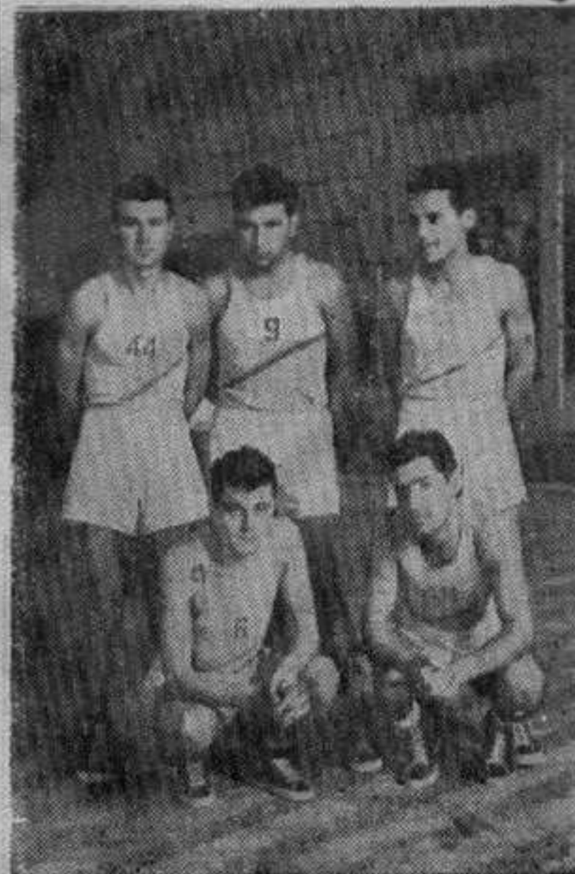
УСПОМЕНЕ: кошаркашка екипа Слоге која је освојила први куп Ђуприје

— Екипа је одређена и играће само девет играча. Више не можемо да поведемо, јер немамо средстава.