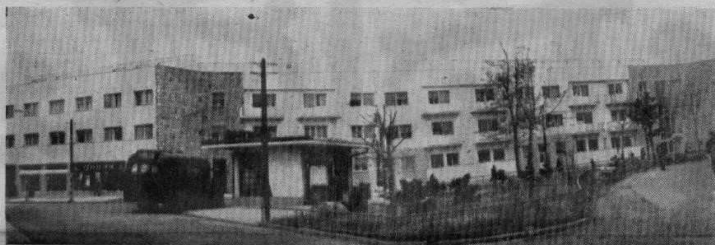
Нови станбени блок на Тргу ЈНА

Већ неколико месеци два локала у новим зградама у улици Октобарских жртава и на Тргу Југословенске народне армије стоје празни. „Лаугу“ је жуљна једна угледна продавница која не би била само то, већ у исто време и угледна изложбена просторија модерних пољопривредних справа, које су иначе сада смештене у шумама једне преко других, натрпане и неприступачне кућницама да их прегледају, виде