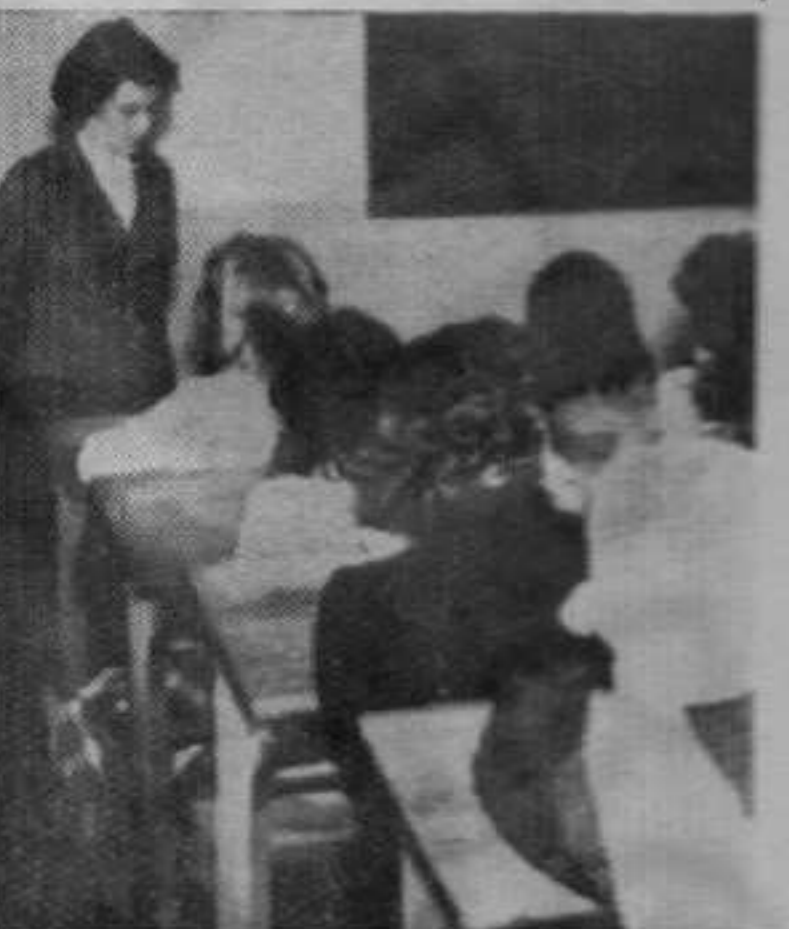
Оне нису нестрпљиве и ако је по следњи час првог подгофа. То је свакако зато што су бриге око матуре веће од радости распуста.