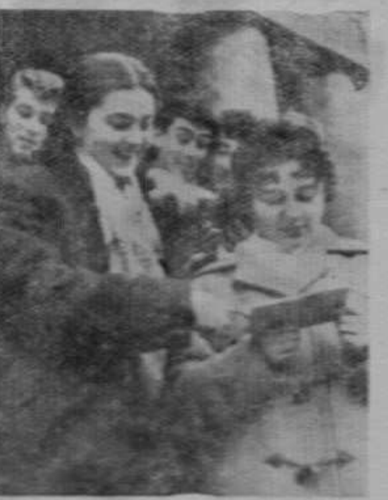
Професори су рекли своју реч, ко ја је извела радост за оне људике а суме за оне који су више волели забаву.