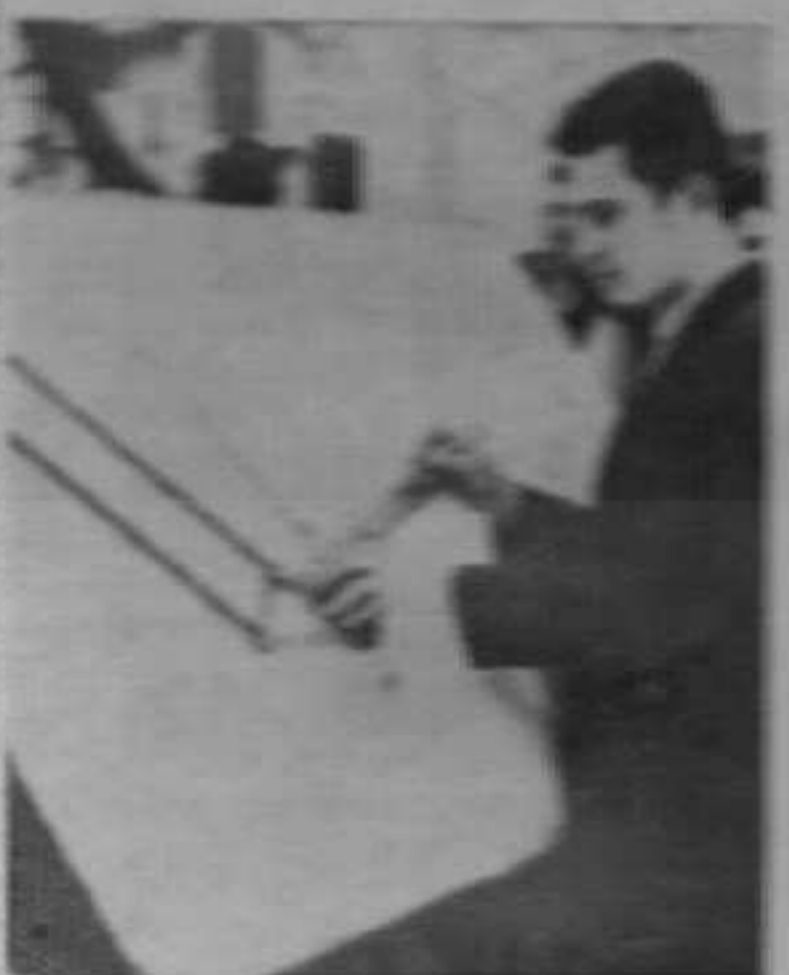
Фабрика вагона у Устипољу савремене производње изводи сабиљску техничку опрему која се налази у посебним бункерима.