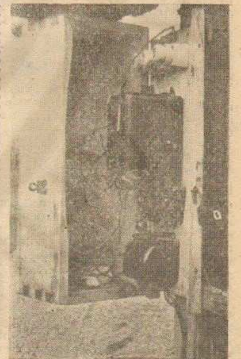
Често су прекидачи прикључака струје високог напона смештени провизорно и неосигурани (случај у Обрви). Последње оваквог начина увођења инсталација претстављају велику опасност не само за раднике већ и за пролазнике.