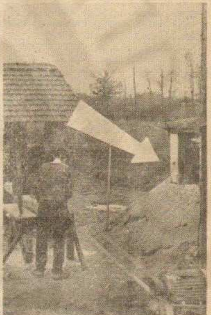
Електрична енергија све више налази примене и на селу. Не само за осветљење, већ се струја употребљава и за погоне мотора, али...