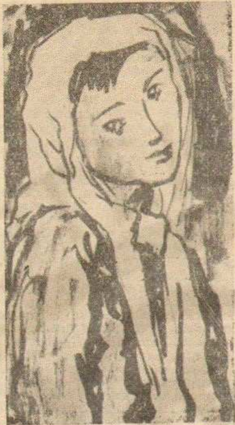
М. АНТОНОВИЋ: Девојчица

Мала се вратила освежена, и мало је порасла, и са сазнањем да је сада ученица петог разреда. Али није мислила да је то нешто много теже него што су претходни разреди. Чак јој није било тешко да језик преломи и да од рачуна каже математика или од природописа биологија. Веровала је да се све може.