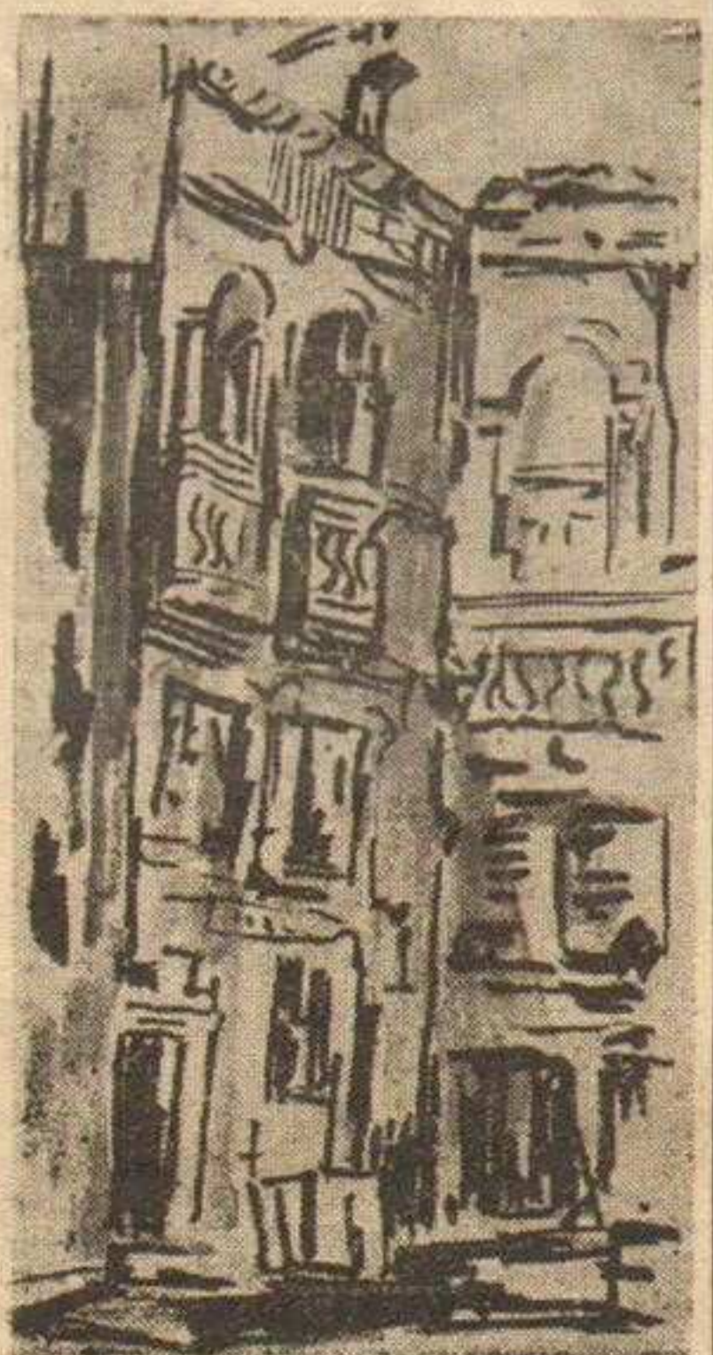
М. АНТОНОВИЋ: Детаљ из Дубровника

Почела је са радом школа за омладинске руководиоце. Око 160 посетилаца Омладинске школе, у којој ће настава трајати око три месеца, упознаће се са многим актуелним друштвено-политичким и омладинским проблемима. Поред тога, слушаоци омладинске школе повремено ће присуствовати састанцима радничких савета.