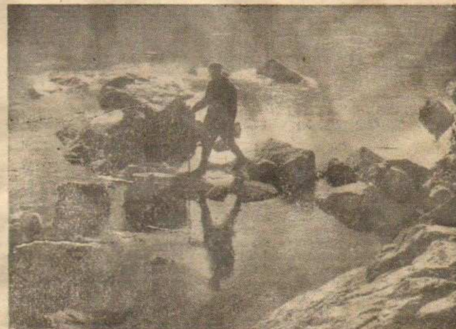
СИГУРНО КАО И АУТОР: Прелаз преко реке — рад М. Пеина, награђен првом наградом

За изложбу је владало велико интересовање што најбоље сведочи о интересу посматрачког аудиторума.