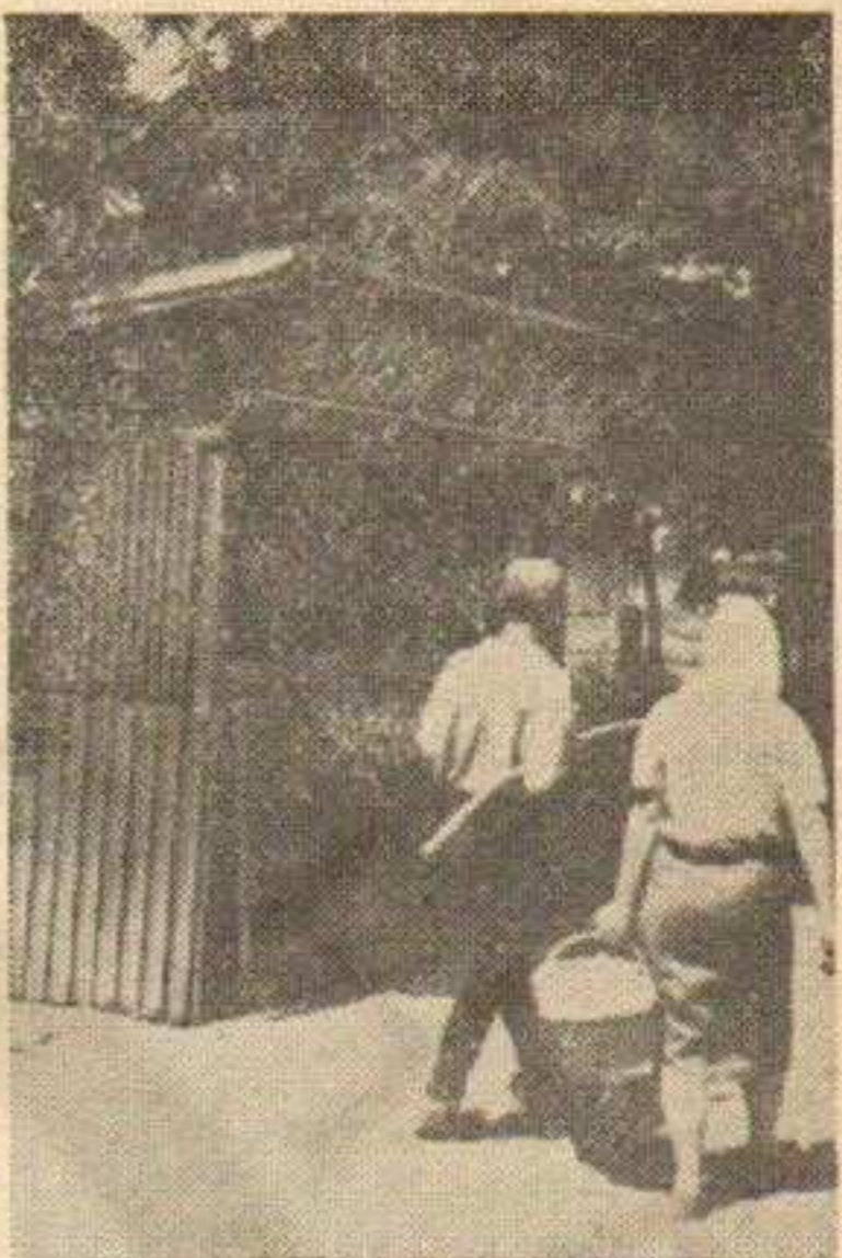
Продавалица воћа и поврћа

Од почетка свог рада Комунална банка у Краљеву је од 18 априла