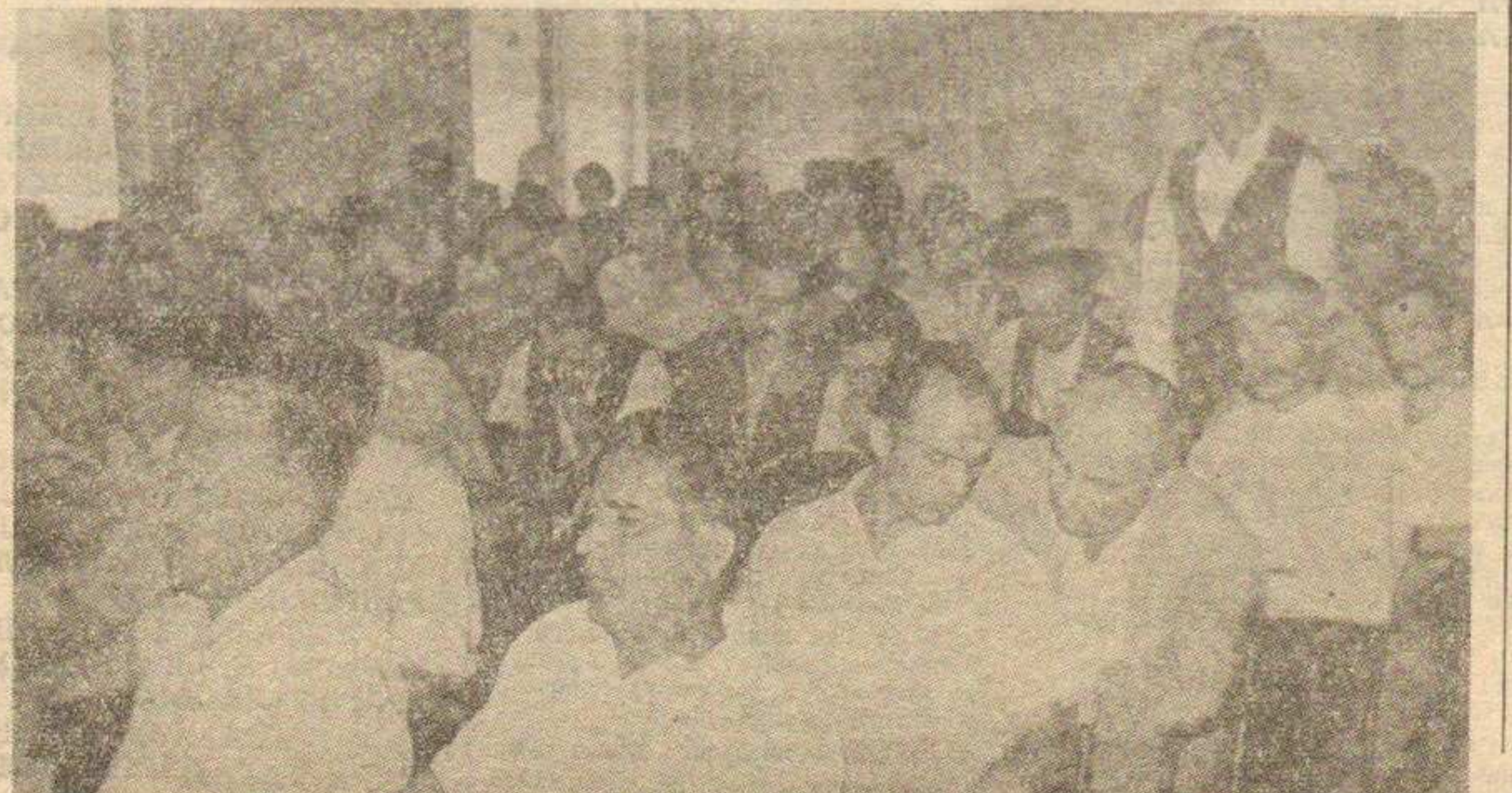
Одборници за време дискусије на задњој седници Народног одбора среза Краљево.