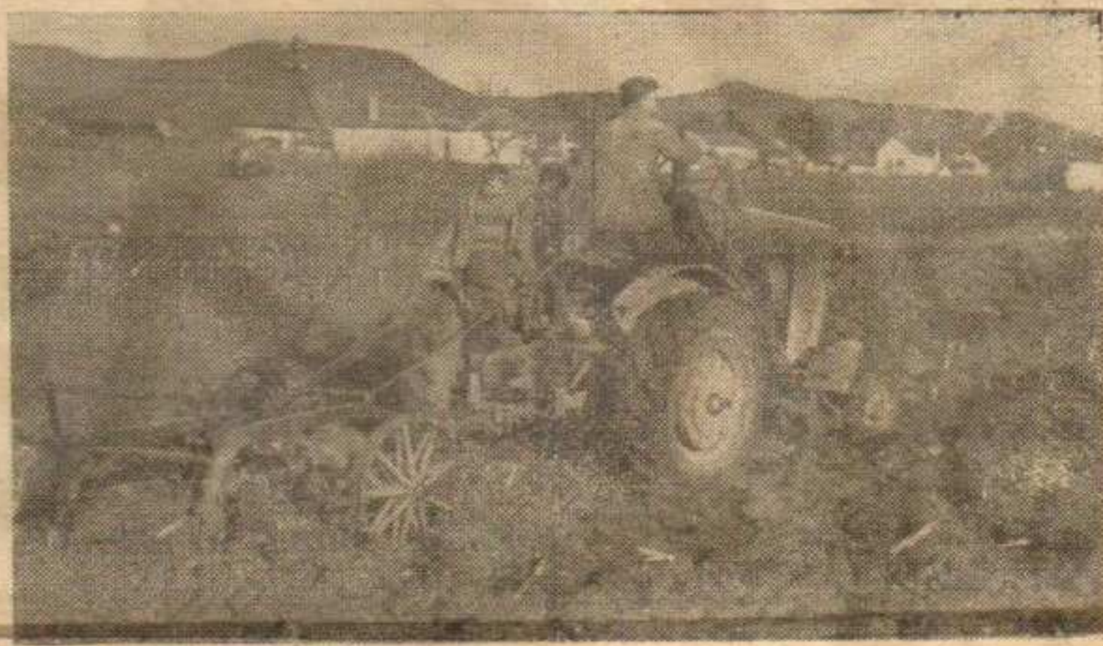
ТРАКТОР НА ОРАЊУ

У наредној години треба проширити и појачати активност задруга на плану културног и опшег уздизања