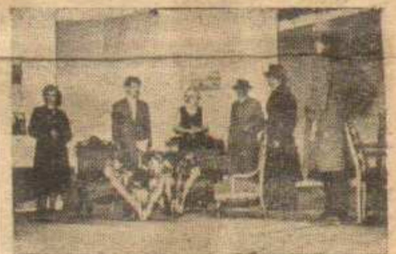
Драмска секција КПД „Браћа Маричић“ из Жиче