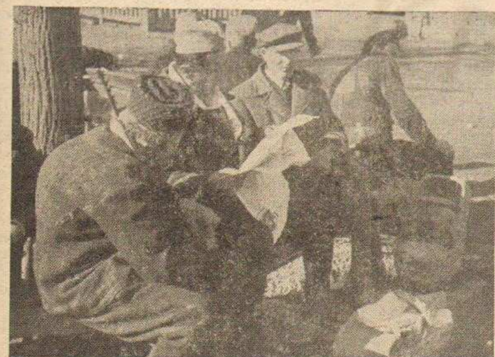
Сучини мартовски дани измамили су многе напоље. На мањој слици видите групу путника, како се у очекивању воза