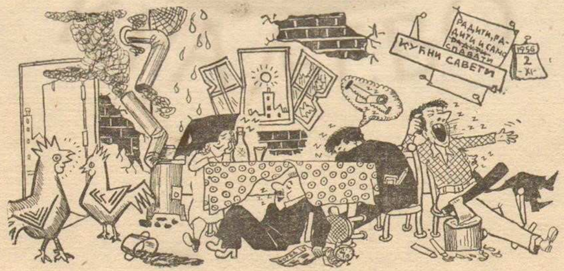
Не буни се, ја сам старији певац и ја ћу их први пробудити