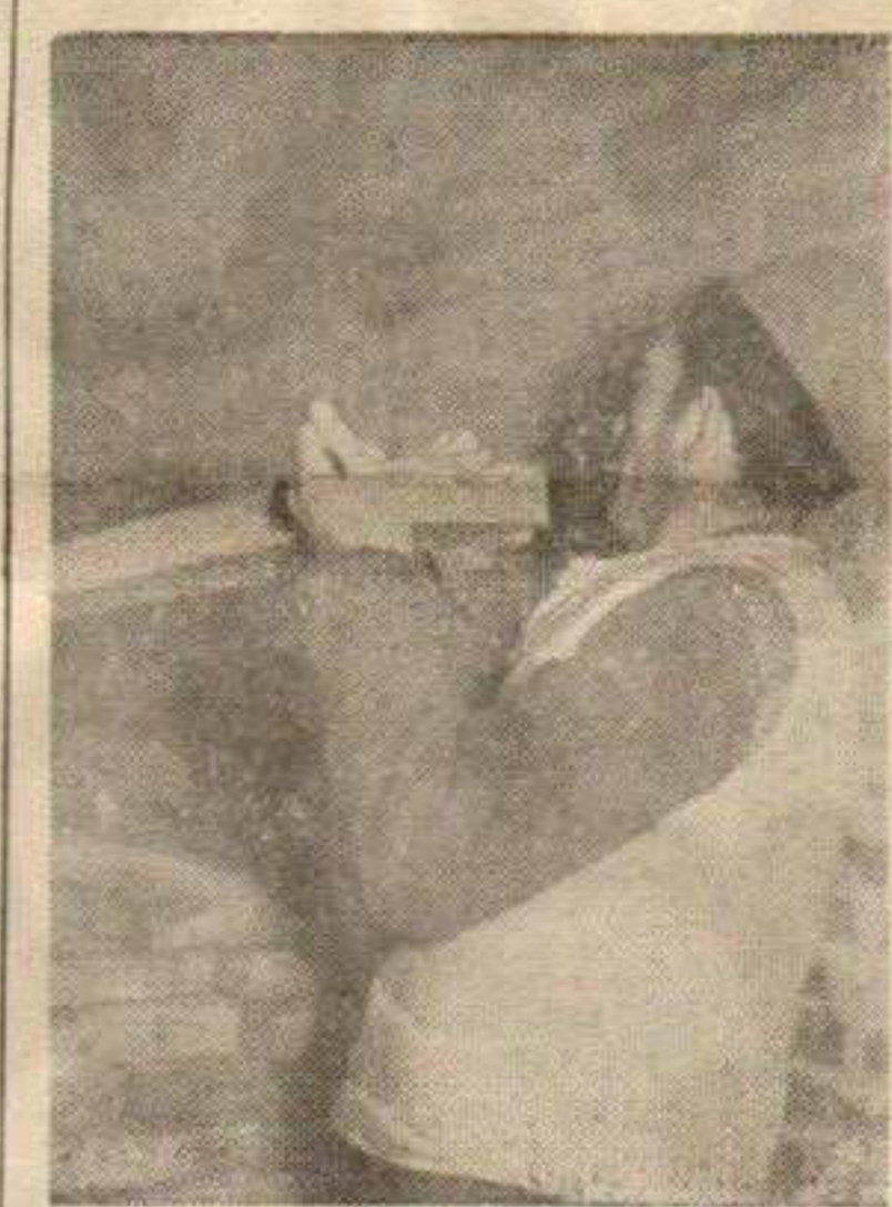
Радник у комори сушаре

ка грађа је изишла из сушаре као здрава прерађевина. За четири месеца рада на испитивању и реконструкцији, погон је доведен у нормално стање и грађа се више не витопери. Повећањем производње суве