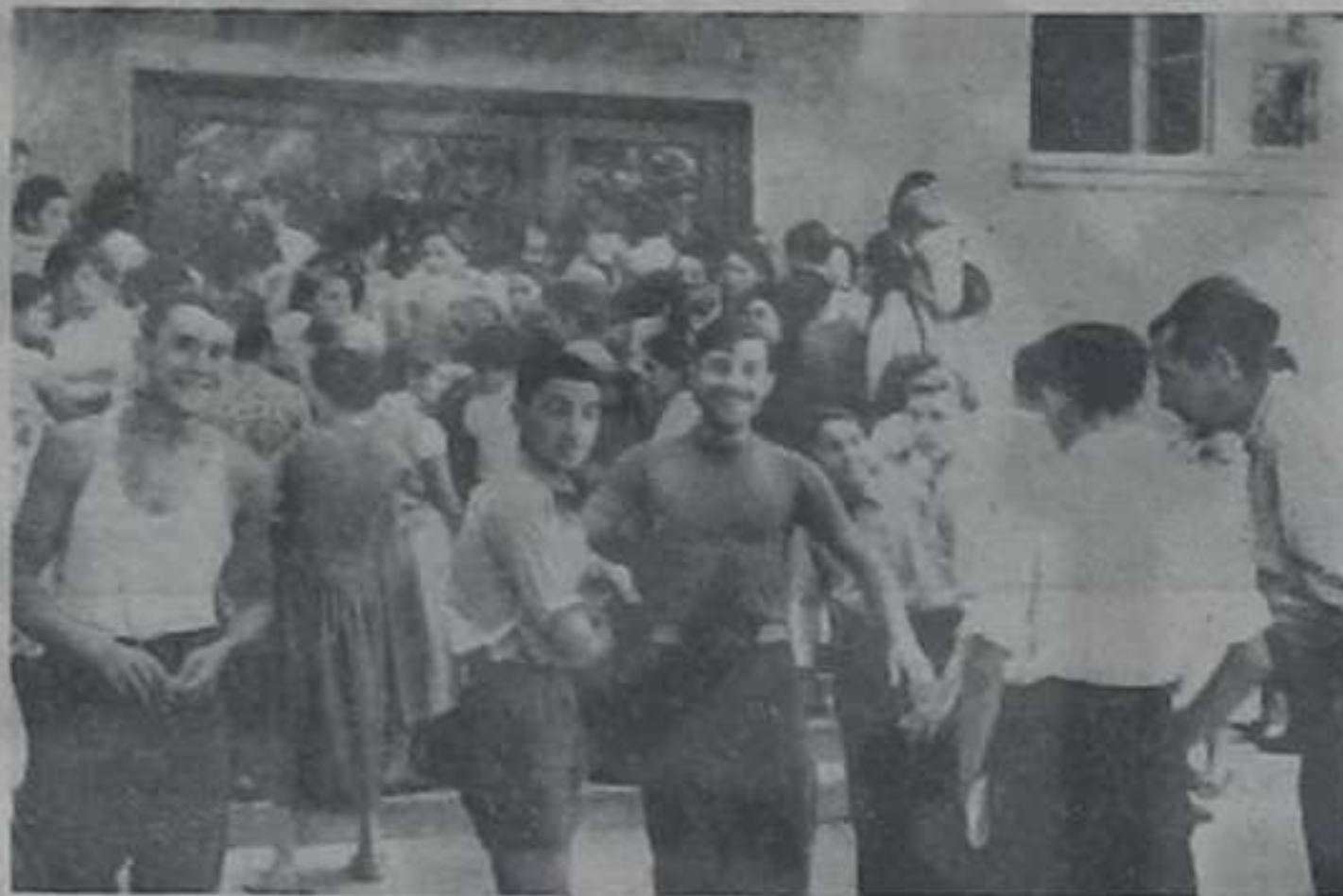
Ученици гимназије за време одмора