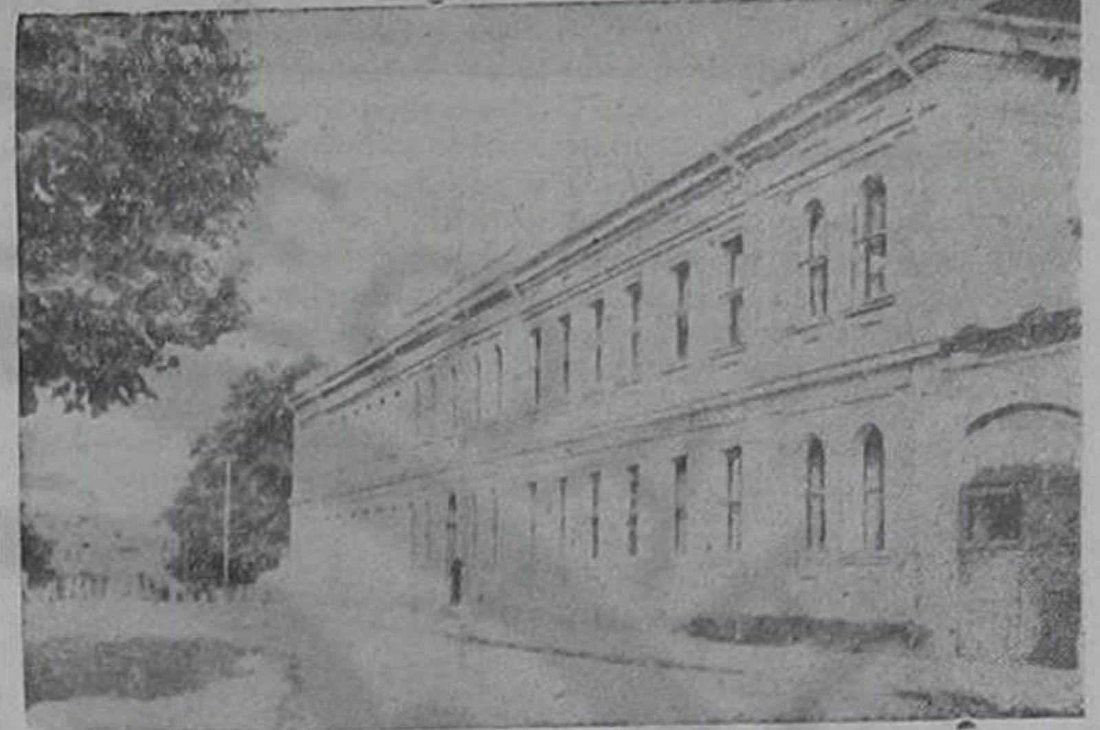
Зграда Окружног и Среског суда

не органе СУП-а и управну струку. Поред њих на семинар су позвани финансиски и тржишни инспектори и ревизори Среског савеза земљорадничких задруга. Предавања се др-