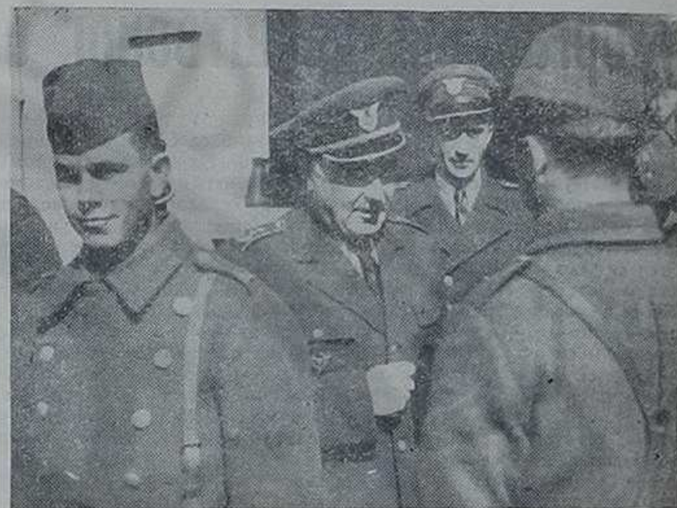
Старешине међу војницима

Десно, воде врата у салу приредбе и саставака. По задњима урамљене висе слике народних хероја, изводи из историјата КПЈ и НОБ-а, Титов пут мира и послератни развој индустрије. У другој витрини, испод стакла стоје руде од магнетита до шмота. Столови и клупе по средини сале чекају у тишини да помогну, у поподневним часовима, за свест војника. Насмејана, бронзана Титова биста је врхунац те уређености и педантности.