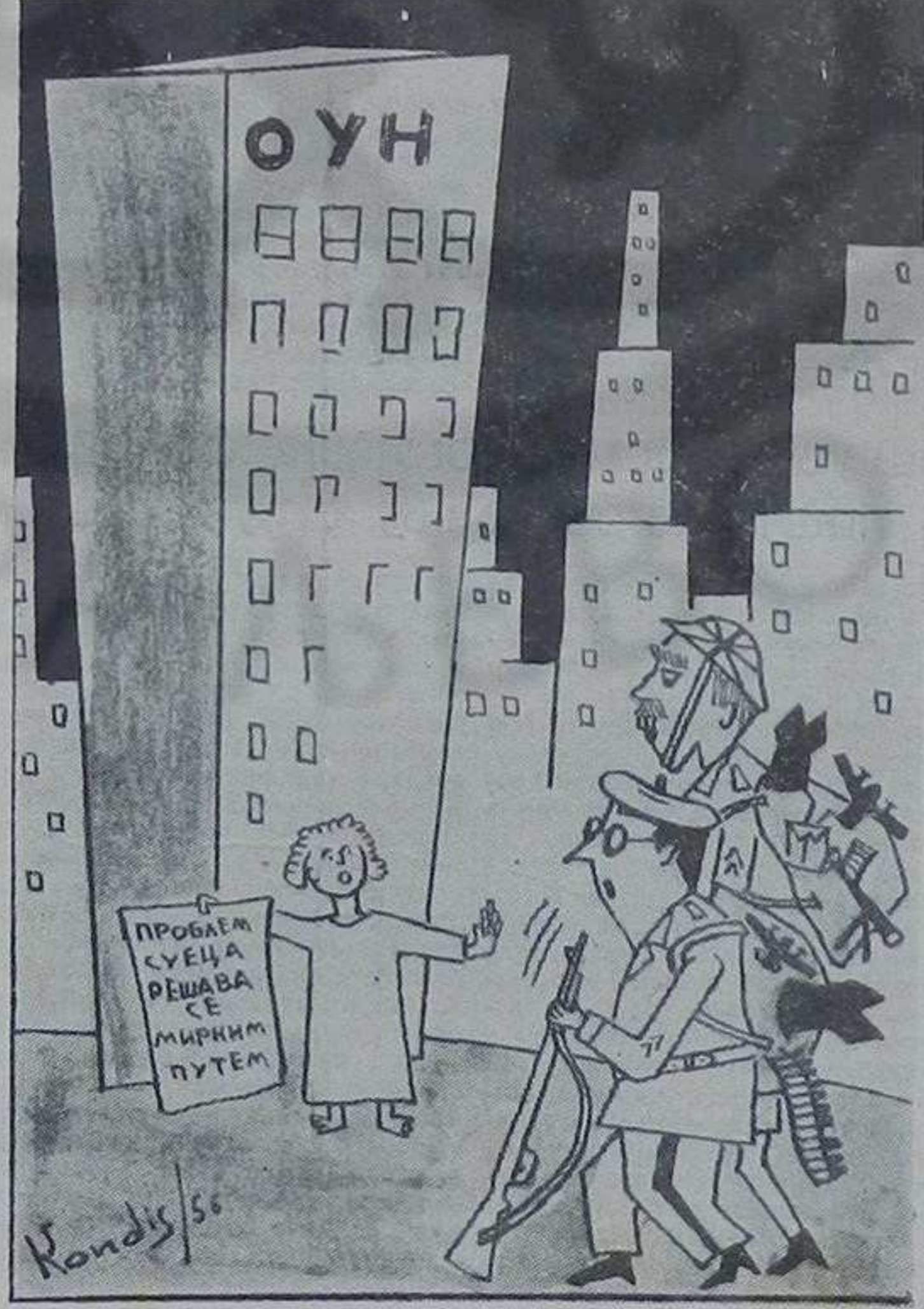
— Тосјодо, са прџајом не можете унушра!