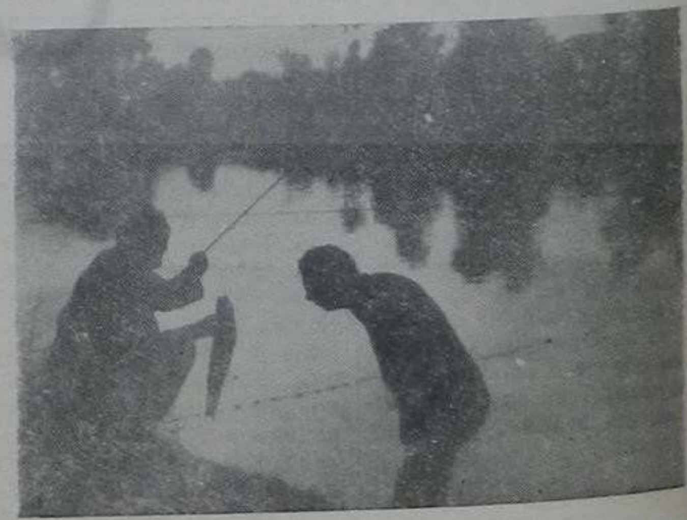
Прави спортечки риболовци дуго уживају у оваквим тренутцима...