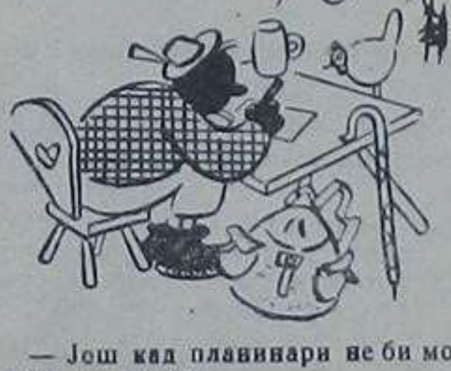
— Али, господе!