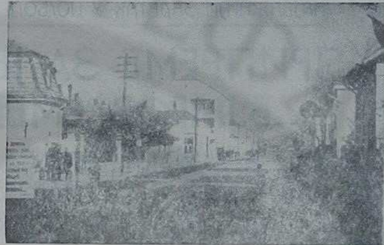
Детаљ из Рајићеве улице

шно. Нечистоћа ваздуха изнад градова не стоји увек у директној сразмери са величином ових, већ је условљена сплетом многих и сложенијих чиниоца. Исто тако, ни фабрички димњаци нису једини и искључиви извори честица дима, прашине, штетних гасова и др. непожељних примеса у ваздуху. Зар наше прашљиве улице, нарочито оне са лошом и никаквом подлогом, затим разна запуштена сметишта и кућни димњаци нису довољни резервоари за све штетне примесе градском ваздуху?