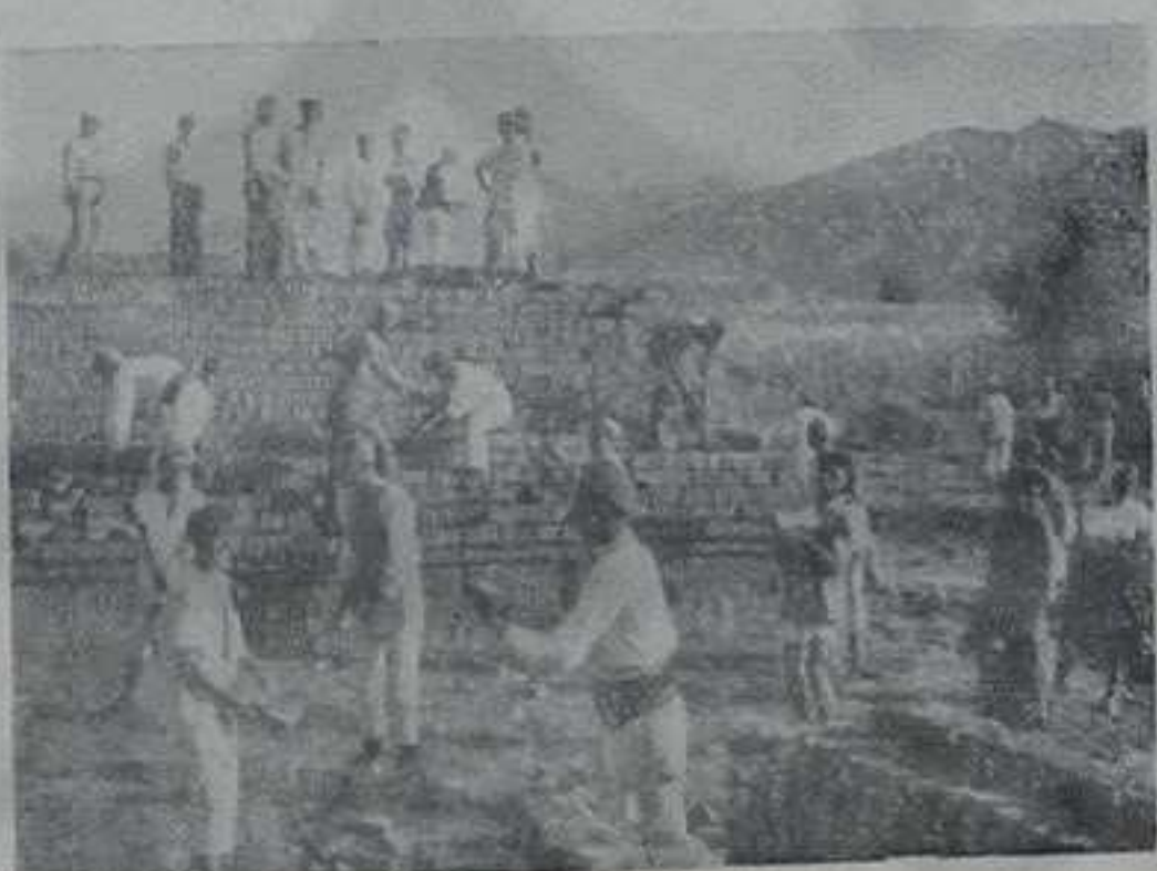
ГРАЂАНИ ГЊИЛАНА НА ЗАЈЕДНИЧКОМ РАДУ

Селјаци села Гњилана већ дуго година граде осмогодишњу школу која треба да има 12 учионица. Од НО Среза Гњилинчани су добили 500.000, а укупна вредност материјала и радова треба да износи 5.000.000 динара. Темељ школе је постављен. Грађевински материјал је припремљен, — доброволјним радом, селјаци су испекли 200.000 цигала. Радови су у току.