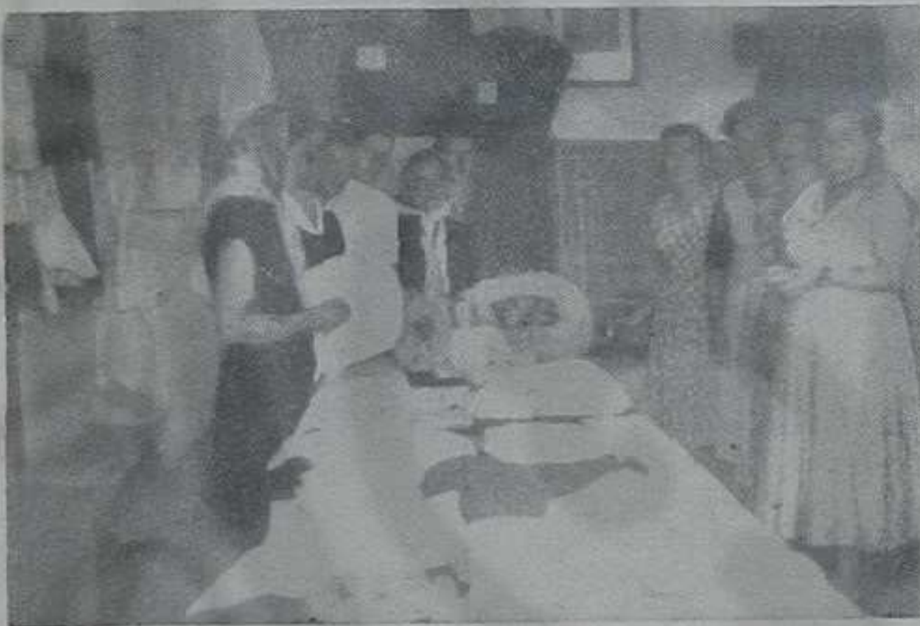
Оне су завршиле течај...

Народни Одбор општине организовао је тромесечни курс кројења за омладинке из околних села: Врњаци, Рудинаца, Врњачке Бање и др. За овај курс је владало велико интересовање, али је услед недостатка просторија, било омогућено да га похађа свега 56 ученица.