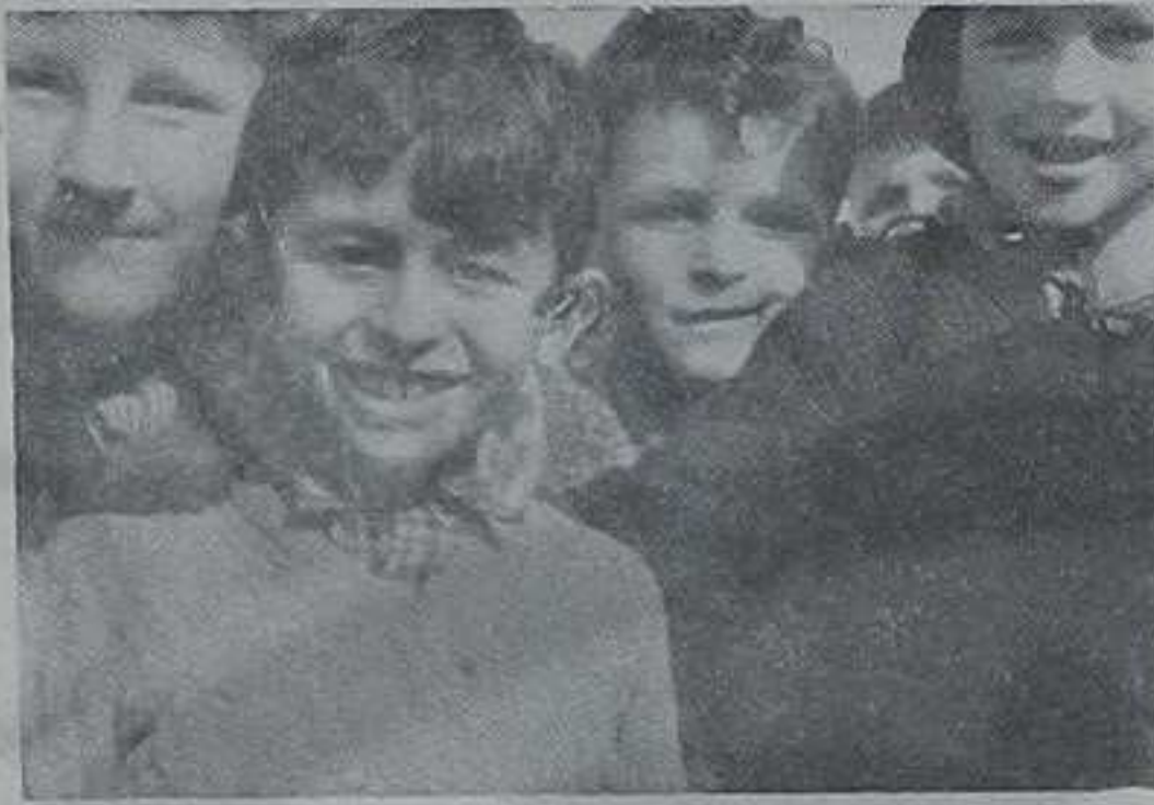
У паузи између два часа

Чудна просветна политика. — Зашто поподневна настава? — Колико кошта рачунаљка? — Огрев треба на време набавити.