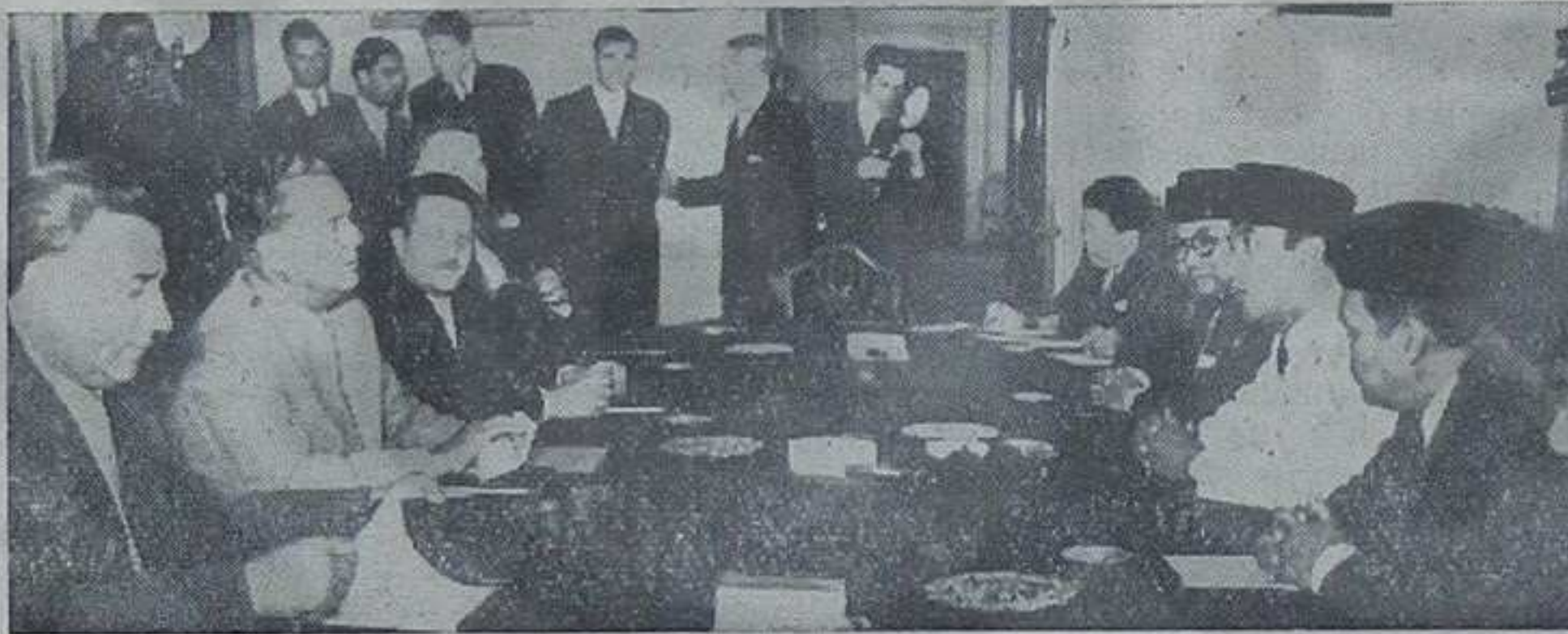
После боравка од неколико дана Претседник Рајублаке Индонезије највише је нишу земљу обрађивајући се од претседника Тита и њених сарадника изјавио је: „Ви сте далеко али сте увек блиски мојеј срци“.

— Претседник Тито прихватио позив да посети Индонезију —