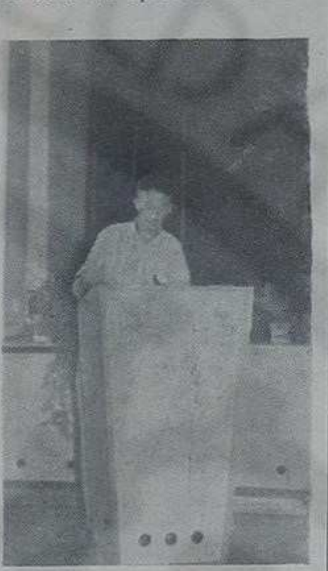
— Хеј, ви ђозади, љустити ме да је заирлим!

чија ће снага бити 20MVV и на Ибру код Ушћа, чија ће снага бити 33 MVV. Вредност и важност