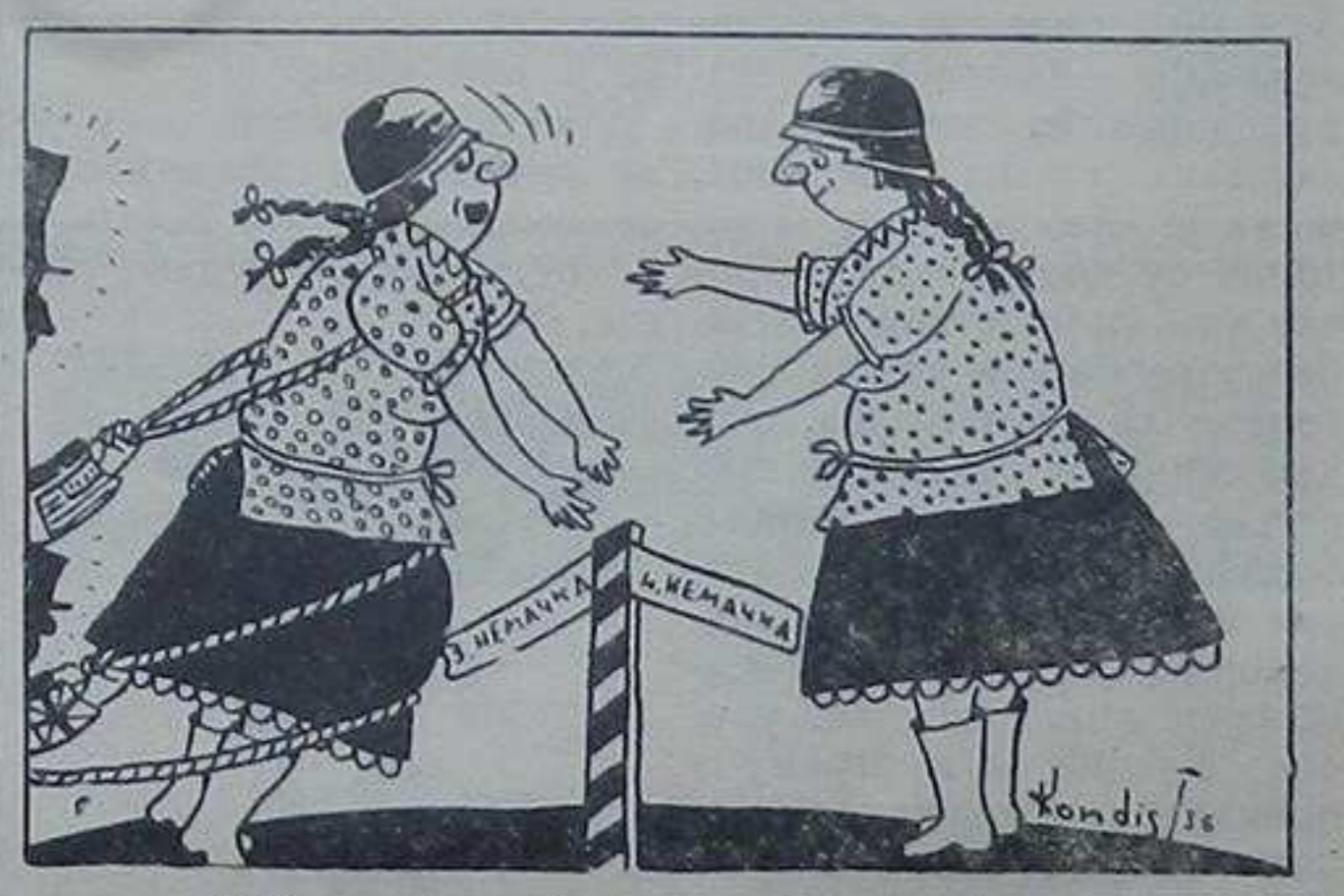
— Хеј, ви ђозади, љустити ме да је заирлим!