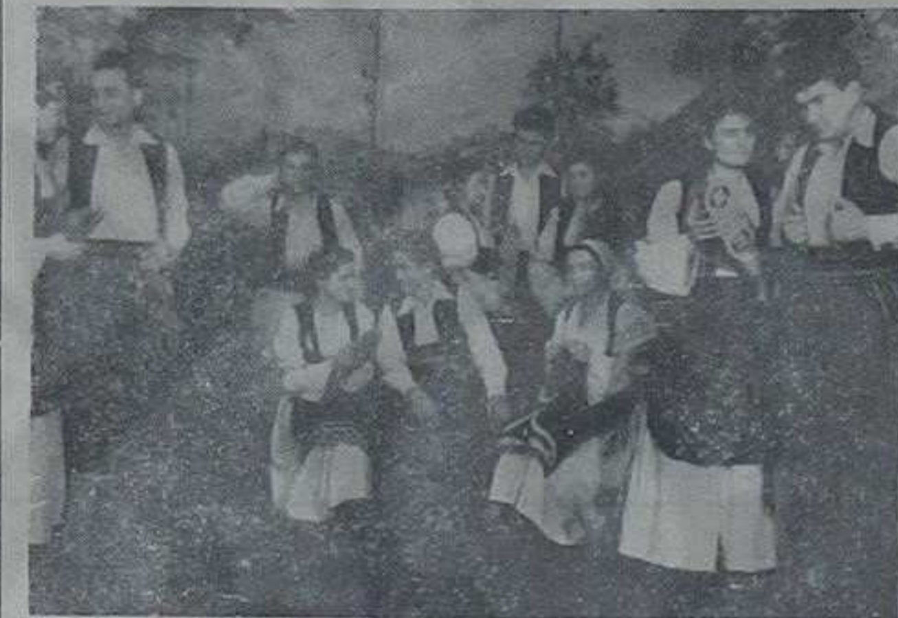
Са једне приредбе КУД «Абрашевић»