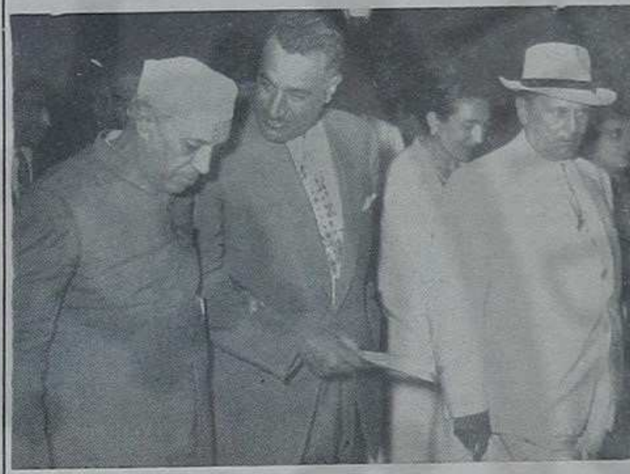
На слици: Премијер Нехру, Председник Насер и Председник Тито после успешно обављених разговора.

На Брионима су 18 и 19 јуна одржани тројни разговори на највишем нивоу између Председника Тита, Председника Републике Египта и Председника владе Индије. Заједничком изјавом, која је том приликом дата, потврђује се правилност политике коезистенције и сарадње на свим пољима којом су се и руководиоци владе трију земаља. Између осталог констатовано је да се миру у свету не може постићи поделом света на антагонистичке блокове, већ тежњом ка колективној безбедности, и проширивањем области слободе