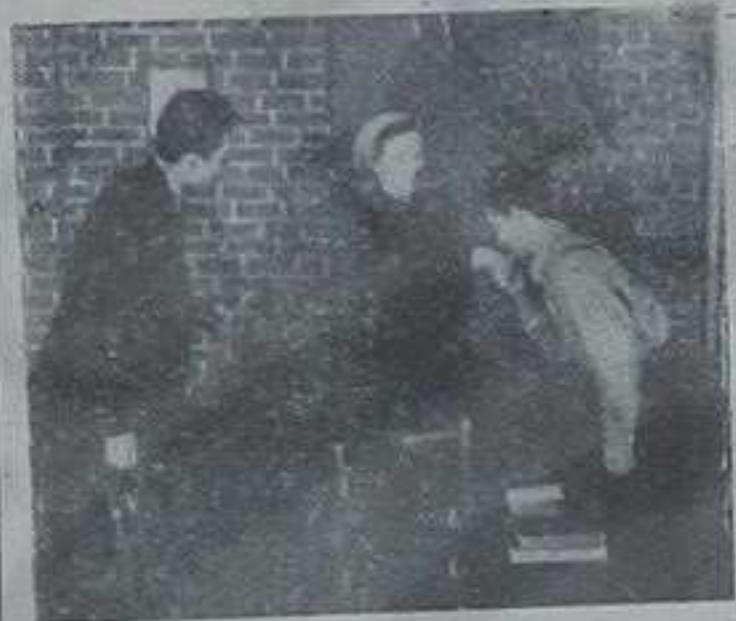
Драмска секција „Абрашевића“ је најактивнија у друштву. На слици: Са једне премијере.