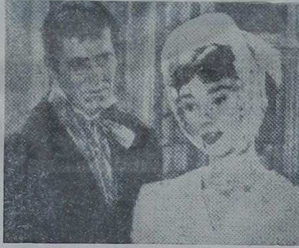
Сцена из филма „Рат и мир“

ЉУДИ И ВУКОВИ омишљени посебним дахом: хладноћом, снегом, усамљеношћу. Етеријери су снимали у забаченим алпским селима, а главне улоге тумаче Силвана Мавгано, Педро Армандариз и Ив Монтав, популарни француски глумци италијанског порекла (Право му је име Ђовани Ливи).