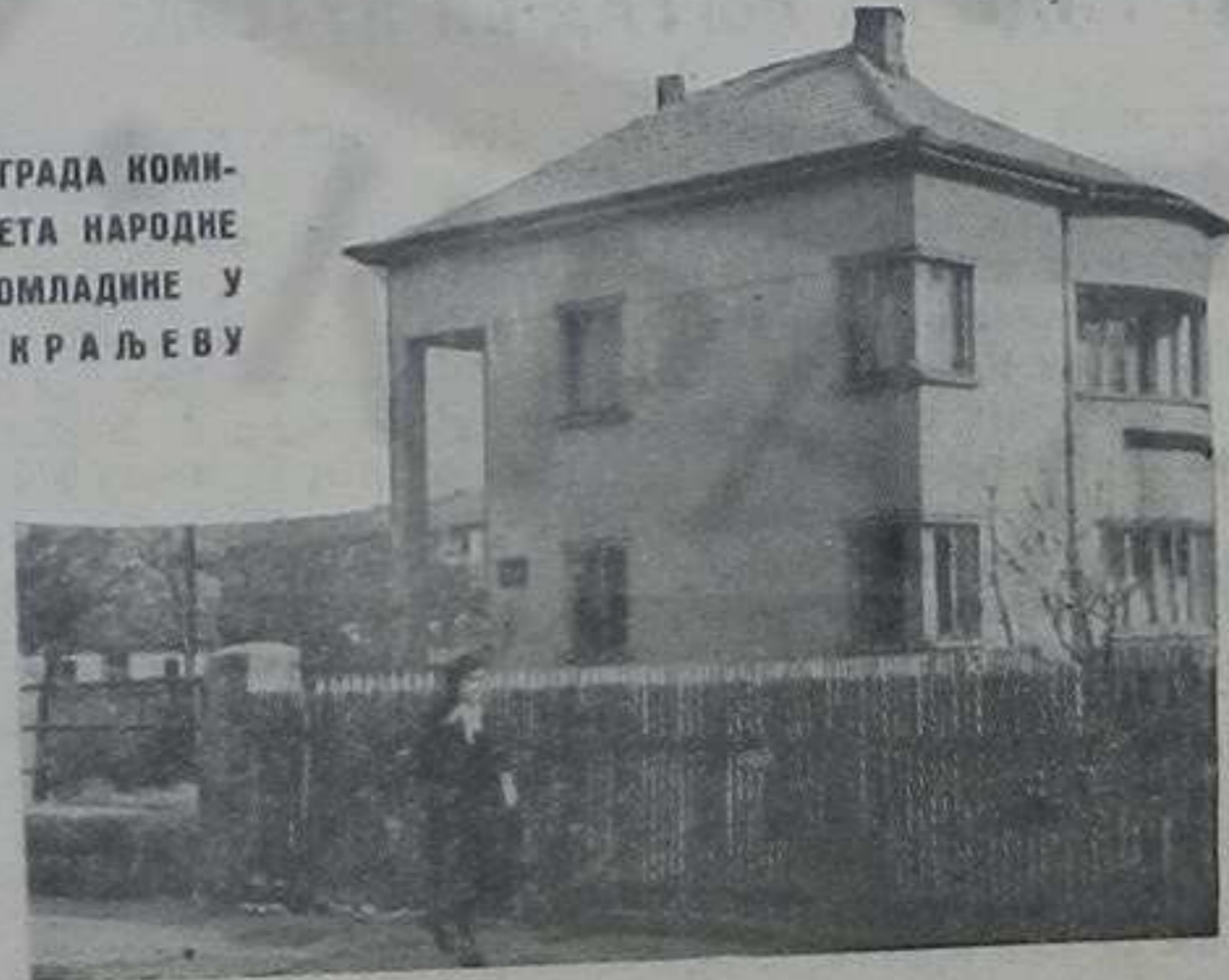
ЗГРАДА КОМИТЕТА НАРОДНЕ ОМЛАДИНЕ У КРАЉЕВУ

је Мартићки Лазар. Комитет Народне омладине ове школе посветио је посебну пажњу културно просветном раду а читаву организација предњачи у односу на друге у граду и срезу. Посебну