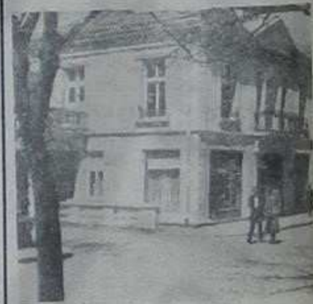
Зграда комуналне банке у Врњачкој бањи

По нашем мишљењу један од главних задатака ове банке требало би да буде, да поред редовних банкарских услуга, снабде и правилно одреди кредите привредним организацијама, појача контролну функцију у погледу наменског коришћења кредита, као и уложи максимум напора да уђе у проблематику својих комитената и буде увек спремна да интервенише и помогне у правилном решавању тих проблема. Поред овога сматрамо да би интервенција ове банке нарочито требала да добије пуни значај у времену несезоне, када би пласман у развојку нпр. неких домаћих радности и т. сл. имао добре резултате у повећању бруто продукта Општине као и већег запослења радне снаге, што је за Врњачку бању у несезони од нарочитог значаја.