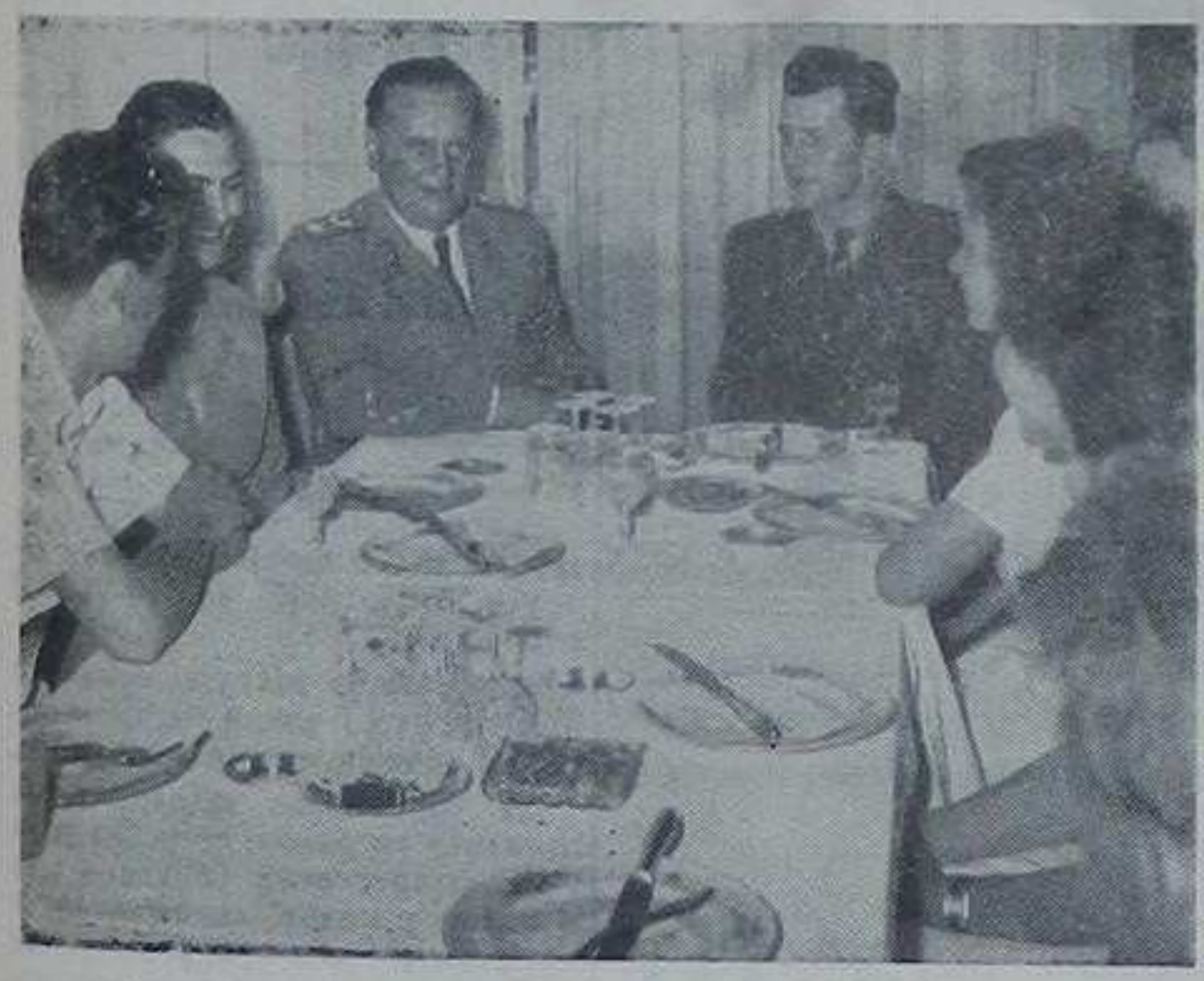
После предаје штафета, носиоци су били гости код Маршала Тита, који им је приредио закуску.