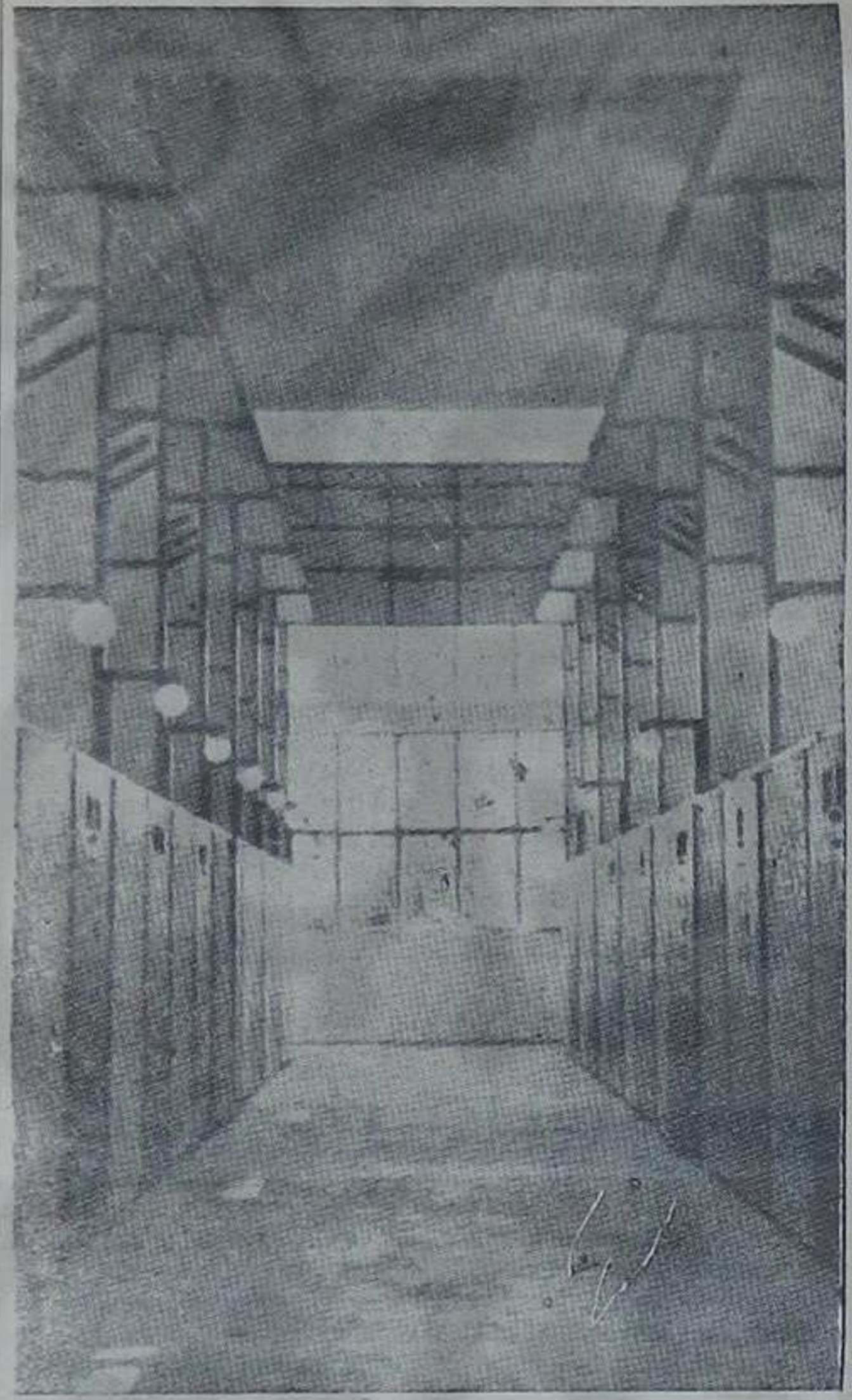
Унутрашњи изглед трафостанице у Конареву

Оваквих трафостаница имамо мало у нашој земљи, а према чистоћи и уређености, којој се овде посвећује велика пажња, верујем да стоје на завидном месту.